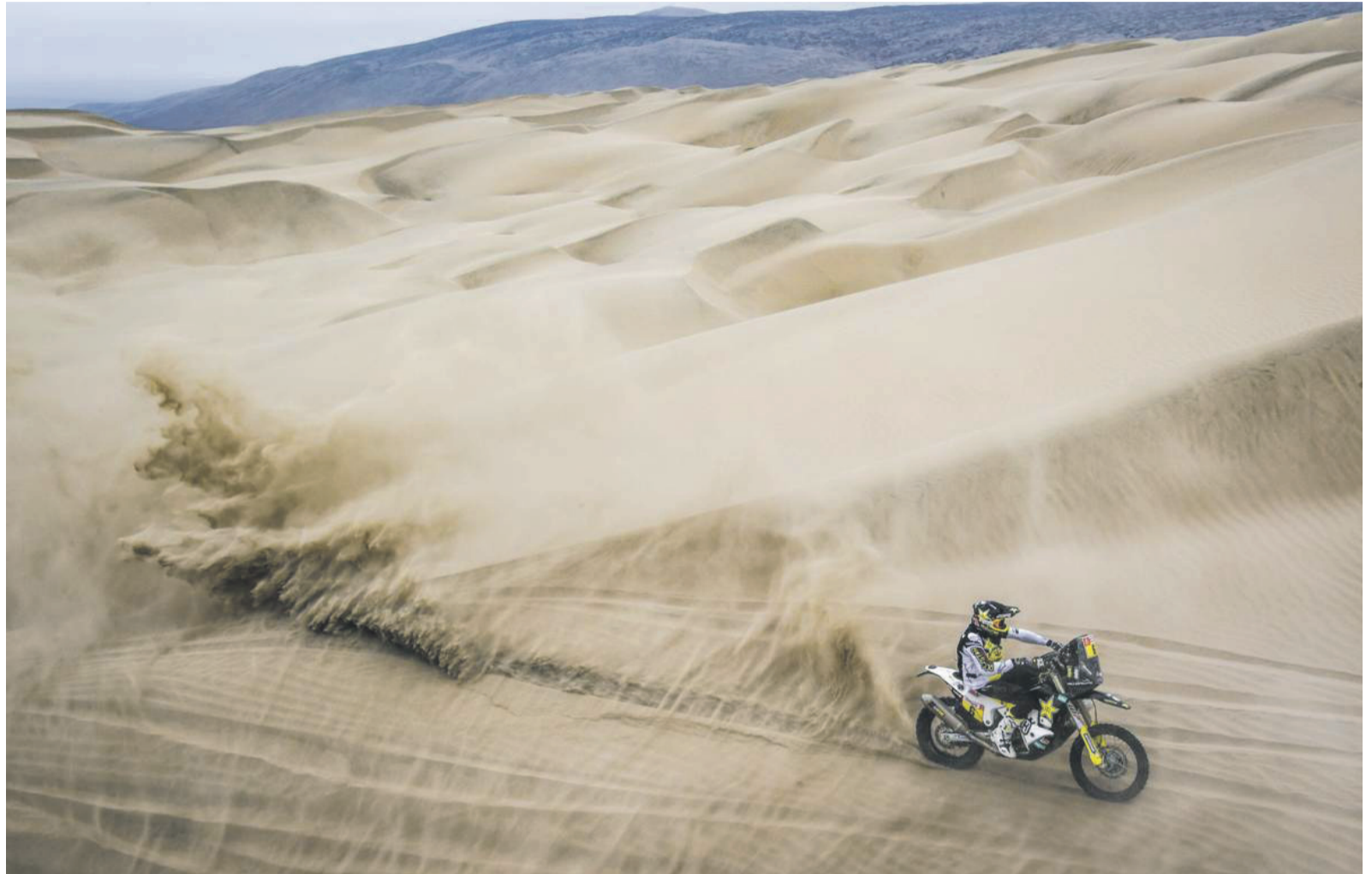
Quintafondo en acción. El piloto chileno mostró su temple en la edición de ayer y hoy buscará ser cauto ya que tendrá que abrir camino.

En esta jornada el español Lorenzo Santolino (Sherco), piloto revelación de este Dakar, se vio obligado a abandonar el rally por una fuerte caída