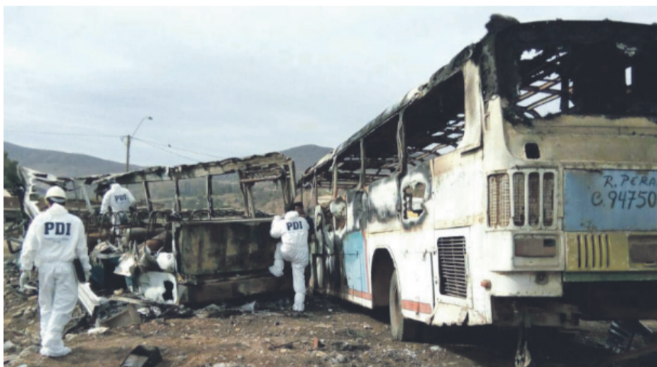
El 27 de mayo a eso de las 22 horas en el barrio industrial de Ovalle ocurrió el siniestro de dos vehículos, lo que desembocó en la detención de dos presuntos responsables.