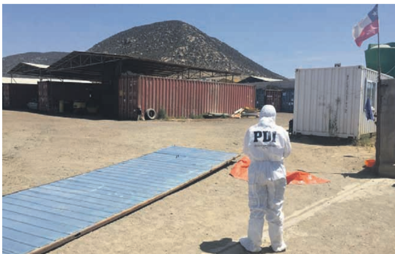
En este lugar ubicado en el Panul se encontraba desarrollando sus labores el ciudadano chino cuando sufrió un accidente que le costó su vida.