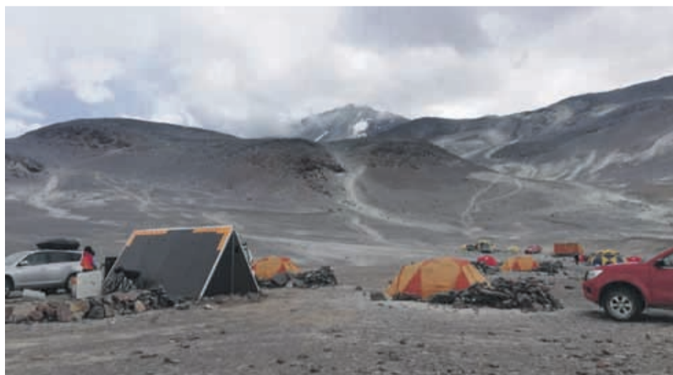
El Ojos del Salado es una montaña inmensa con condiciones climáticas únicas y adversas con una puna atacameña durísima, visitada por cientos de expediciones de todo el mundo.