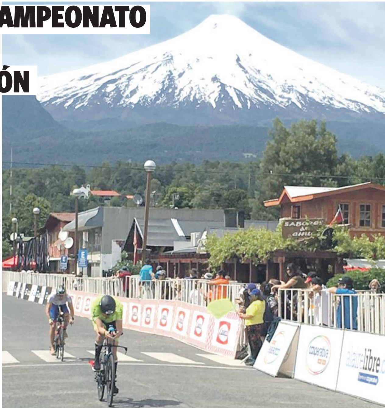
Una hermosa postal con el volcán Villarrica de fondo caracteriza a Pucón, una de las pruebas más bellas del mundo.