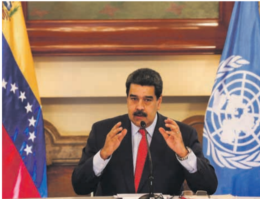
Maduro descartó que fuera una orden directa del Gobierno de Venezuela y lo tildó como un show mediático

Desde el gobierno sostiene que fue una decisión "uni-