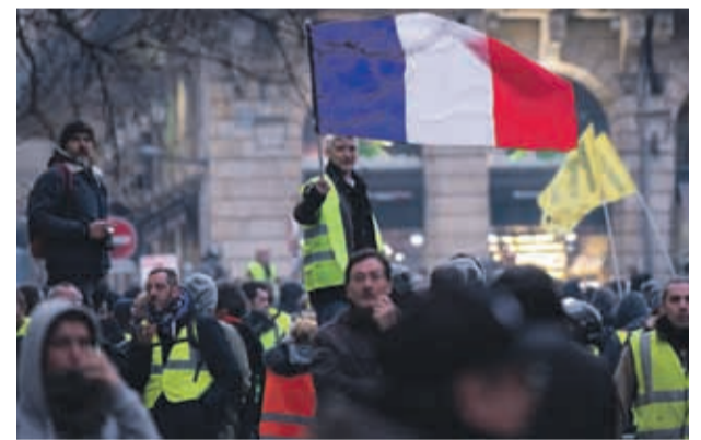
Los enfrentamientos de los chalecos amarillos en París, Francia.

Desde el inicio de las manifestaciones 10 personas han muerto en accidentes relacionados con las protestas y más de 1.600 han resultado heridas.