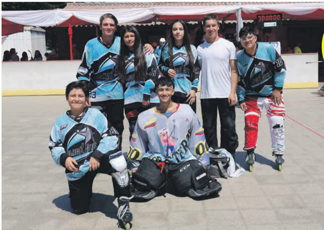
Black Star de Santiago, ha sido protagonista de la nueva edición de la Copa Serena Fuego.