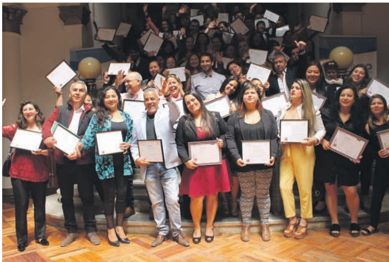
Los cursos dictados en la conurbación fueron Contabilidad Básica y Gestión de Emprendimiento (ambos para pequeños empresarios y productores); e Inglés Básico (para personas desempleadas).

Ambos programas significaron una inversión de alrededor de $75 millones a través de 11 cursos desarrollados en ambas comunas por el organismo técnico Asincap