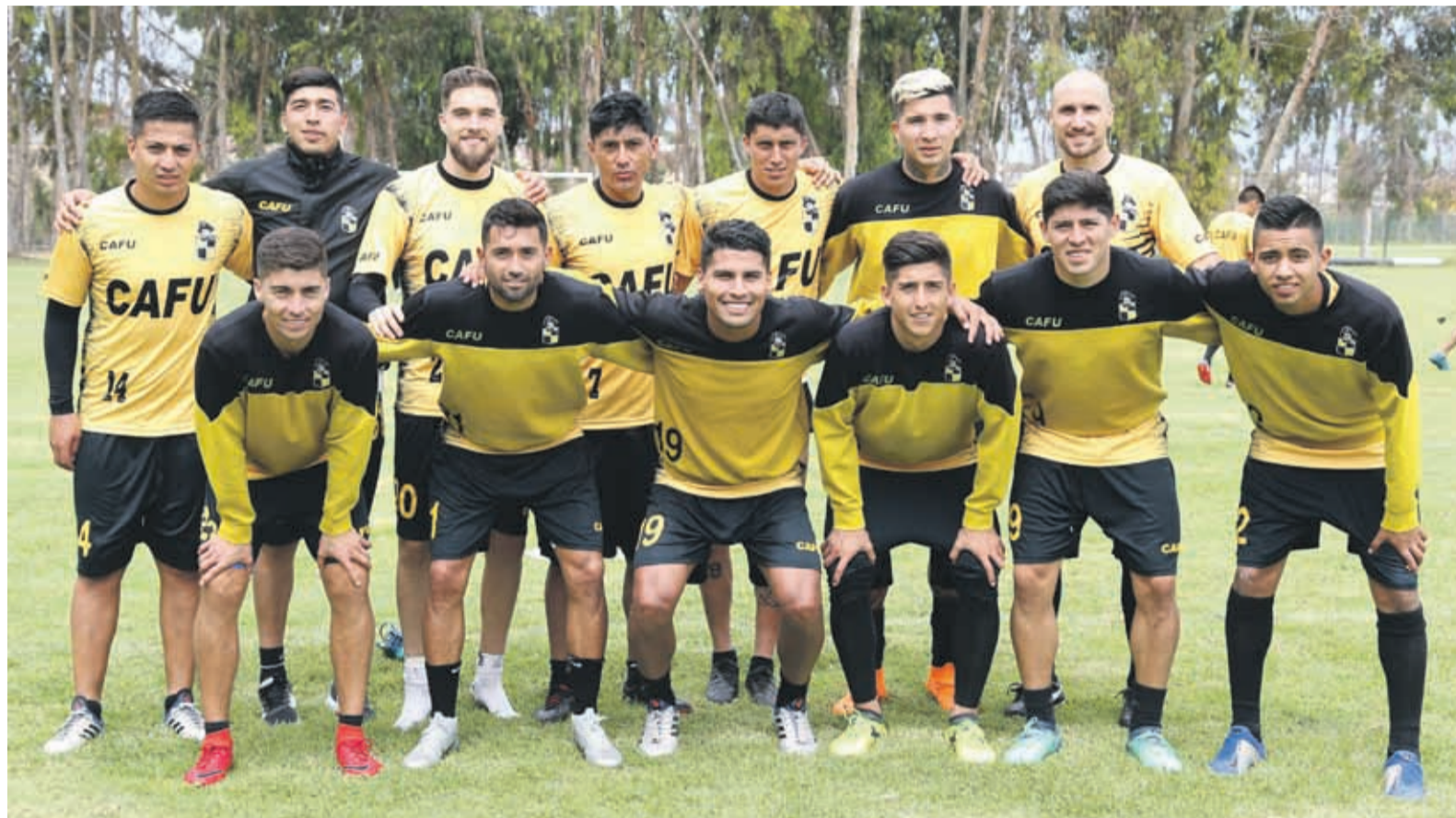
Los nuevos jugadores de Coquimbo tendrán su primer amistoso de preparación mañana ante la U.

En conversación con el programa deportivo de Radio Mistral, el defensor argentino, se mostró optimista que esta situación se pueda zanjar rápidamente, “me muestro confiado que la nacionalización saldrá antes de que comience el torneo, aunque