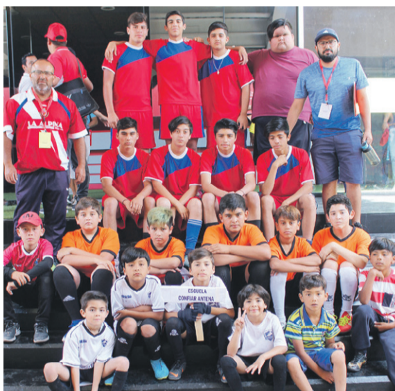
Deportivo CONFIAR de la Antena -La Serena.