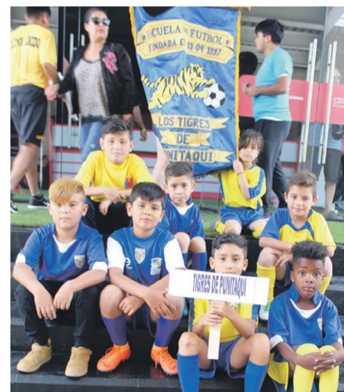
LOS TIGRES de Punitaqui.