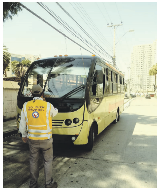
La autorización otorgada por la Seremi de Transportes y Telecomunicaciones tiene vigencia hasta el domingo 01 de marzo.

En relación al uso del pase escolar, la normativa legal permite el traslado de los alumnos durante todos los meses del año en el transporte mayor. Todos los que posean la TNE vigente, podrán hacer uso de ella de lunes a domingo, y las 24 horas del día.