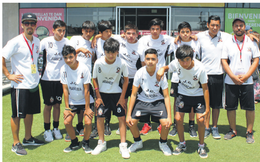
Club Deportivo JUAN CARLOS ARANCIBIA, Categoría 2006.