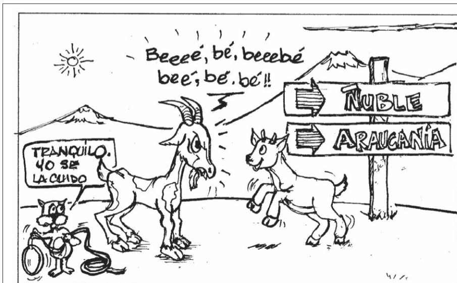
GANADO AL SUUUUUR... (Traducción caprina) "Y no se comporte como cabra loca de cerro, puéh"