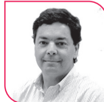
JUAN MANUEL FUENZALIDA Diputado UDI, Región de Coquimbo.