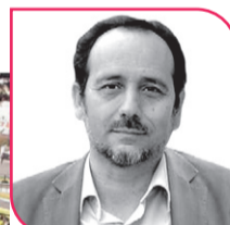
DANIEL NÚÑEZ Diputado PC, Región de Coquimbo.