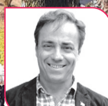
FRANCISCO EGUIGUREN Diputado RN, Región de Coquimbo.