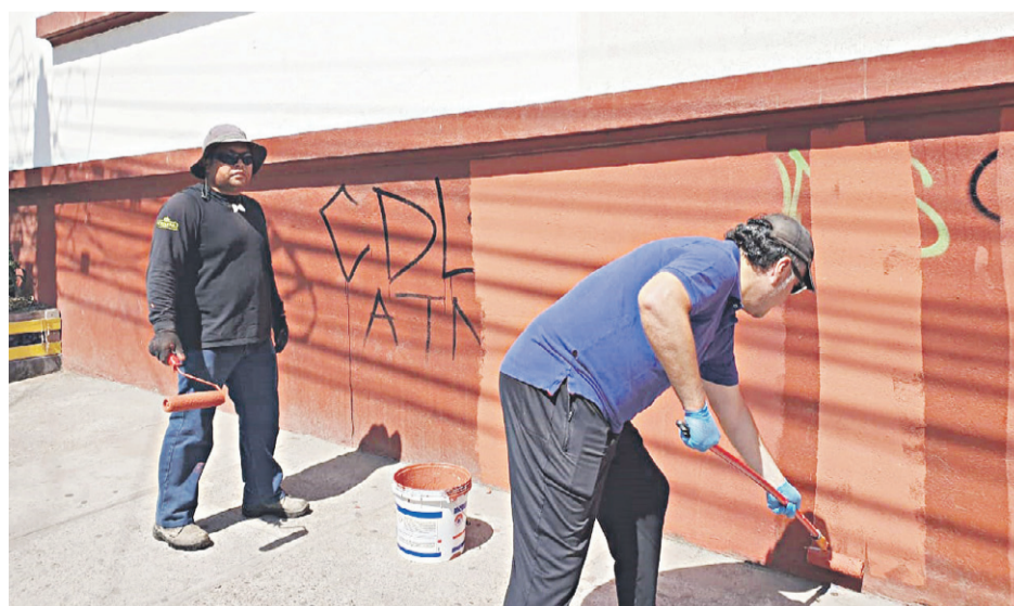
El rostro recuperado de los inmuebles no pasó inadvertido, y fue reconocido tanto por los residentes como los transeúntes y conductores.