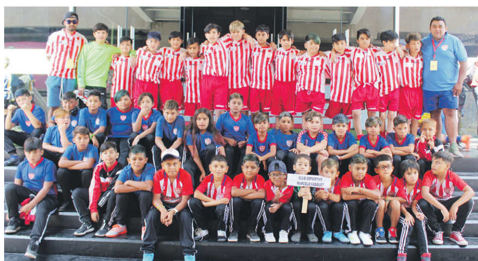
Club Deportivo MARCELO VÁSQUEZ - Antofagasta.