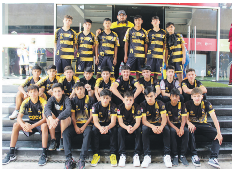
Club Deportivo y Cultural COQUIMBO.

El domingo recién pasado en la pista del Estadio La Portada, se dio por inaugurado el Torneo de Fútbol Infantil Compañía Cup 2020. Participan equipos representativos de la Región de Coquimbo, como Real Petit, Cobresal de Tierras Blancas, CAP Minería, Academia La Serena, Escuela "Promesas Celestes", Deportivo Juan Carlos Arancibia, Deportivo Mario Díaz, Deportivo CONFIAR de La Antena, Escuela Oficial de Fútbol Menores de DEPORTES LA SERENA, Los Tigres de Punitaqui y la Escuela de Fútbol Las Compañías; del sur nos visitan COSAL de Punta Arenas, MARSELLA de Conchalí-Santiago, PALESTINO de Nuñoa, Región Metropolitana; de nuestro norte los equipos de SPORTING de Diego de Almagro, deportivo MARCELO VÁSQUEZ de Antofagasta y por último a nivel internacional nos acompaña Deportivo AFAN de Perú.