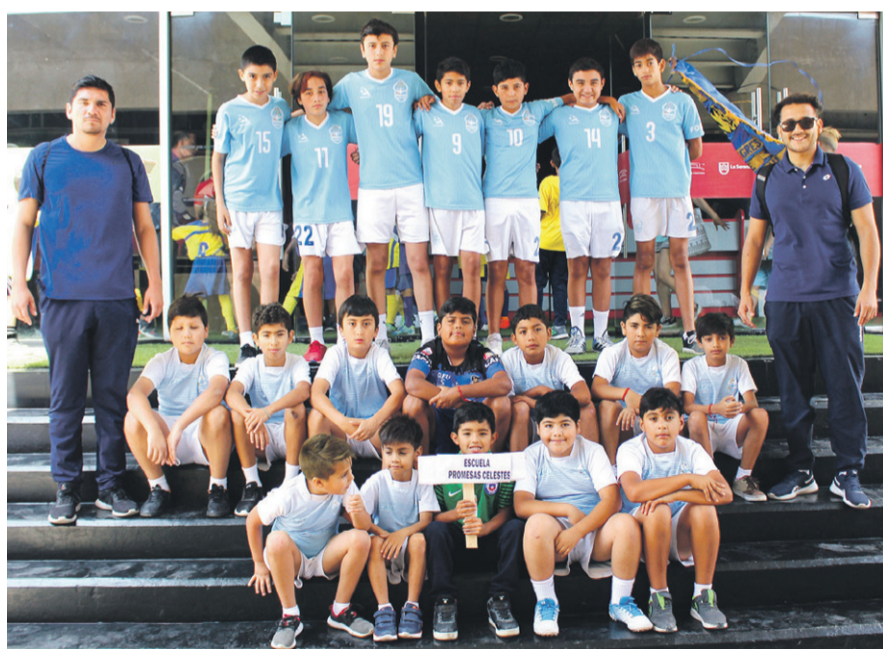
Escuela de Fútbol PROMESAS CELESTES.