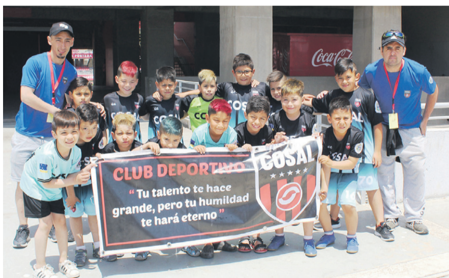
Punta Arenas, Deportivo COSAL, Categorías 2011-2012.