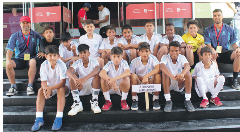
Club Marsella de Conchalí-Santiago.