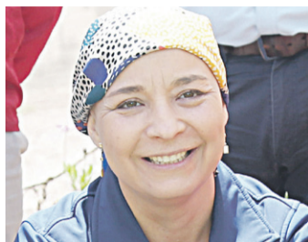
LUCÍA PINTO INTENDENTA

“Estamos realmente orgullosos de poder conocer este proyecto y poder apoyarlo a través de INDAP y, por supuesto, en medio de todo lo que significa la sequía y como ha afectado a nuestros pequeños agricultores y ganaderos”.