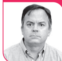
MATÍAS WALKER Diputado DC, Región de Coquimbo.