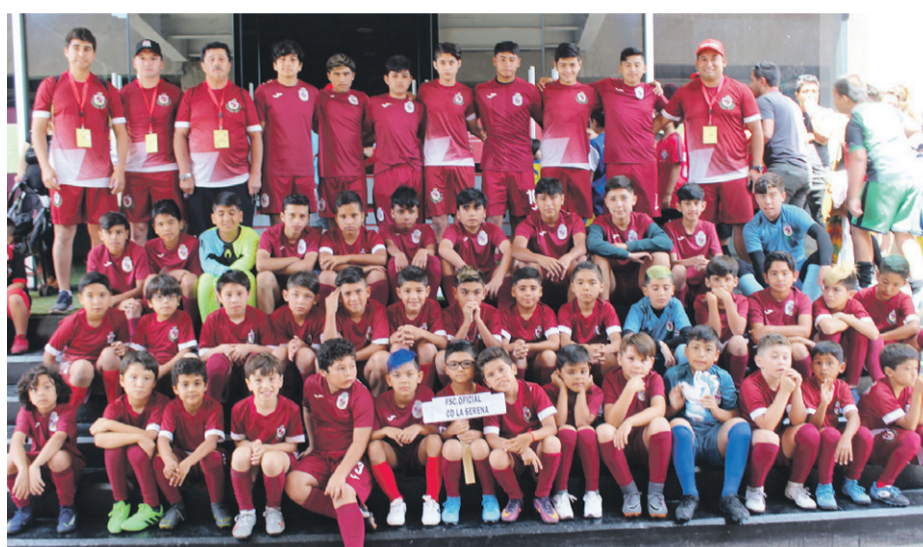
Escuela Oficial de Fútbol DEPORTES LA SERENA.