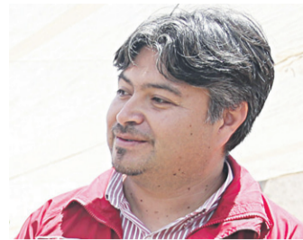
RODRIGO ORDENES SEREMI DE AGRICULTURA

“Estamos realmente orgullosos de poder conocer este proyecto y poder apoyarlo a través de INDAP y, por supuesto, en medio de todo lo que significa la sequía y como ha afectado a nuestros pequeños agricultores y ganaderos”.