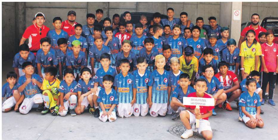
Escuela de Fútbol LAS COMPAÑÍAS.