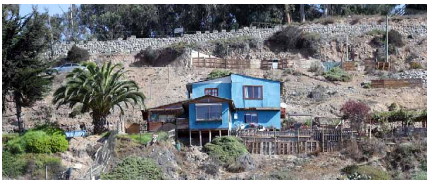
En la ladera de Alfalfares han aparecido diversas viviendas de carácter irregular, generando preocupación entre los vecinos.

Por lo mismo, y consultado por diario El Día, el seremi de Bienes Nacionales, Marcelo Salazar, advirtió que, al no desarrollarse el proyecto,