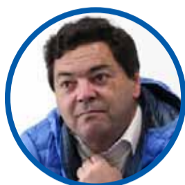
Juan Manuel Fuenzalida DIPUTADO

“Es plenamente consistente con las normas que hoy tiene la prisión preventiva, que precisamente es una medida cautelar que tiene por objeto asegurar la comparecencia del imputado en todo el juicio”