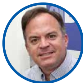
Matías Walker SENADOR

“Es plenamente consistente con las normas que hoy tiene la prisión preventiva, que precisamente es una medida cautelar que tiene por objeto asegurar la comparecencia del imputado en todo el juicio”