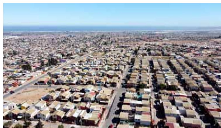
El sector de Las Compañías en La Serena aglutina a cerca del 50% de la población comunal y una de sus grandes aspiraciones es transformarse en comuna.