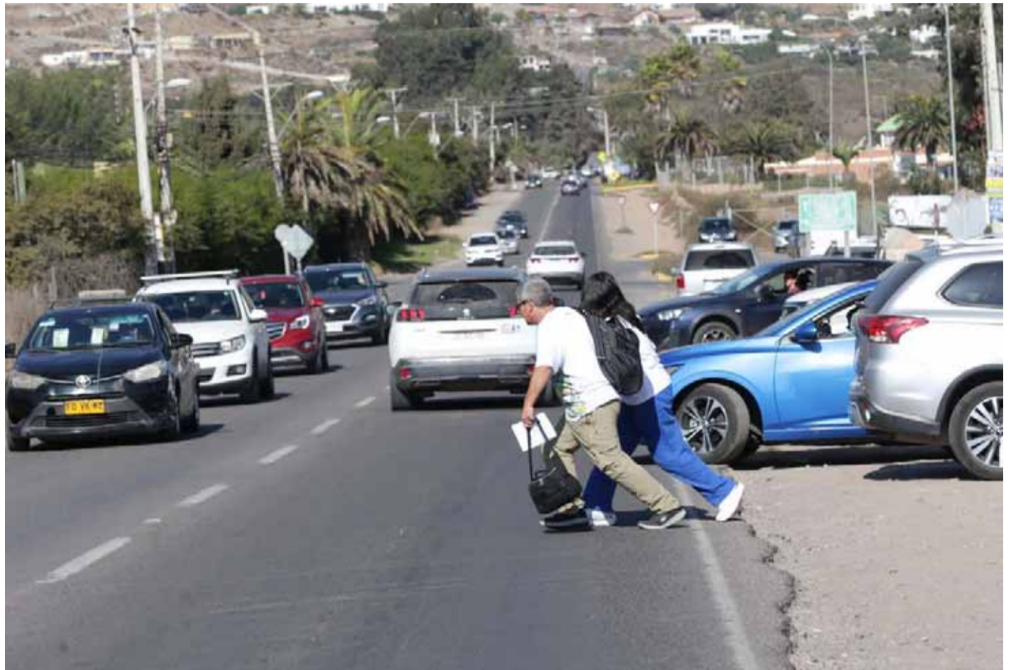
Los apoderados de los colegios del sector de San Ramón no están conformes y piden soluciones concretas a corto plazo.

“Pese a que valoramos la disposición de las autoridades, reconocemos nuestra preocupación ante la carencia de disposiciones concretas. Escuchamos las posturas de cada uno de los asistentes, entre los que estaban presentes representantes de la Secretaría Regional Ministerial de