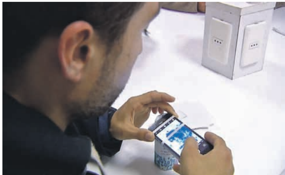
Un adaptador de bajo costo llamado Micro-Hoek, único en el mundo para dispositivos móviles construido a base de basura electrónica y doméstica para capturar imágenes microscópicas.