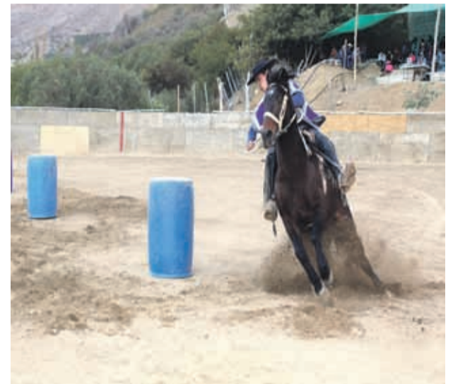
Se organizaron distintas actividades y competencias de destreza entre los crianceros.

resaltando que es importante que vean la mirada del campo, pues Chile no son sólo las áreas urbanas