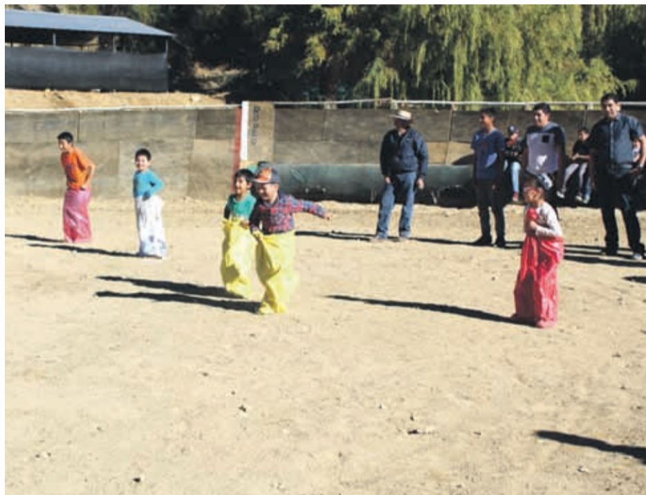
Los más pequeños participaron en distintos juegos populares.

Como una manera de mantener la tradición y reconocer la labor de los crianceros de la comuna montepatrina