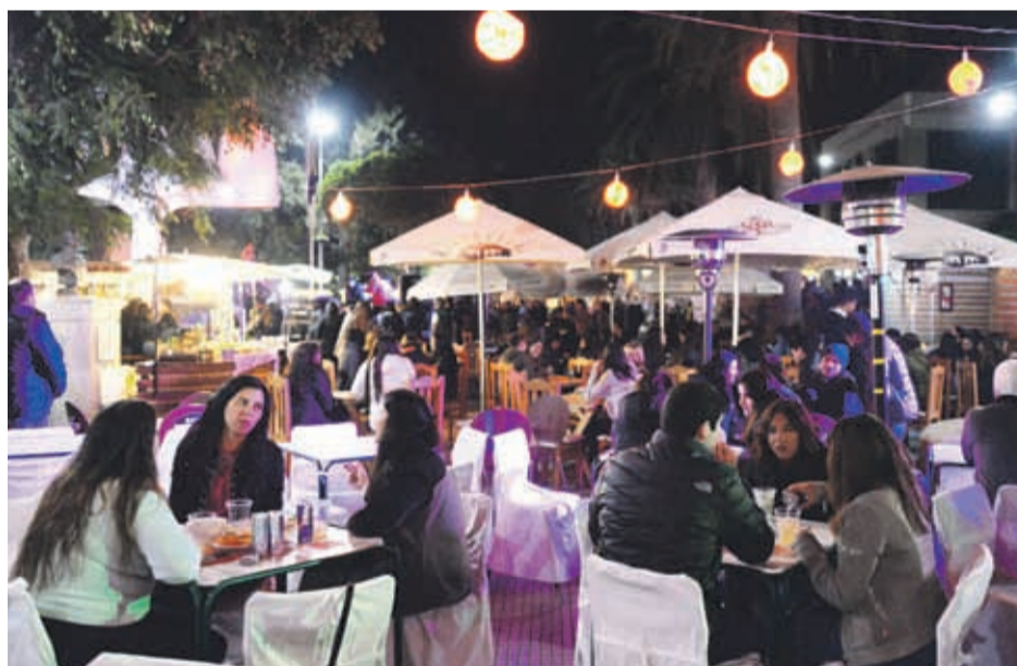
La Serena, Ovalle, Vicuña y Pailhuano son sólo algunas de las ciudades que celebrarán el Día del Pisco todo el fin de semana.

Vicuña, por su parte, dio a conocer este lunes las actividades preparadas para la conmemoración 2019, que incluye como hace un par de años, la Fiesta Denominación de Origen Pisco, a llevarse a cabo en la plaza Gabriela Mistral de Vicuña, este sábado 18 y domingo 19 de mayo. La celebración incluye concursos de bartendería y postres hechos a base de pisco, tertulias de leyendas e historias del destilado nacional, clases de preparaciones de cocteles,