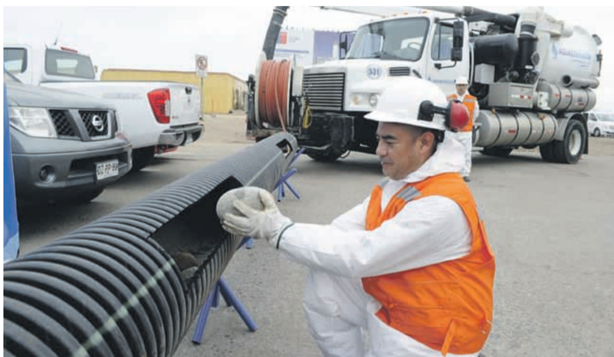
La empresa sanitaria Aguas del Valle mostró parte del equipamiento y capital humano con el que enfrentarán las eventuales emergencias de invierno.