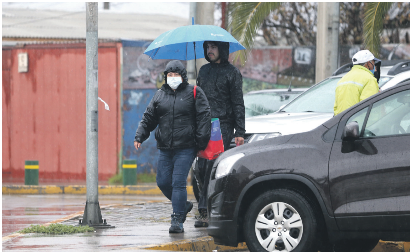
La Onemi regional llamó a prepararse ante el sistema frontal, que traerá precipitaciones en toda la Región de Coquimbo.