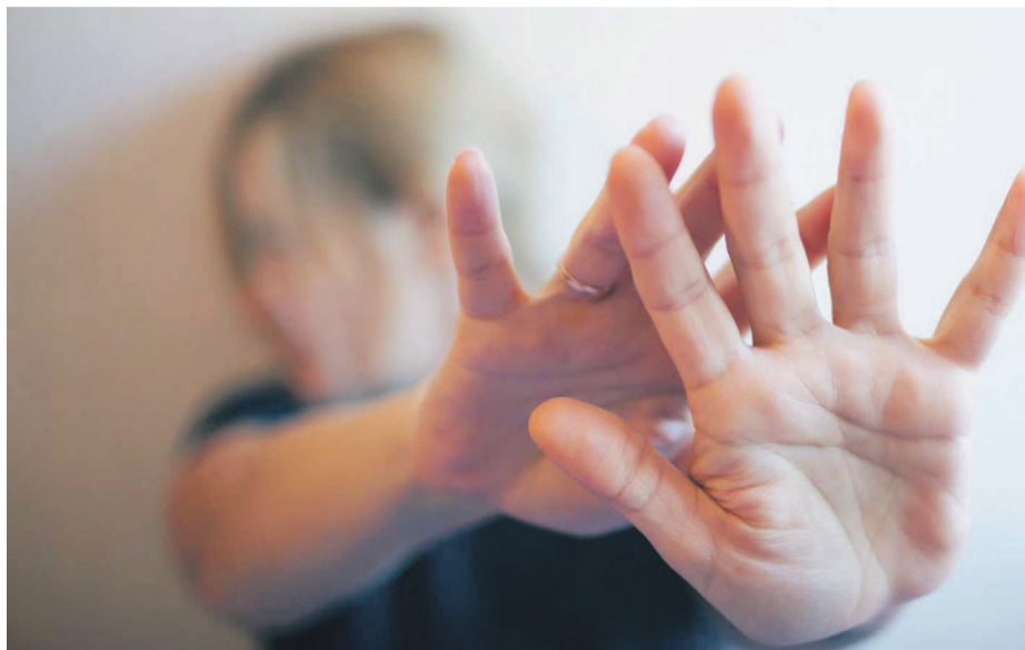
Mascarilla 19 ya fue utilizada en la región de Coquimbo. Fue en Ovalle donde una mujer de 35 años acudió a la farmacia producto de una historia de maltrato con su esposo.

Lo anterior cobra especial relevancia, en momentos en que la violencia contra la mujer ha aumentado durante esta crisis, producto de los confinamientos decretados para las personas. Las cifras son reveladoras, el Fono de Orientación en Violencia 1455, del Ministerio de la Mujer y Equidad de Género, ha tenido un 45% más de llamadas el último mes, mientras que el Fono 149 de Carabineros