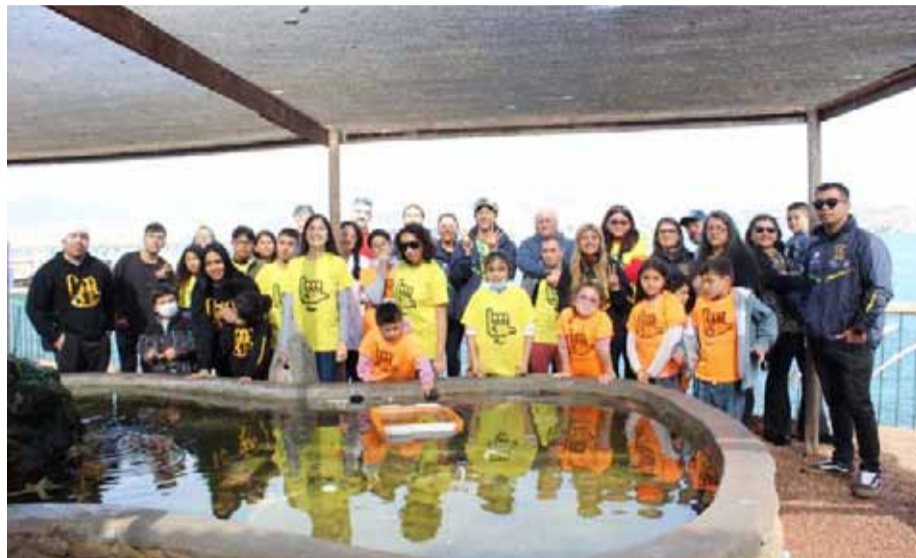
CLUB ADAPTA SURF

El encuentro, que organizaron los niños y niñas de la agrupación, encontró una alta respuesta en los profesionales de esa casa de estudios, quienes ofrecieron un tour por las diferentes áreas.