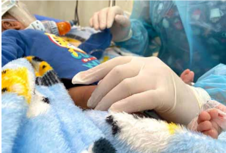
LAUTARO CARMONA/FOTO REFERENCIAL

Según las primeras informaciones, una menor de 2 años y 7 meses fue ingresada al SAR de la comuna, afectada por fuertes afecciones respiratorias, lugar en el cual, el personal médico no logró estabilizarla, falleciendo en el recinto.