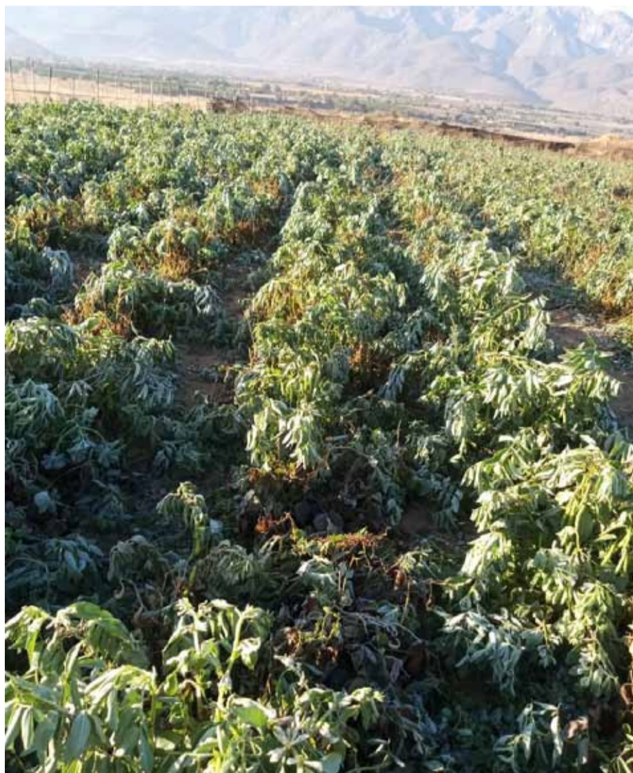
Se han perdido producciones enteras de hortalizas producto de las heladas en Monte Patria.

Pequeños productores de la zona lamentaron la pérdida total que sufrieron algunas de sus cosechas producto de este fenómeno climático, por lo cual, solicitaron ayudas para tratar de mitigar esta compleja situación. La seremi de Agricultura en tanto, se encuentra recopilando la información precisa de los daños y afectados.