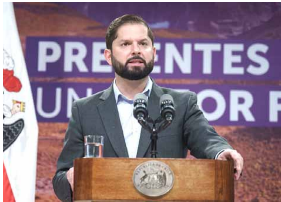
El Presidente Gabriel Boric advirtió que las próximas dos semanas “serán complejas”.