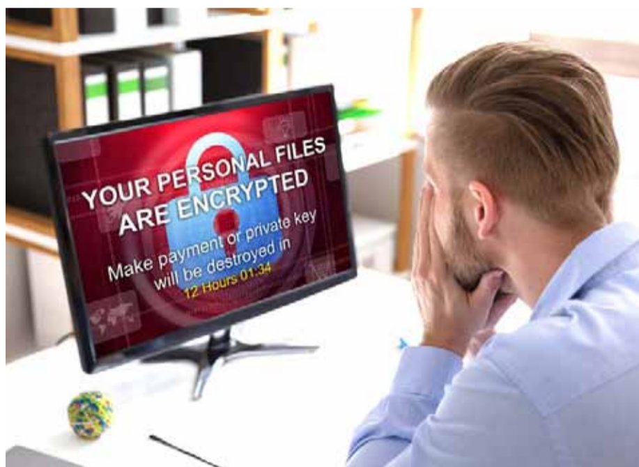
El ataque de un "ransomware" es una seria amenaza para una empresa.

Los ciberataques que impiden a entidades, empresas o usuarios acceder a sus propios sistemas o archivos exigiéndoles el pago de un rescate económico a cambio de devolverles el acceso bloqueado, son cada vez más insidiosos, añadiendo nuevas tácticas para multiplicar sus víctimas.