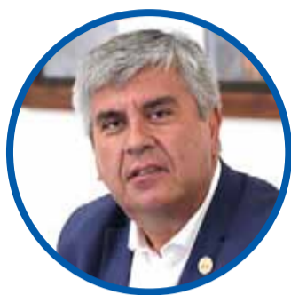
Rafael Vera ALCALDE DE VICUÑA