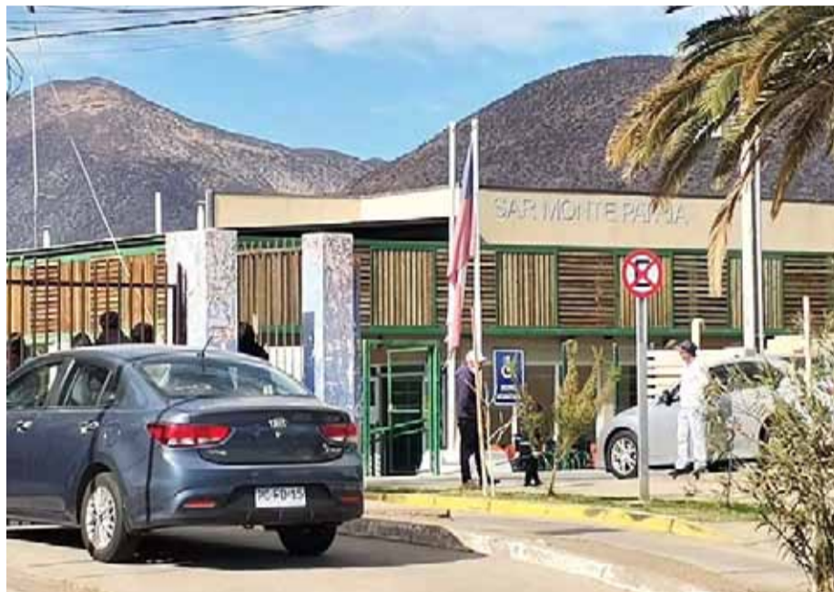
Fue el pasado 13 de junio cuando la menor perdió la vida en el SAR de Monte Patria.

Una de las motivaciones para extender la investigación se fundamenta en que la información enviada por el Servicio de Salud Coquimbo no habría sido suficiente para que el comité de expertos pueda sacar sus respectivas conclusiones. Por tal motivo, la autoridad sanitaria busca incluir nuevos antecedentes.