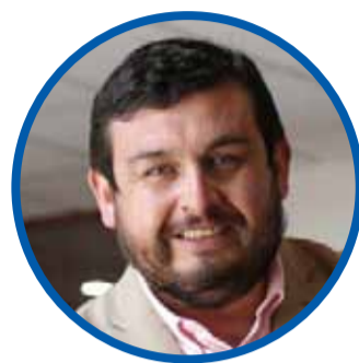
Yerko Galleguillos ALCALDE DE LA HIGUERA