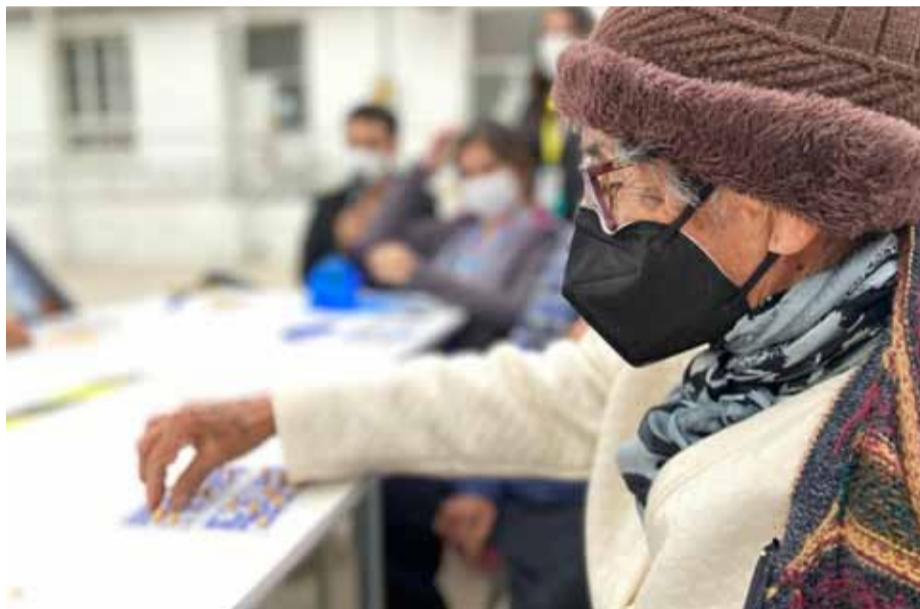
Los adultos mayores son parte de los grupos más vulnerables ante la posibilidad de contagio por influenza.

De acuerdo con el último reporte epidemiológico de la seremi de Salud, se detectaron más casos en mayores de 65 y en niños entre 1 a 4 años de edad. Además, se ha observado la hospitalización de menores de 14 años.