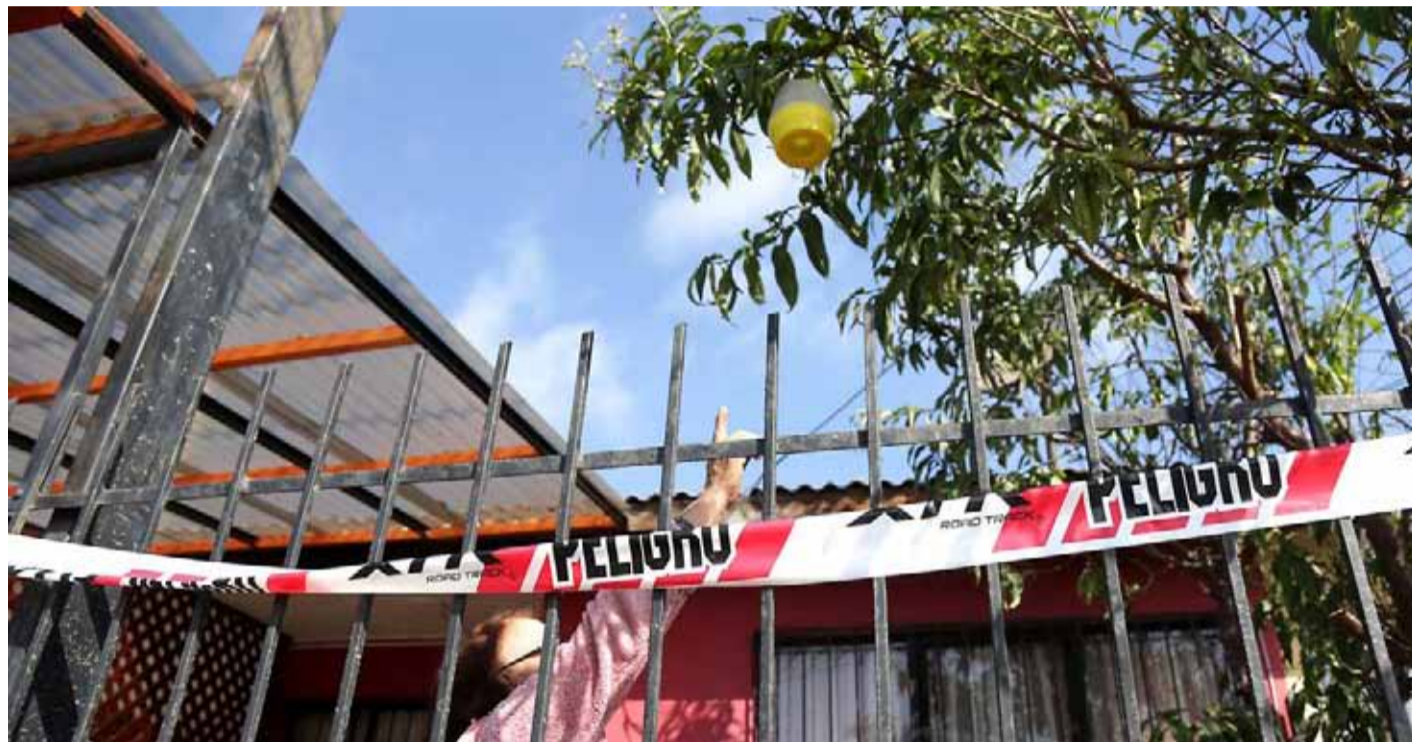
La mosca de la fruta es considerada como una de las plagas más dañinas para la producción agrícola.

“Se capturaron a 400 metros del primer brote en El Agrado. Otras hacia el norte (...). De allí que le pedimos a la población que nos deje entrar a sus casas para revisar los árboles frutales,