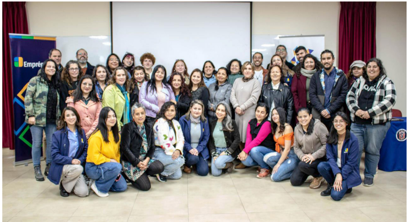
Cada una de las y los participantes del programa recibieron sus respectivos diplomas, con los que se reconoció su compromiso y logros.

Y es que Emprépolis ha jugado un papel crucial en el desarrollo de estas iniciativas emprendedoras, ofreciendo