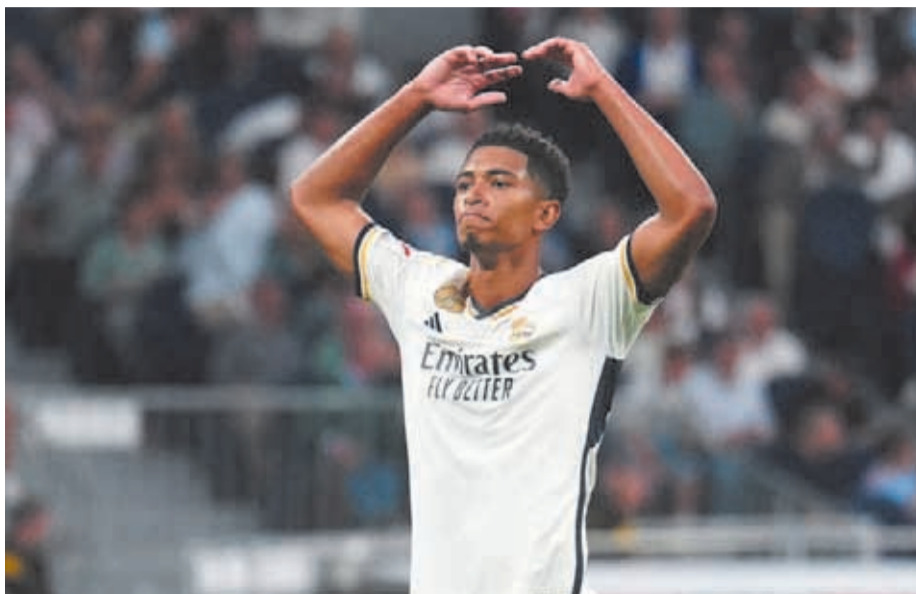
El centrocampista del Real Madrid Jude Bellingham ha llegado con fuerza y acierto al fútbol español, ocupando el sitio dejado por Karim Benzema.

En el curso de 2023, las grandes ligas europeas han perdido a estrellas como Cristiano Ronaldo, Messi, Benzema, Neymar, Busquets. Un vacío que en el arranque de la nueva temporada está siendo ocupado por prometedores valores con Bellingham, Yamal, Boniface y con el beneplácito de Haaland y Mbappé como abanderados.