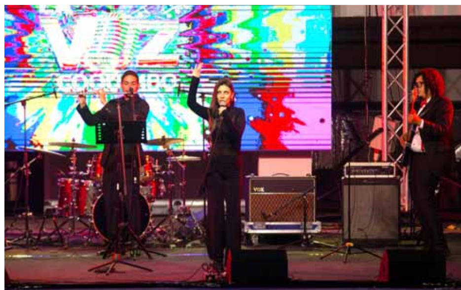
“Los Copa Rota” fueron uno de los grandes ganadores del concurso “La Voz Coquimbo”.