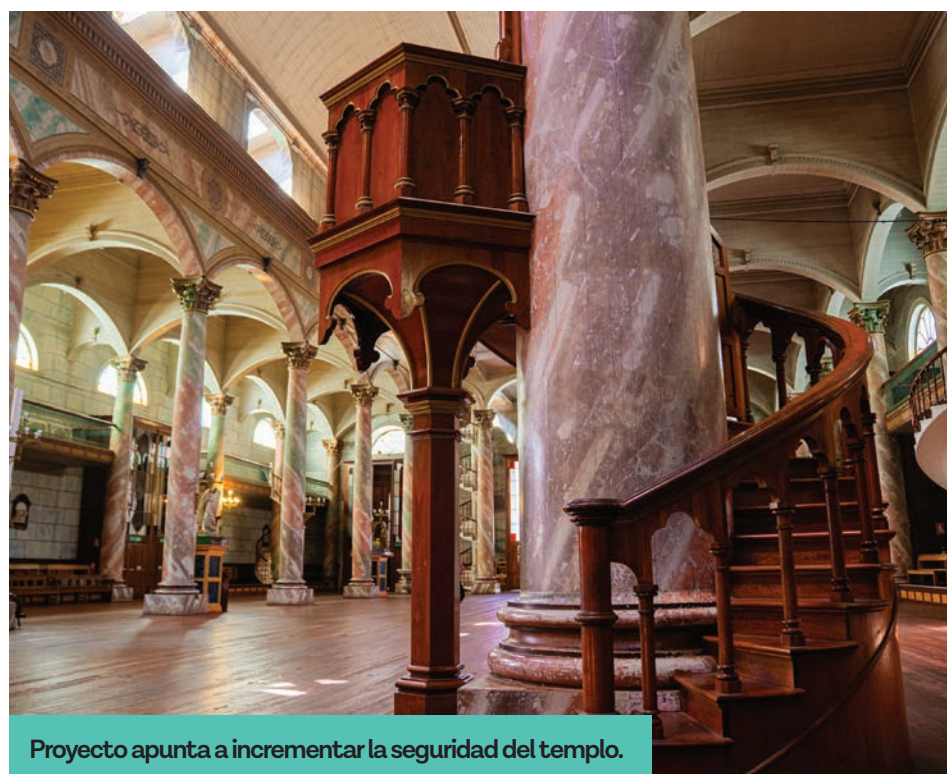
Proyecto apunta a incrementar la seguridad del templo.