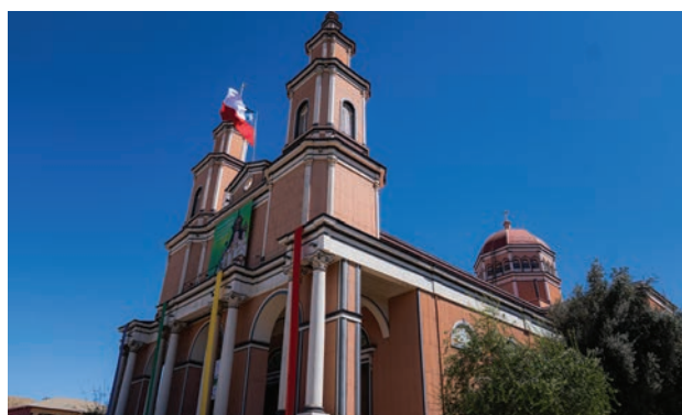
Iniciativa busca mejorar la infraes- tructura y seguridad del templo.