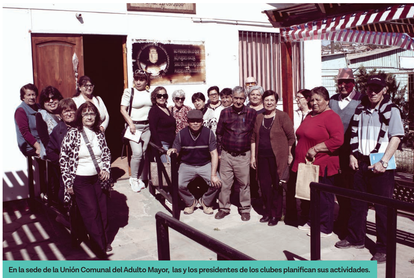
En la sede de la Unión Comunal del Adulto Mayor, las y los presidentes de los clubes planifican sus actividades.