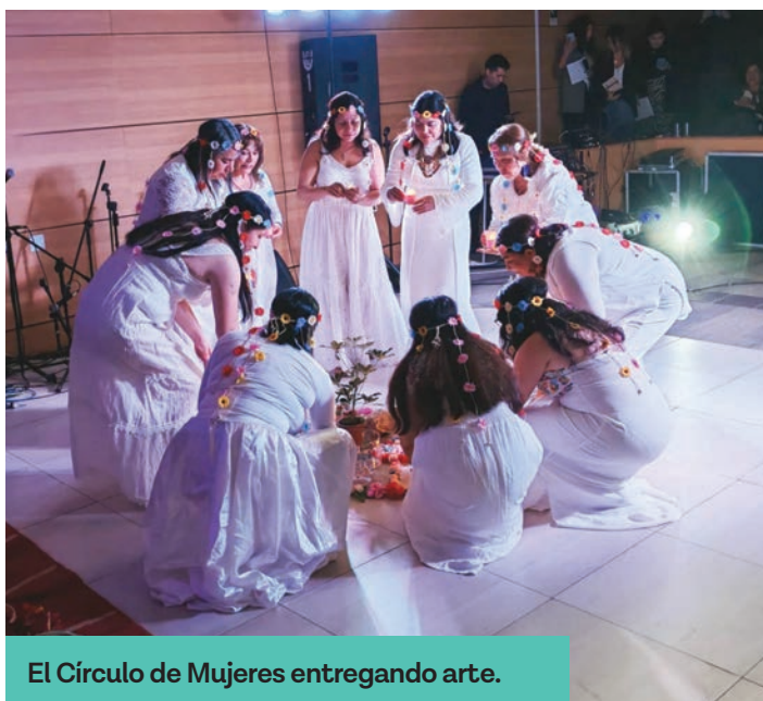
El Círculo de Mujeres entregando arte.