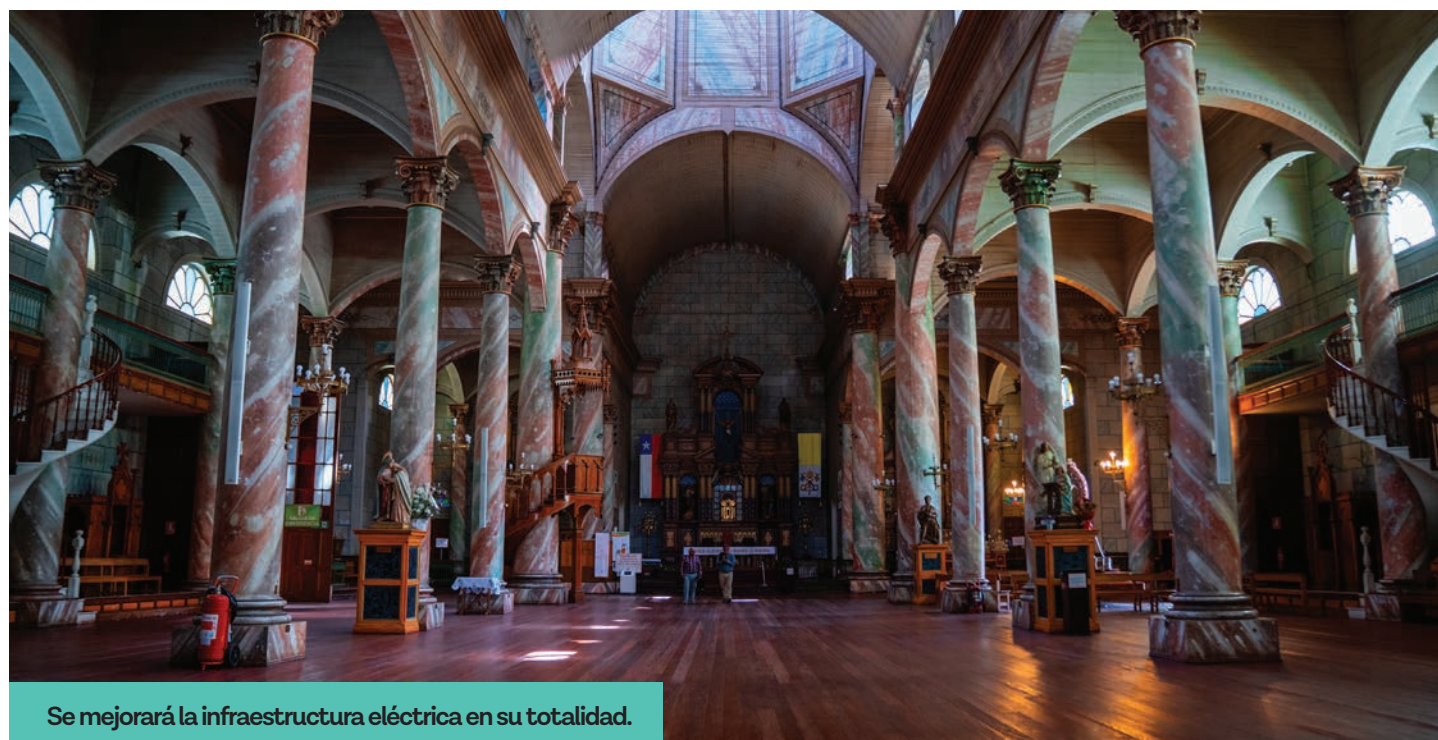
Se mejorará la infraestructura eléctrica en su totalidad.

Este proyecto se hace posible tras un trabajo previo liderado por la Mesa Comunidad Andacollina Teck (CAT), que financió con 28 millones de pesos el diseño eléctrico e iluminación, lo que permitió elaborar los planos técnicos y obtener la aprobación del Consejo de Monumentos Nacionales. Esa primera etapa resultó clave para viabilizar la inversión mayor que hoy concreta el Gobierno Regional.