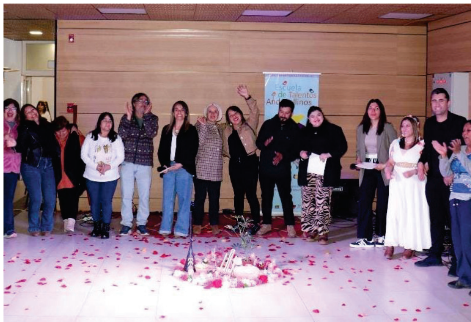
Todo fue celebración para los integrantes de la Escuela de Talentos Andacollinos.