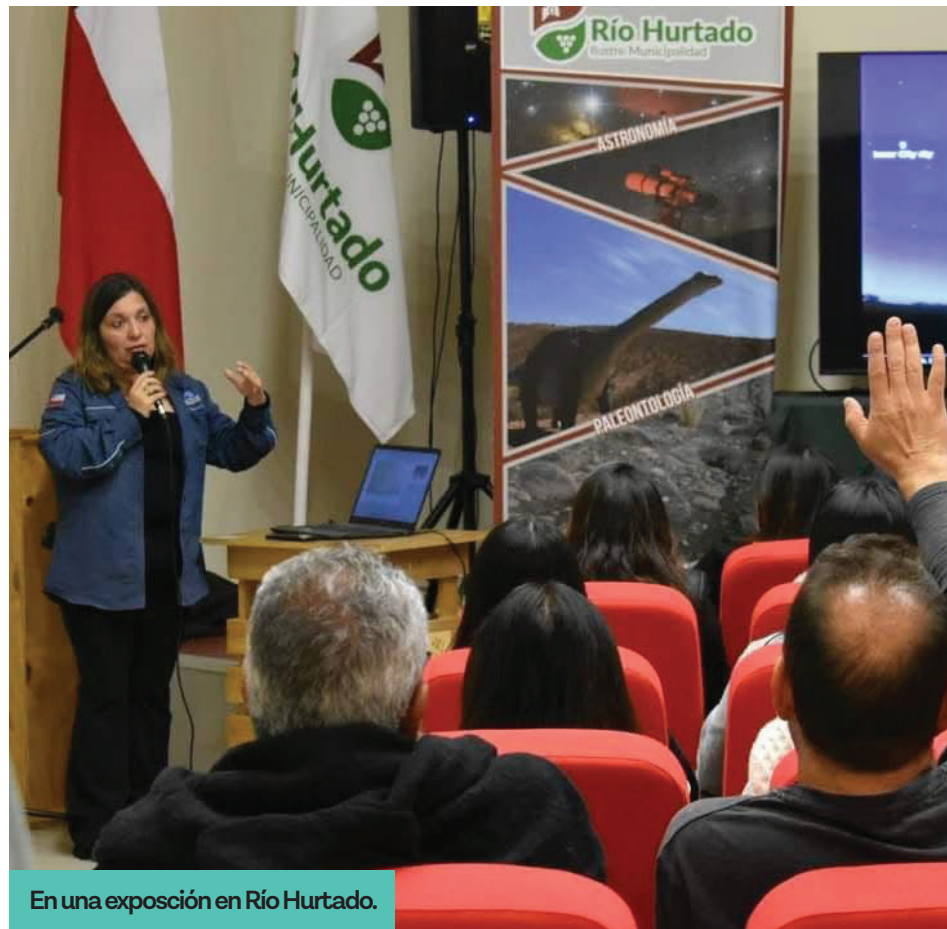
En una exposición en Río Hurtado.