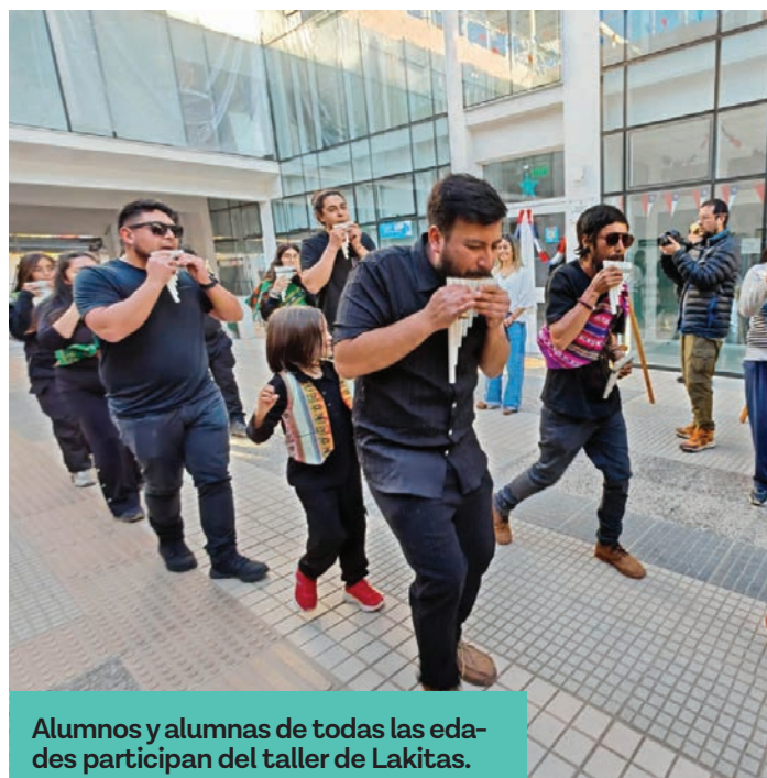
Alumnos y alumnas de todas las edades participan del taller de Lakitas.