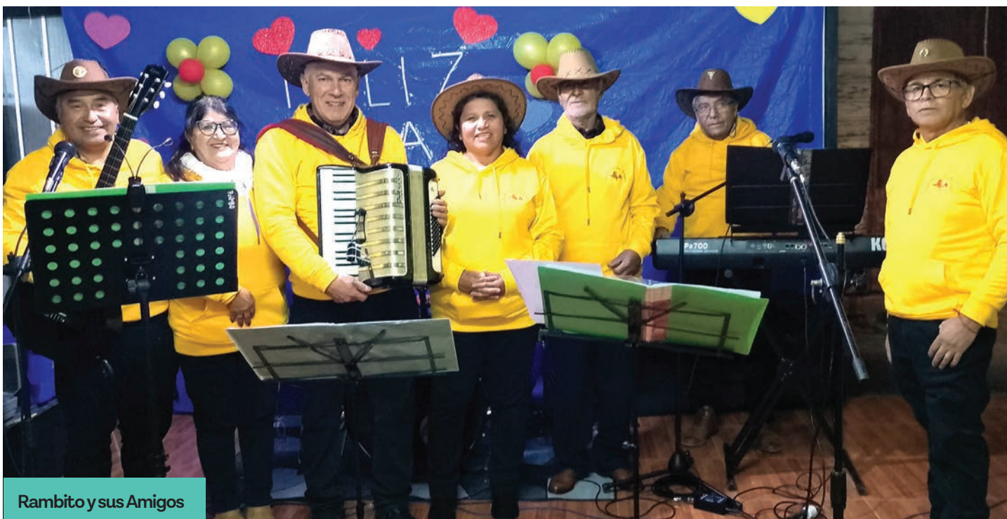
Rambito y sus Amigos

Se han presentado en el Día de la Mujer, en el Festival del Salitre, en el Festival de El Curque, además de celebrar su aniversario en la Plaza Gabriela Mistral, frente al Estadio Willy González.