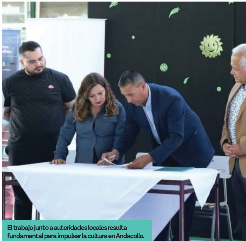
El trabajo junto a autoridades locales resulta fundamental para impulsar la cultura en Andacollo.