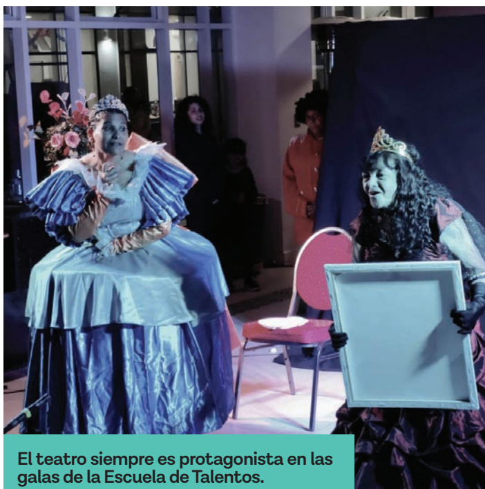
El teatro siempre es protagonista en las galas de la Escuela de Talentos.