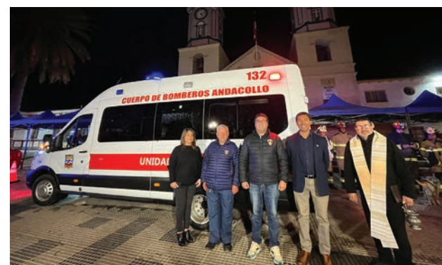
Es una unidad de transportes para los voluntarios.