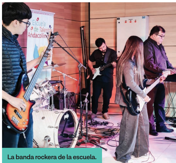
La banda rockera de la escuela.