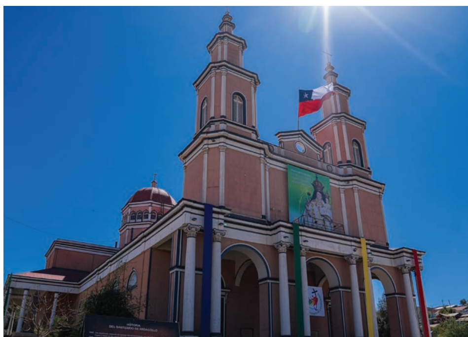
El nuevo diseño eléctrico fue aprobado por el Consejo de Monumentos Nacionales, lo que asegura los más altos estándares en su implementación.