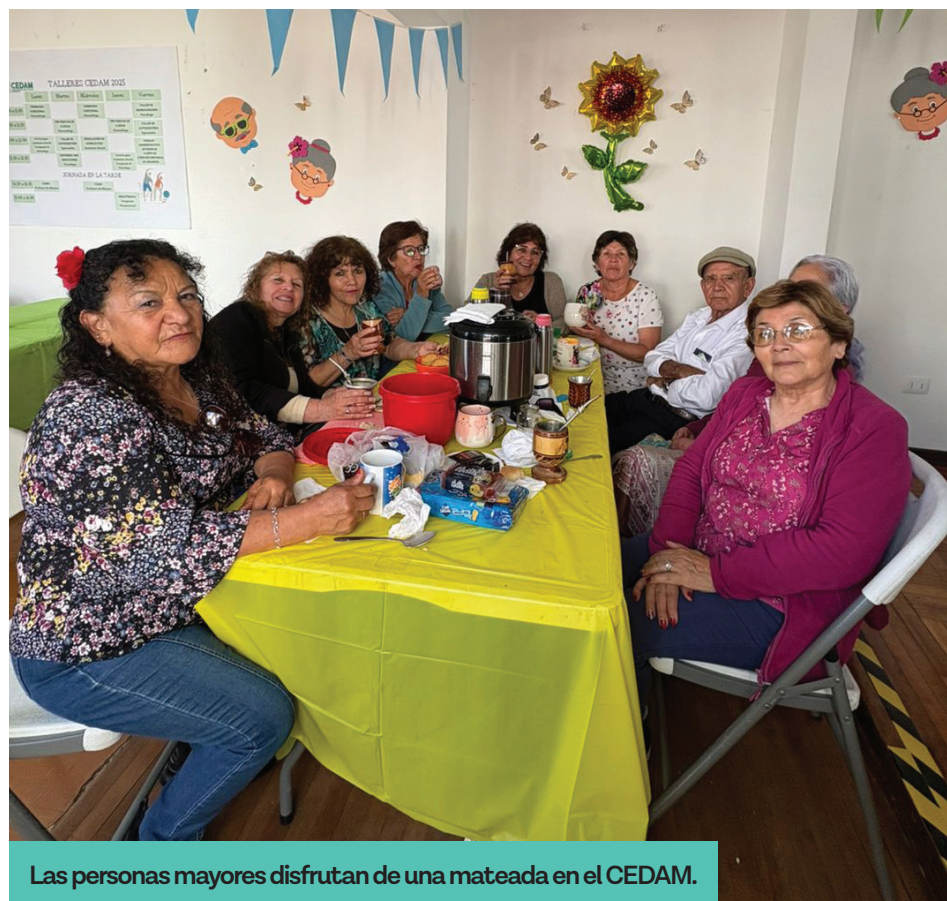
Las personas mayores disfrutan de una mateada en el CEDAM.

Los talleres abarcan aspectos como prevención de caídas, gimnasia funcional, estimulación cognitiva y autocuidado, ergoterapia, coros, encuentros comunitarios y hasta actividades de la vida diaria. También se realizan sesiones de atención individual. Para integrarse, las personas mayores deben pertenecer a hogares con calificación socioeconómica igual o inferior al 70 % en el Registro Social de Hogares, ade-