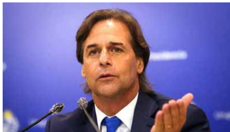
El gobierno del Presidente Luis Lacalle Pou pasa por el peor momento político de su administración.