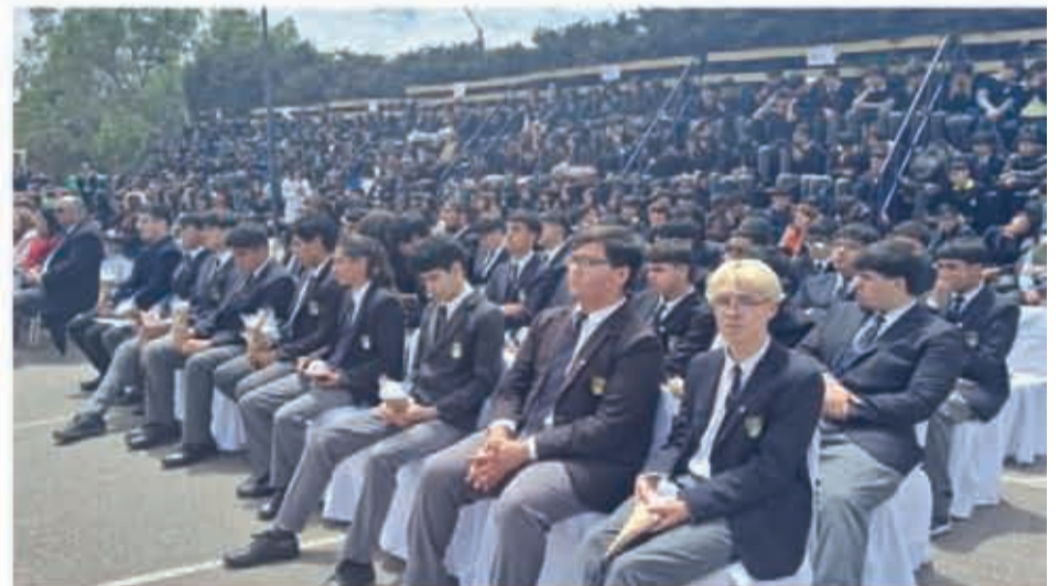
Colegio María Educa, sector La Florida ▲