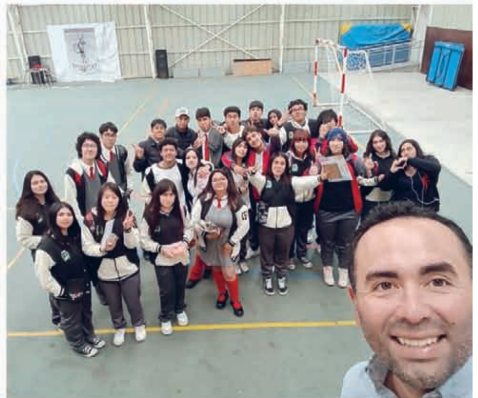
Colegio Cervantes sector La Florida ▲