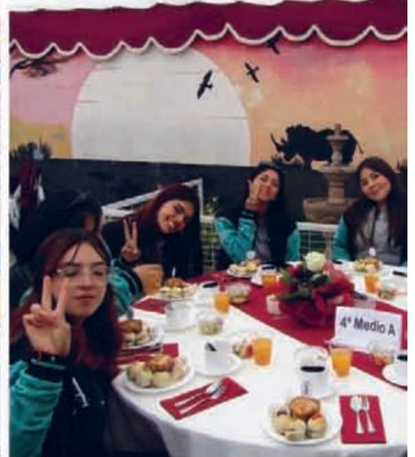
Colegio Gabriela Mistral de Coquimbo ▲