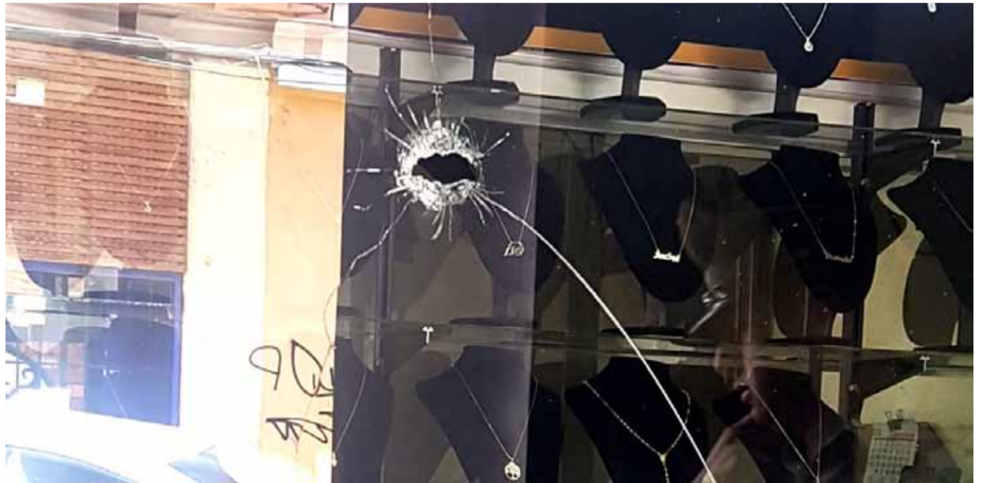
De acuerdo a la información de Carabineros, tras el forcejeo entre el dueño del local y los sujetos, uno de los antisociales disparó hacia una de las vitrinas de la joyería.

Es en ese momento que se inició un forcejeo entre el dueño de la joyería con uno de los asaltantes. A raíz de esta situación, uno de los antisociales percutió un disparo que terminó en una de las vitrinas del local.