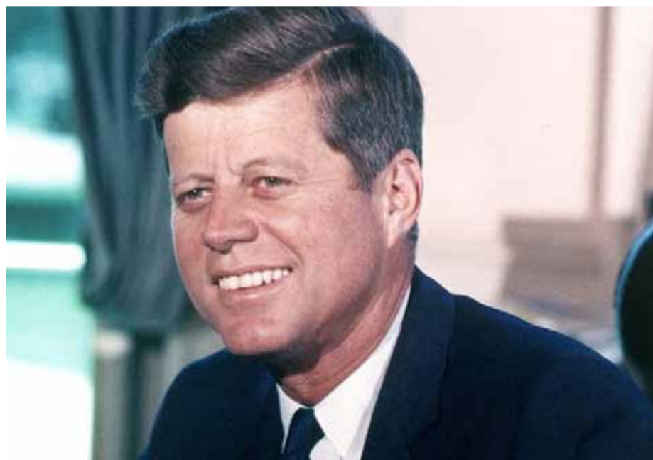
Imagen del 11 de julio de 1963, del emblemático presidente estadounidense John Fitzgerald Kennedy.

Se cumplen seis décadas de la muerte del mandatario estadounidense, uno de los líderes políticos más carismáticos que ha dado la historia de ese país.