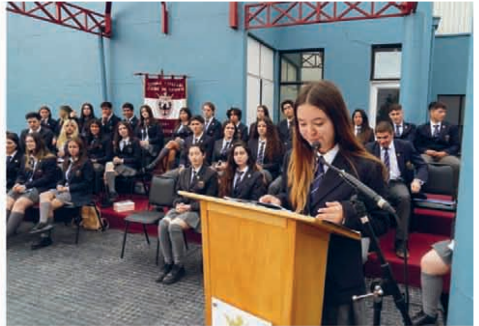
Scuola Italiana Alcide de Gasperi ▲