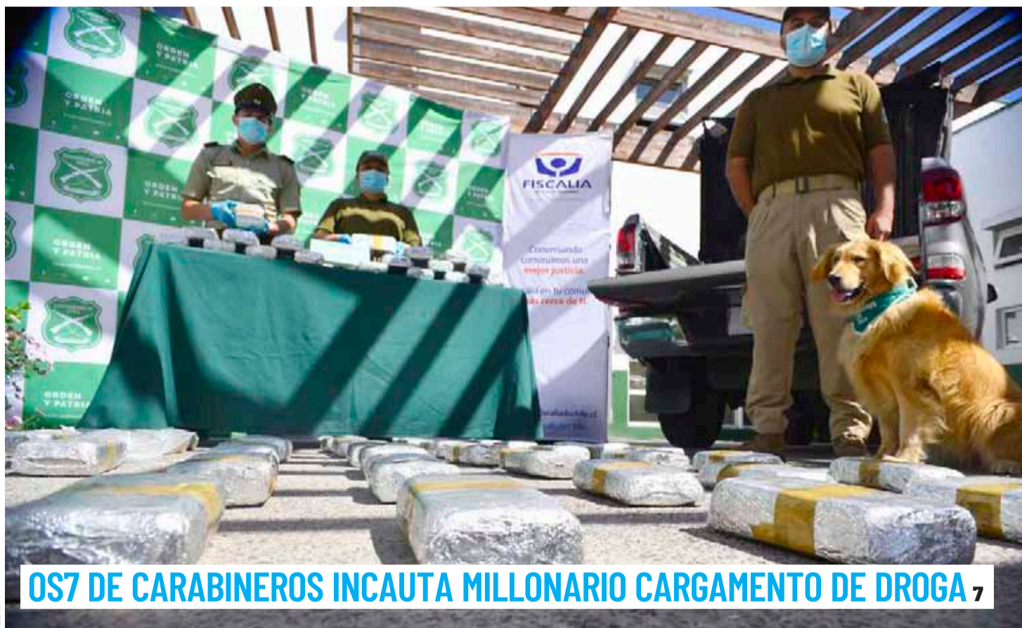
OS7 DE CARABINEROS INCAUTA MILLONARIO CARGAMENTO DE DROGA 7

CD LA SERENA DEFENDERÁ SU PASO A LAS SEMIFINALES 21