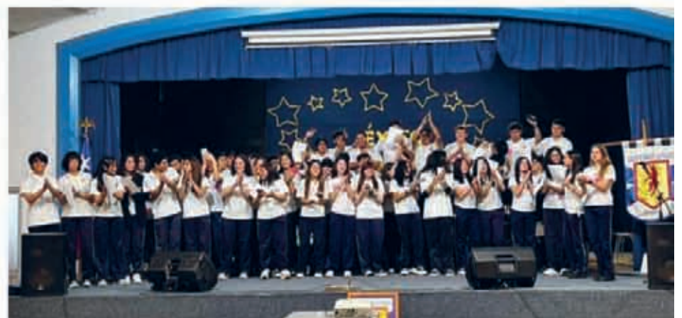
Colegio Inglés La Serena ▲