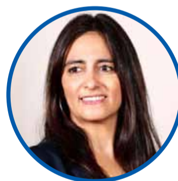
Claudia Sanhueza SUBSECRETARIA DE RELACIONES ECONÓMICAS INTERNACIONALES

“Vemos un gran número de posibilidades para que más mujeres de Coquimbo internacionalicen su oferta. Actualmente, en la región, emprenden en diversos rubros y de gran importancia económica como, por ejemplo, la industria de la uva o en el cultivo de cítricos. Igualmente, lideran en la producción de paltas, nueces, chirimoyas y aceite de oliva, entre otros productos”