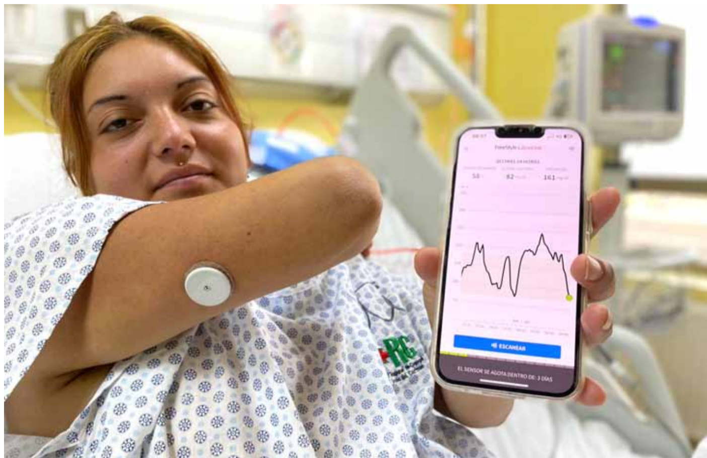
134 pacientes del Hospital de Coquimbo ya cuentan con el dispositivo que les permite controlar sus niveles de insulina.