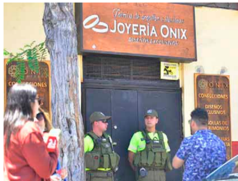
El asalto afectó a la Joyería Onix ubicada en pleno centro de La Serena. El hecho delictual causó terror en los transeúntes quienes, a esa hora, caminaban por calle Eduardo de la Barra. LEONEL FRITIS

Cabe precisar que en el operativo también se recuperó el arma de fuego utilizada para el robo al interior de la