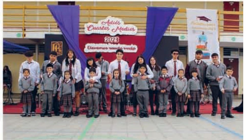
Colegio Gerónimo Rendic ▲