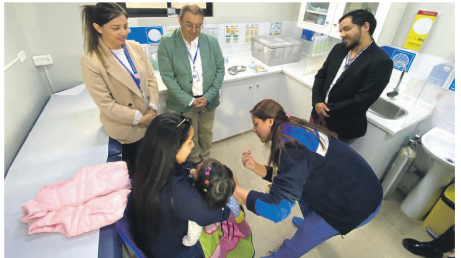
Todos los niños mayores de 18 meses podrán vacunarse.

Esta vacuna ayuda a prevenir enfermedades, hospitalizaciones e incluso muertes por el virus que causa la meningitis. Así lo explica, Felipe Díaz, referente del Servicio de Salud Coquimbo, quien señaló que "la meningitis es una enfermedad bacteriana que provoca la inflamación de la médula y del cerebro.