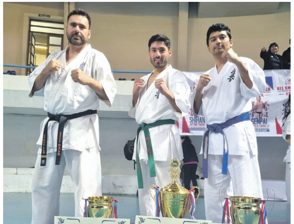
Los tres representantes del Matsushima Dojo Ovalle, quienes lograron importantes resultados en la cita internacional de Talcahuano.

Sin embargo, este sudamericano no es la última competencias de la tempo-