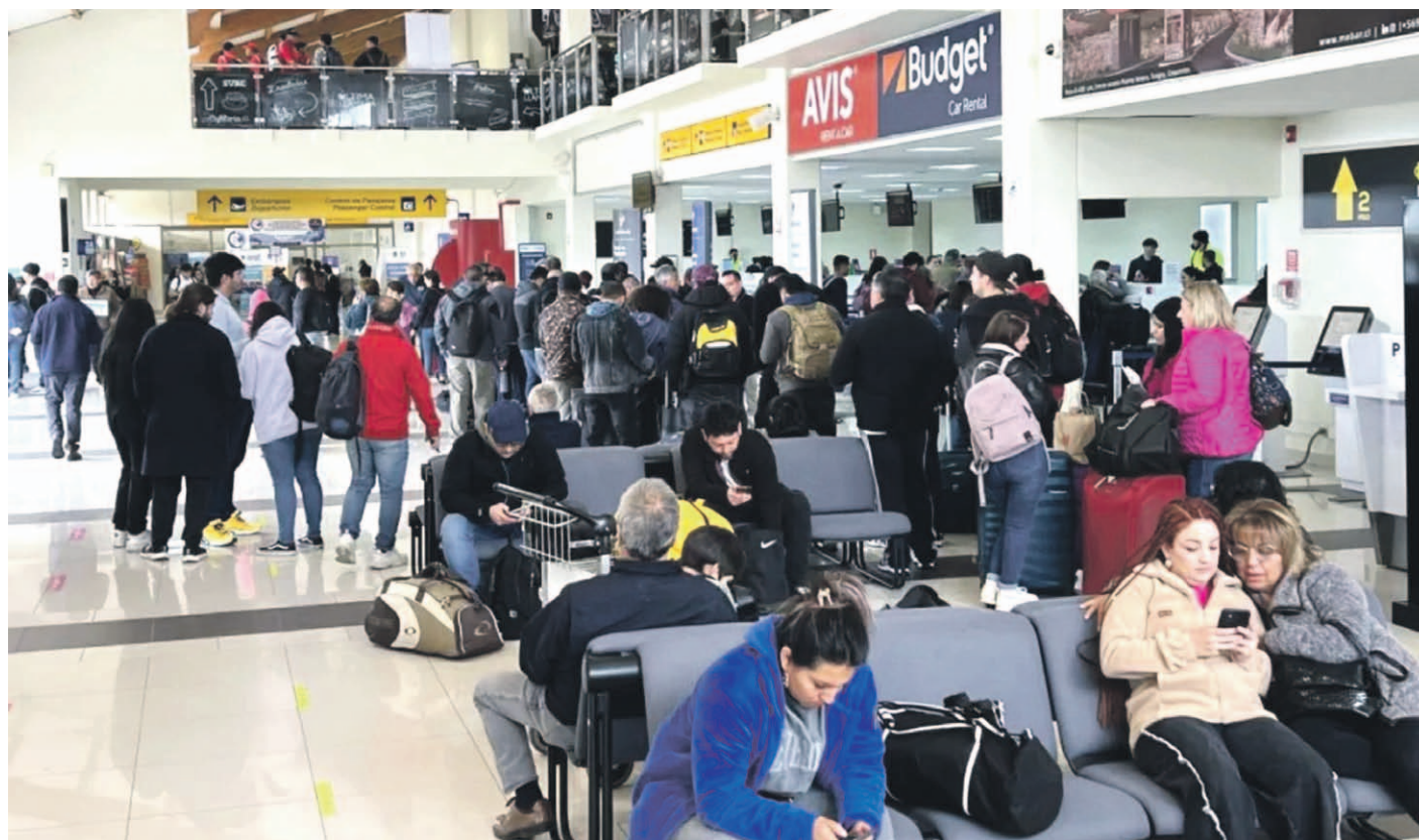
EL DÍA REFERENCIAL

De mucha paciencia debieron hacerse los pasajeros que este miércoles buscaban llegar a sus destinos por vía aérea desde La Serena, producto de la movilización de los funcionarios de la DGAC.