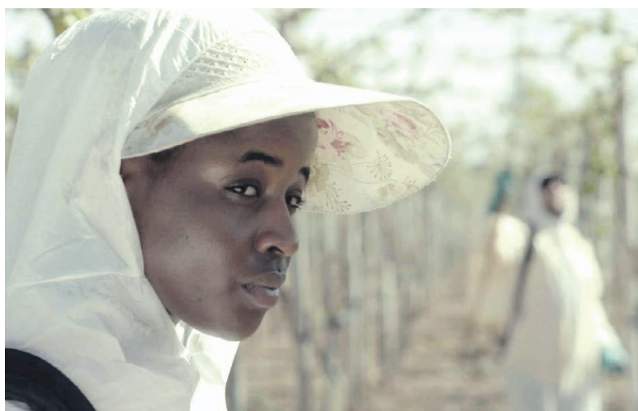
La película busca poner en el tapete la explotación y discriminación que viven los inmigrantes en el país.

La historia estrenada previamente en SANFIC20, también será parte del Festival Internacional de Cine de Viña del Mar FICVIÑA, el 29 Festival de Cine, Memoria y Derechos Humanos de Valparaíso, el Festival Internacional de Cine de Rengo y realizará su estreno local en el Festival de Cine de Ovalle.