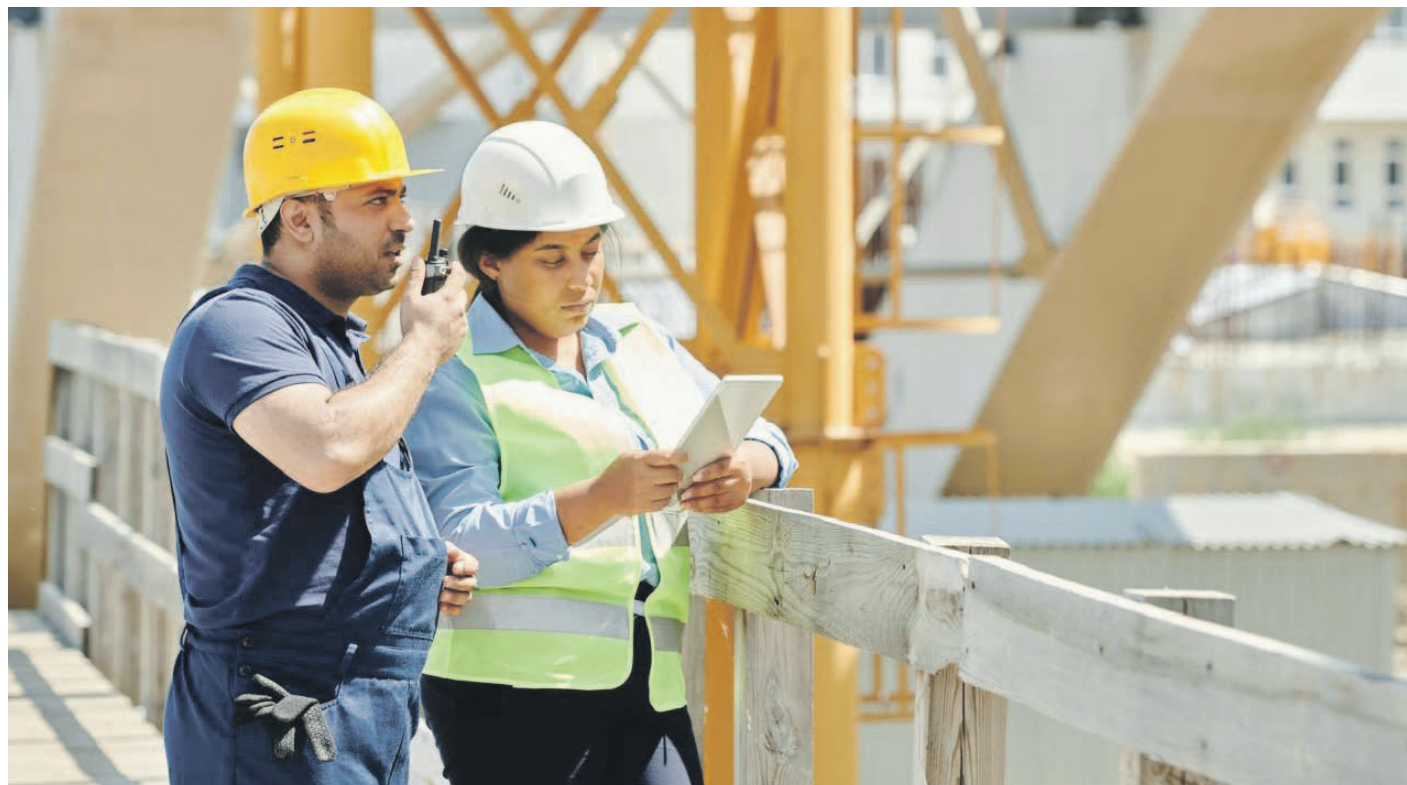
Más de 3 mil mujeres trabajan hoy en el sector de la construcción en la región.