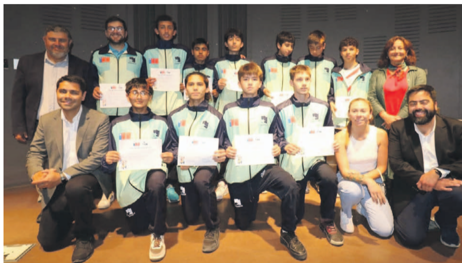
El IND distinguió a los deportistas más destacados de los Juegos Deportivos Escolares 2024.