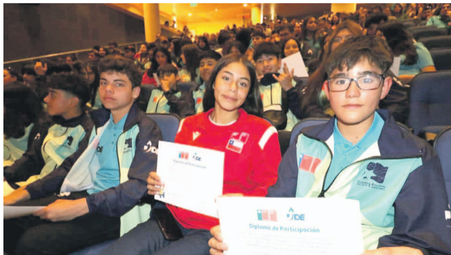
Durante el evento, también se entregaron diplomas a todos aquellos estudiantes que nos representaron en las finales nacionales realizadas en Santiago.