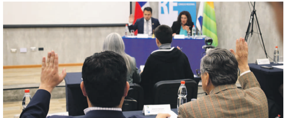
Los consejeros redactaron una declaración pública en que se solicita al Ministerio de Hacienda resolver este problema que afecta a las distintas regiones del país.

Por ello, según el representante del Choapa, "esto es una crisis insostenible y por lo mismo además, otros gobiernos regionales ya tienen incluso acusadas