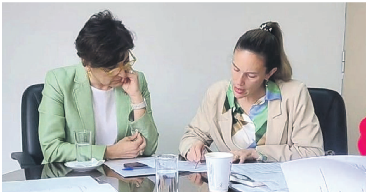
Una imagen del encuentro entre la ministra de Salud, Ximena Aguilera y la alcaldesa de La Serena, Daniela Norambuena, quien solicitó medidas por la crisis de la Corporación G.G.V.

En un intento por superar el complejo presente que enfrenta dicha entidad producto de su deuda millonaria, la alcaldesa de La Serena se reunió con la ministra de Salud para solicitar algunas medidas como el adelanto del per cápita y agilizar los convenios con CENABAST para renegociar deudas y garantizar el acceso a medicamentos en la salud primaria.