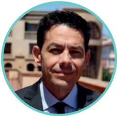
Cristóbal Juliá, Gobernador de la Región de Coquimbo

Sábado y domingo Mañana: 10:00 a 13:45 horas Tarde: 15:00 a 17:45 horas