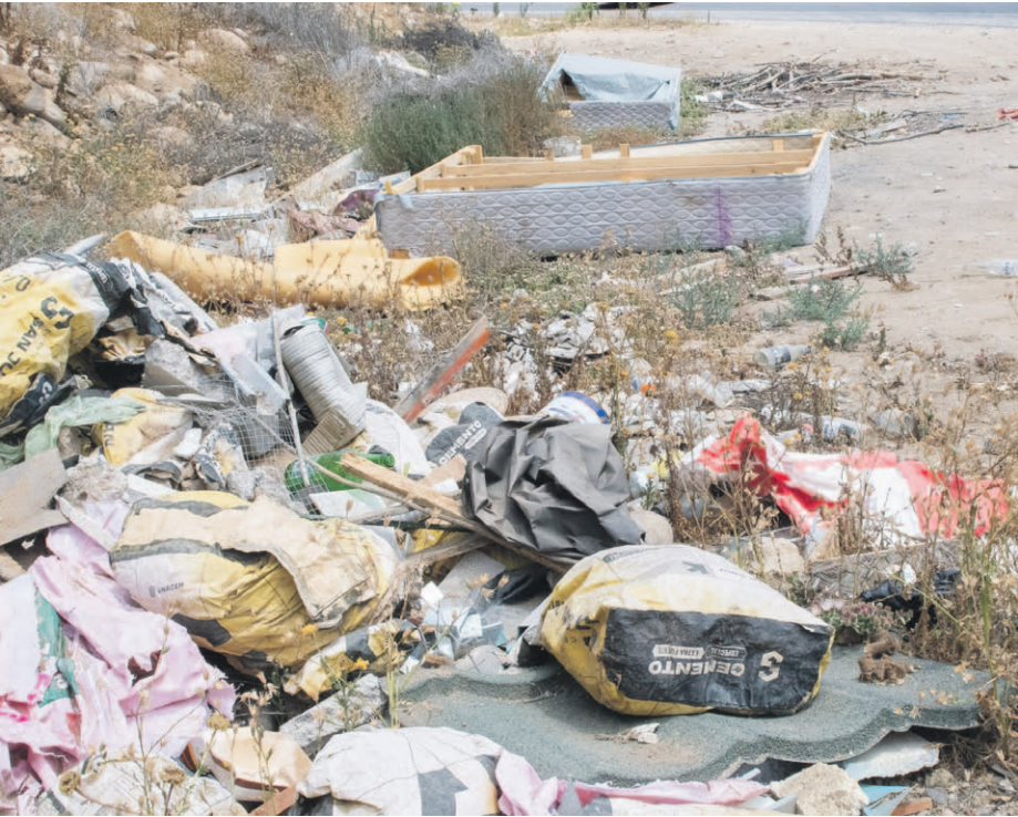
Así luce actualmente el sector de la bajada de la quebrada de Monardez. CRISTIAN SILVA

una intervención con plantaciones y ornamentación, que se ha mantenido en el tiempo, y hemos seguido en el sector de Ceres y La Florida”. En cuanto a lo que sucede en la avenida Colo-Colo, la alcaldesa reconoció que “hay espacios privados que tienen rucos (...)”, y ya que la Contraloría nos