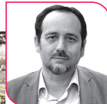
DANIEL NÚÑEZ Diputado PC, Región de Coquimbo.