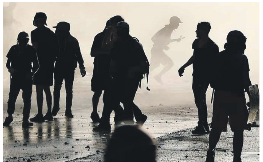
La iniciativa busca tipificar y penalizar actos como los saqueos, la instalación de barricadas y prácticas como "el que baila pasa" que impiden el libre tránsito. EFE

El actual proyecto, que en el Senado se redactó con modificaciones muy distintas a las que provenían de la Cámara, tipifica las penas para el delito de saqueo y las barricadas en las calles, además de prácticas como "el que baila pasa".