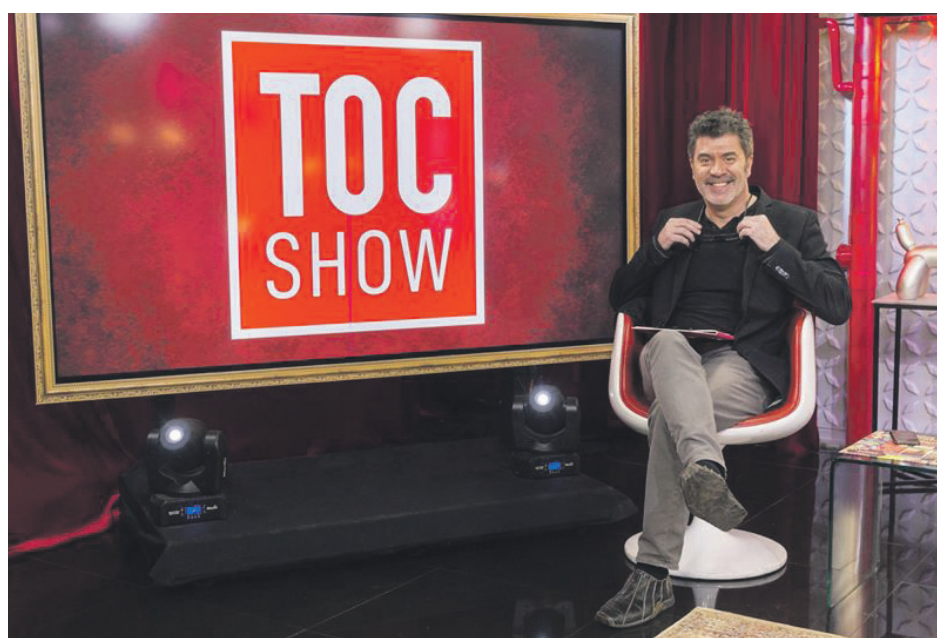
El programa de TV+ (Ex UCV) lleva casi tres años al aire.