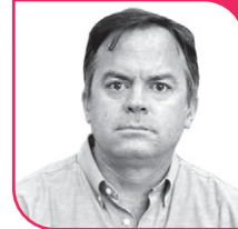
MATÍAS WALKER Diputado DC, Región de Coquimbo.