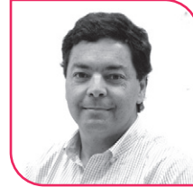
JUAN MANUEL FUENZALIDA Diputado UDI, Región de Coquimbo.