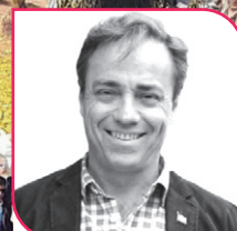
FRANCISCO EGUIGUREN Diputado RN, Región de Coquimbo.