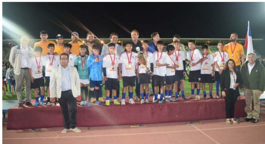
Academia AV Fútbol de Ovalle, campeón categoría 2012