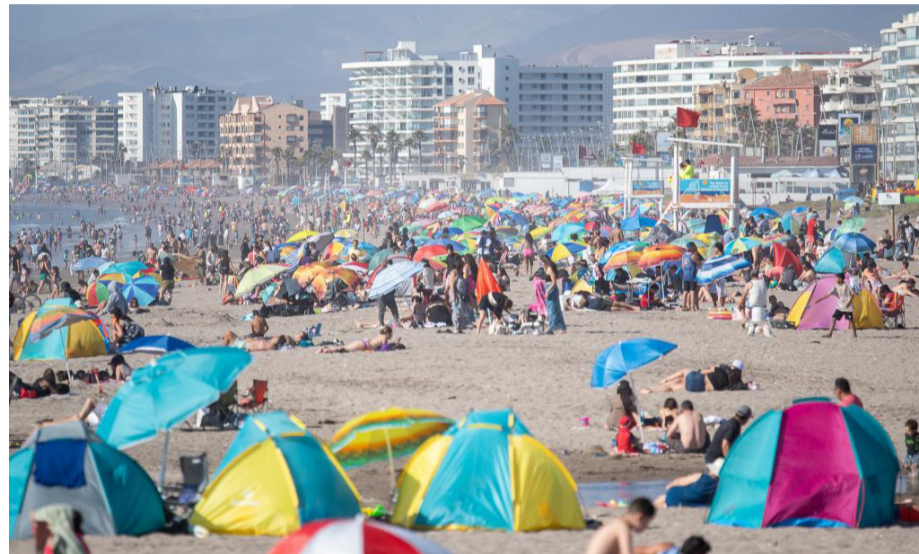
Eso sí, en el caso de La Serena y Coquimbo la máxima fue de 21 grados.

Una dorsal en altura y un componente de vientos del este elevaron la temperatura este domingo en valles y precordillera de la región, a diferencia de la costa, donde una baja térmica mantuvo la máxima en los 21°. El meteorólogo Iván Torres descarta una ola de calor, pronosticando temperaturas más bajas para este lunes.