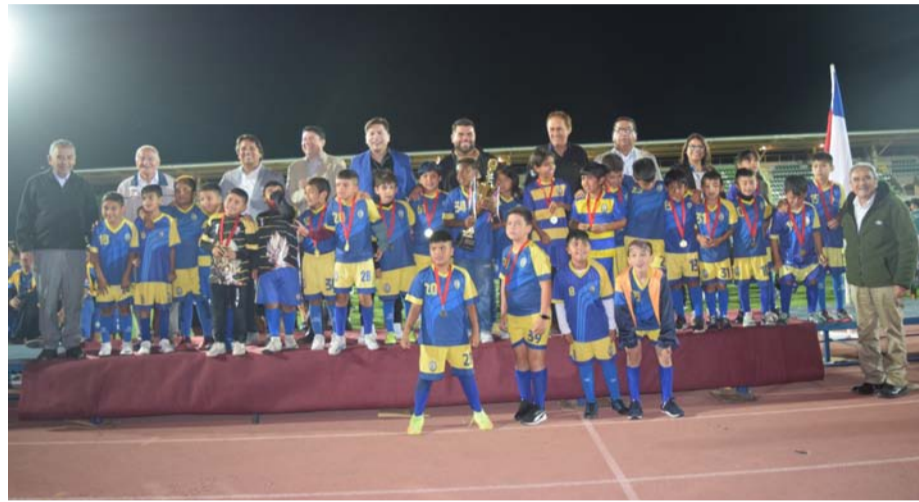
Academia de Fútbol Municipal Ovalle, campeón categoría 2015

En esta última jornada hubo participación de diversas autoridades