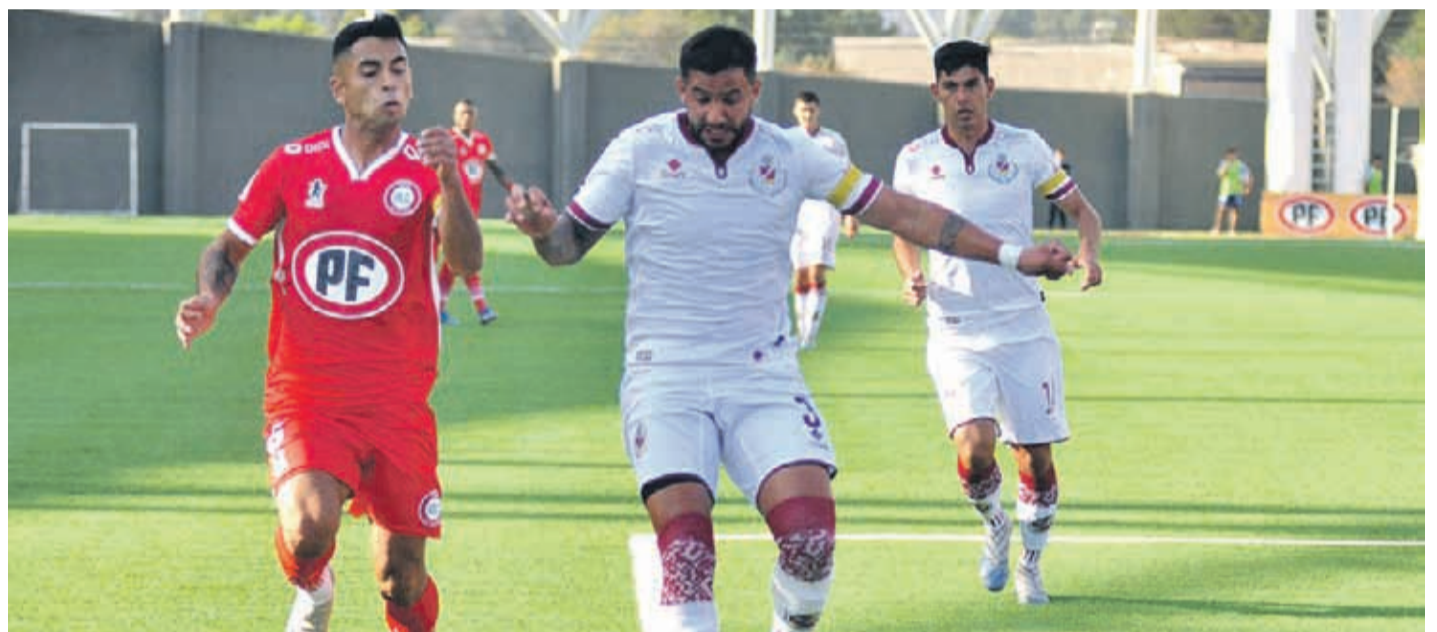
Deportes La Serena se mantiene con 0 partidos con 4 partidos jugados.