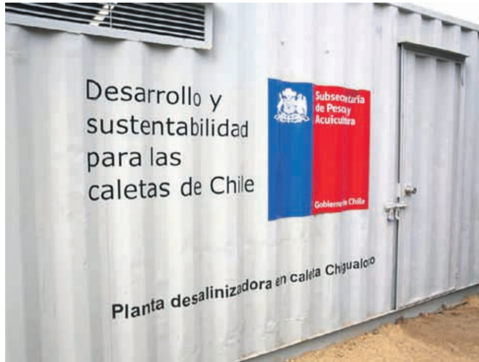
El recinto ubicado en Chigualoco.