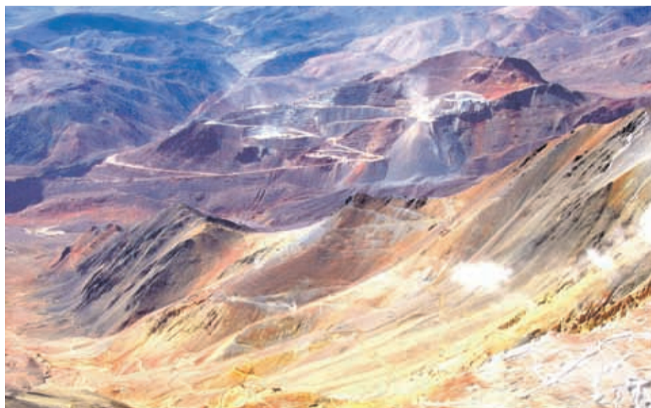
El yacimiento aspiraba a convertirse en la primera mina binacional del mundo.

"La intención de Barrick ahora es actualizar la información geológica del yacimiento, y este proceso se espera que tome algunos años. El foco para 2020 en Pascua Lama está