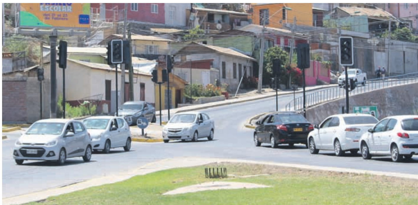
Los semáforos que aún siguen sin funcionar corresponden al enlace entre la avenida La Paz, Manuel Peñafiel y Ena Craig de Luksic. ROMINA NAVEA R.

Esta semana, desde Serviu señalaron que la reposición de estos semáforos comenzarán a partir del mes de