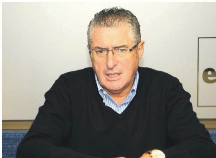
Senador Jorge Pizarro señaló que con sus declaraciones el ex intendente busca eludir su responsabilidad como máxima autoridad de la época en el error.

Tanto el senador Jorge Pizarro, como el diputado Matías Walker se refirieron a las palabras que el ex intendente regional entregó a diario El Día sobre el “llamado a que la gente no pague” que habrían realizado los parlamentarios en julio del 2016 cuando salió a la luz pública el error administrativo que terminó en un perjuicio fiscal de $84 millones que ahora se les cobra a cinco funcionarios y ex funcionarios del Gobierno Regional.