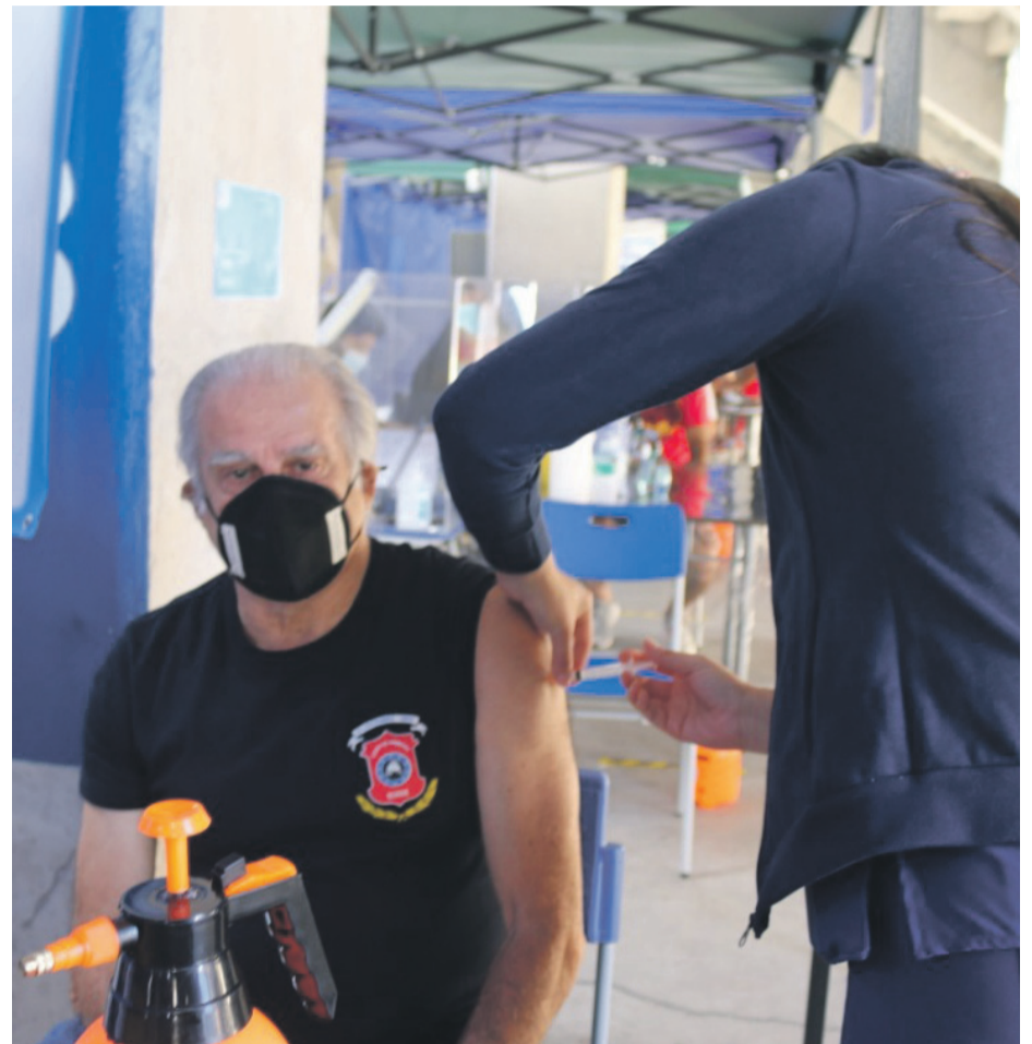
MUNICIPALIDAD DE IQUIQUE

Por lo anterior, se estima que la fecha podría ser el 22 de febrero, pero todo estaría supeditado a la información y dosis enviadas desde el nivel central a la región de Coquimbo.