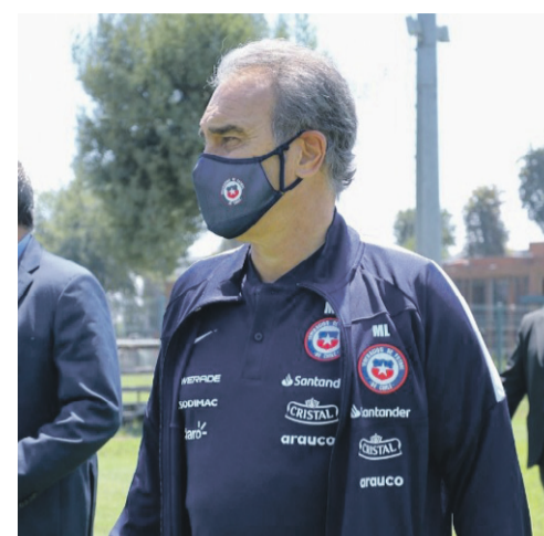
JORGE DÍAZ / ANFP