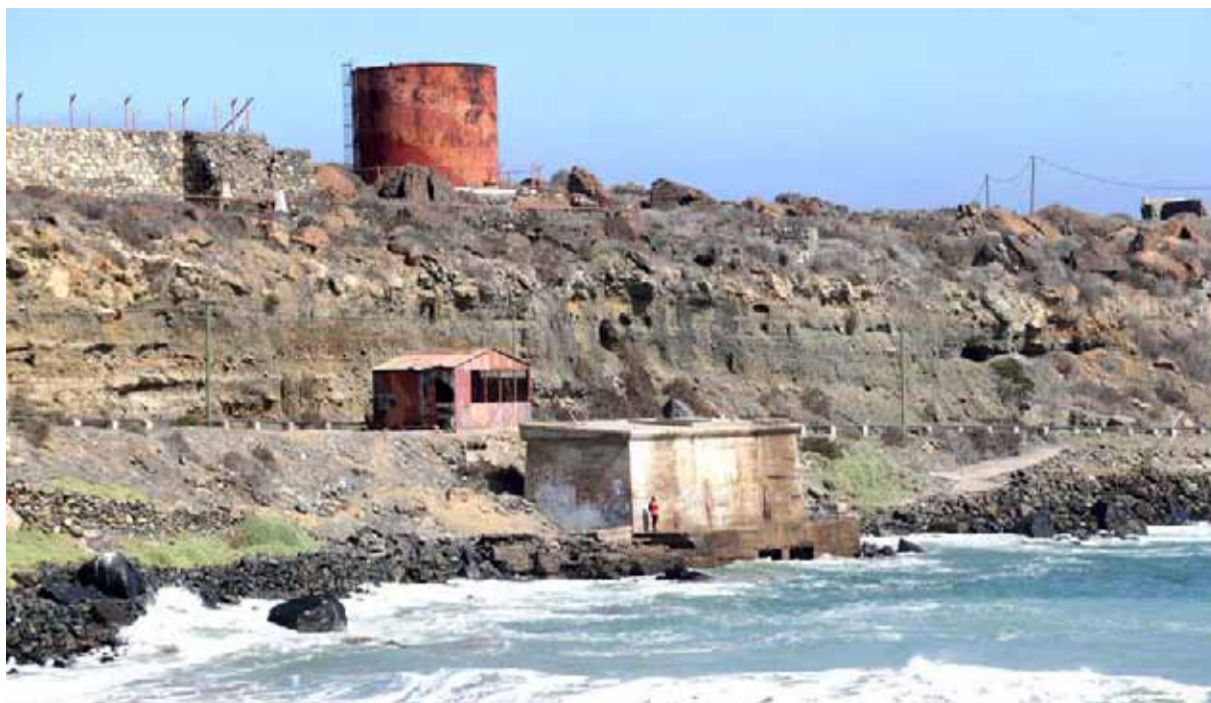
La infraestructura portuaria tiene como objetivo instalarse en la costa de la comuna de La Higuera.