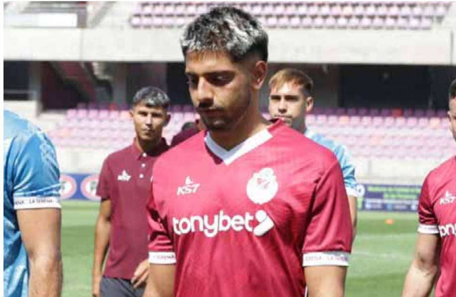
El futbolista trasandino vistió la camiseta granate en la derrota frente a Cobresal en el primer amistoso de la temporada.

Mediante un comunicado, los papayeros anunciaron a su hinchada que el mediocentro argentino de 23 años estará fuera luego de sufrir una rotura de ligamentos. Según precisaron fuentes del cuerpo médico, van a esperar un diagnóstico más detallado para iniciar el proceso de recuperación del futbolista.