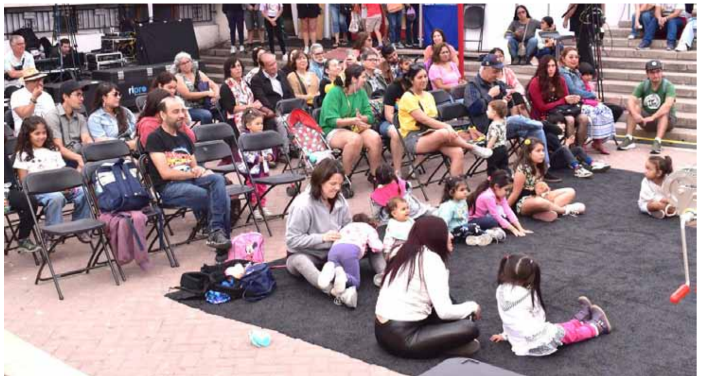
Familias enteras, y especialmente los niños, han sido los grandes protagonistas de la Feria del Libro de La Serena.

El Kamishibai también se ha ganado su espacio y tiene a la funcionaria de la Biblioteca Municipal Alonso