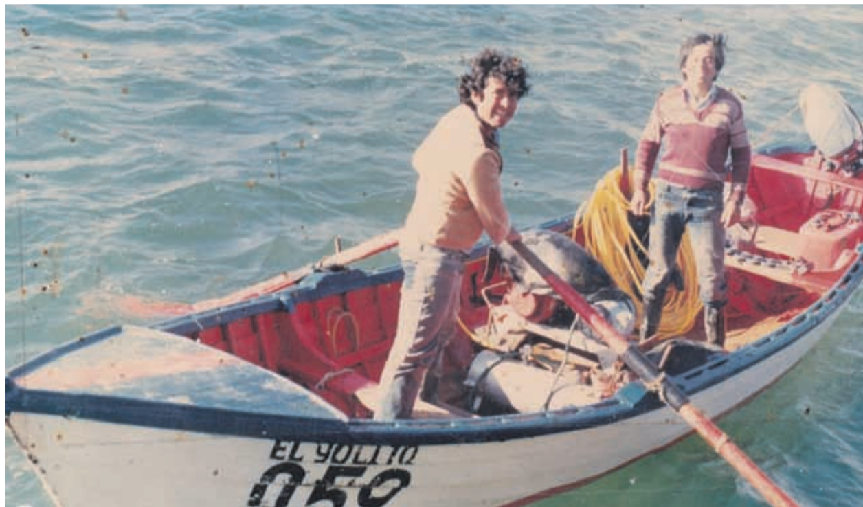
Los pescadores son uno de los pilares económicos de la localidad.

La obra fue financiada por el Fondo Cultural Tradicional Privado año 2018 del Gobierno Regional de Coquimbo edita-