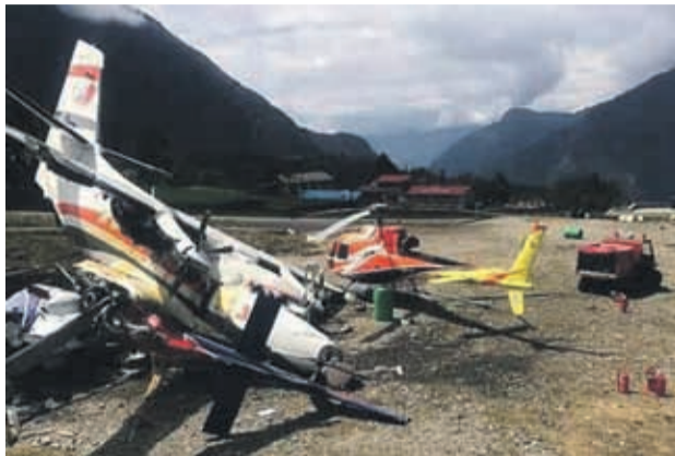
El piloto perdió el control de la aeronave y colisionó contra dos helicópteros en el peligroso aeropuerto de Lukla