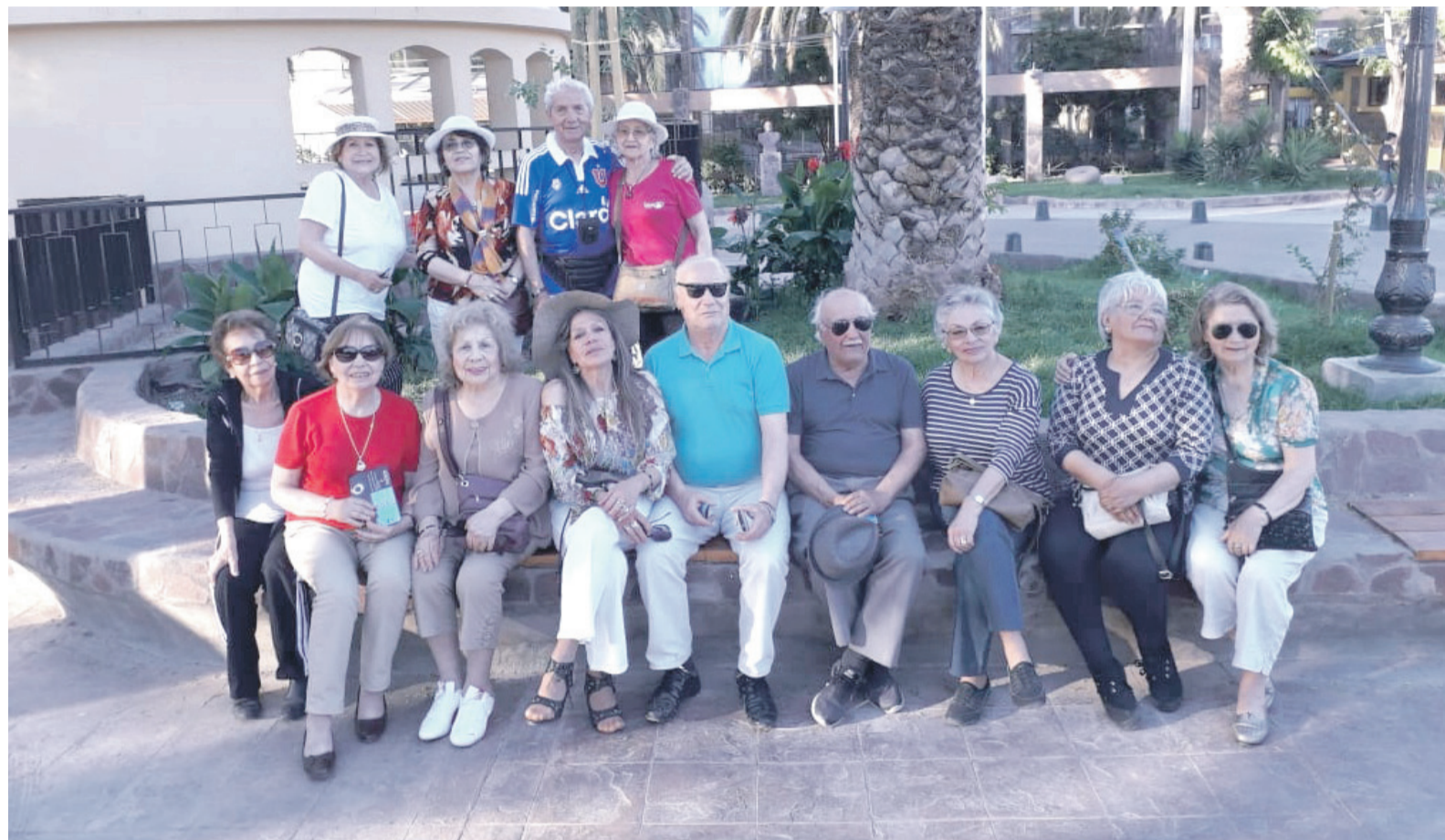
Los integrantes del club Ave Fenix en la plaza de Combarbalá. En el proyecto se indica que debían trasladarse a Los Vilos.