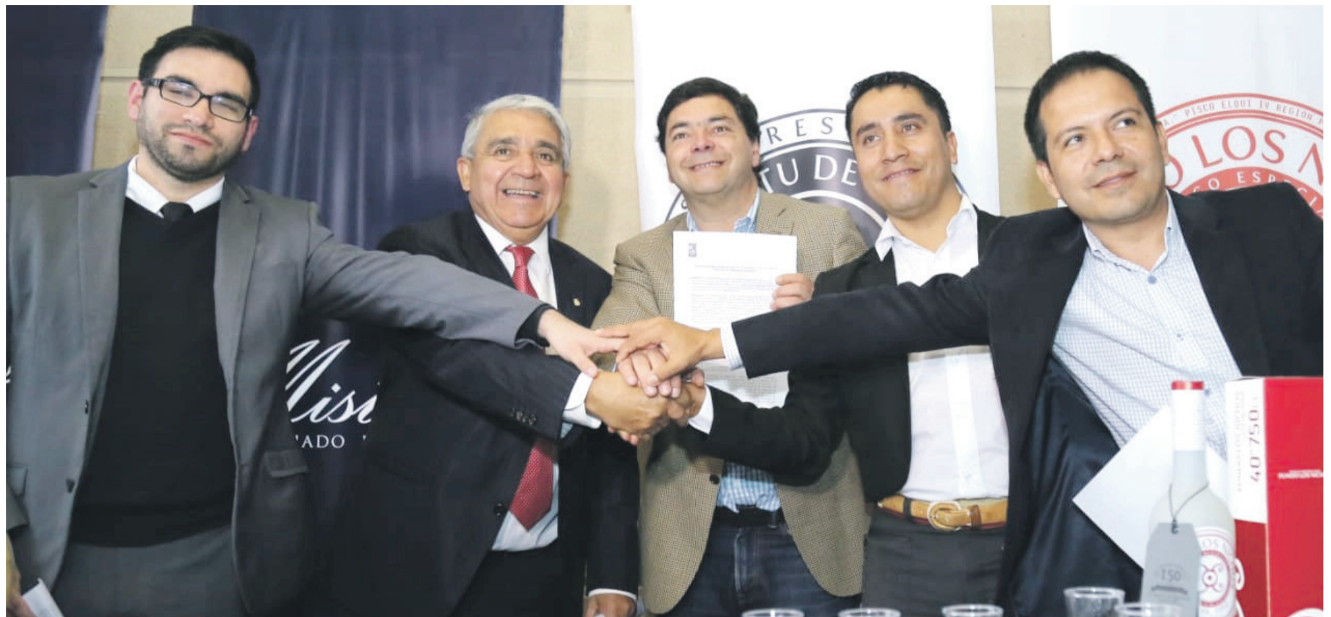
Al acuerdo , en una primera instancia, adhirieron los municipios de Salamanca, Ovalle, Paihuano y Río Hurtado y se espera que se sigan sumando apoyos de otras casas edilicias.