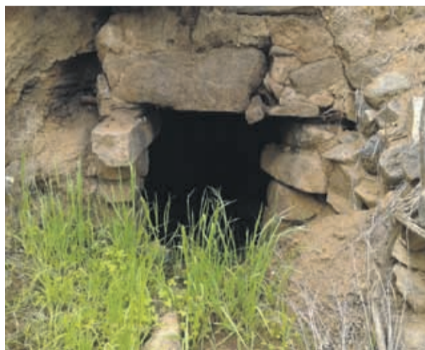
Los hornos de leña, los cuales dieron el nombre al sector.