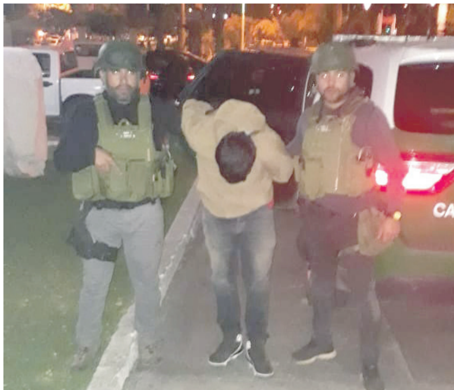
Funcionarios de la SIP lograron detener a uno de los sujetos que disparó contra el joven de 15 años. El otro todavía se mantiene prófugo.

Fue el viernes cuando los sujetos decidieron elevar el canon de la rencilla al disparar