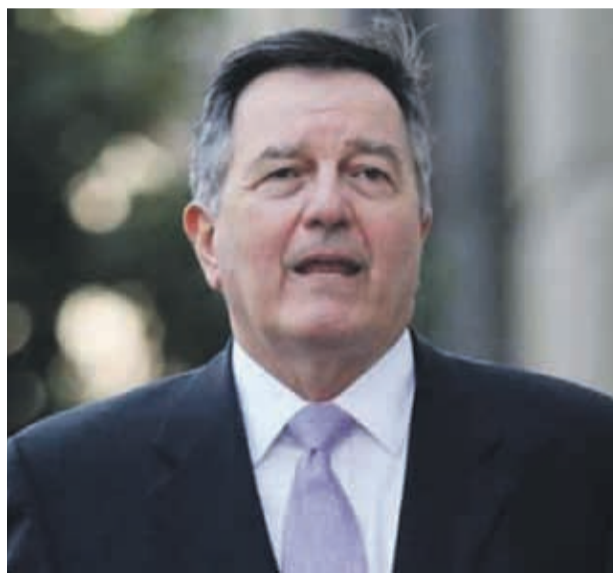
El canciller de Chile Roberto Ampuero será el anfitrión del Grupo de Lima, que se reunirá durante la jornada de este lunes en Santiago.

Abordar la crisis Los cancilleres que en Chile abordarán la crisis humanitaria, política y económica en Venezuela, también tendrán que poner en la mesa un tema bastante sensible como es el de haber fracasado en sus insistentes llamados para