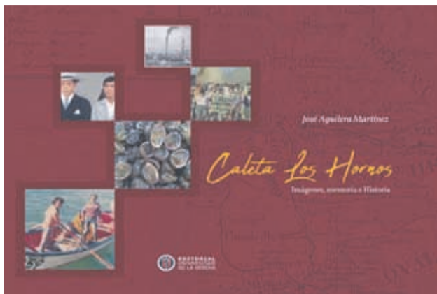
El libro fue editado por la Universidad de La Serena

"Es fundamental. El hecho de que la carretera se consolidara pasando cerca de la costa, permitió que algunas