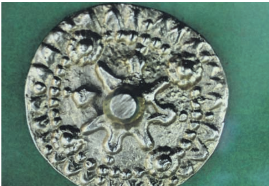
El artefacto hallado por el matrimonio, cuyo origen desconocen.

Aunque parece una moneda, ellos creen que se trata de una especie de brújula utilizada en la navegación.