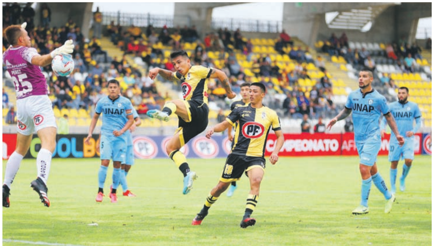
El plantel de Coquimbo Unido que ha estado en cuarentena cumpliendo con el trabajo físico asistido, retomará el contacto con la estructura y cuerpo técnico en mayo.

La administración del elenco aurinegro llegó a un acuerdo con la plantilla para cumplir con el proceso proporcional que se extenderá hasta comienzos de mayo. Aunque no existe fecha para retomar la competencia, creen que julio puede ser el mes definitivo.