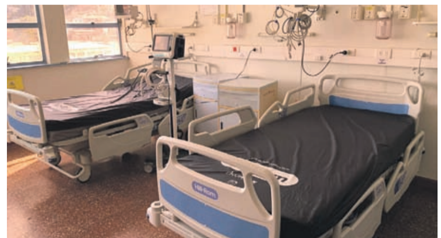
El Hospital de Contingencia inició sus actividades con la preparación del personal y la instalación de casi 40 camas

Jefe de la Defensa Regional, informó que hubo 33 detenidos por infringir el toque de queda durante las últimas 24 horas, además que la PDI fiscalizó a 76 personas que están cumpliendo cuarentena y todas han respetado la medida. “Hemos notado que están ingresando a supermercado en familia, es no acatar la medida sanitaria. Eso provoca situaciones de riesgo y eso va a ser fiscalizado, por eso, haremos una resolución para exigir de forma permanente el uso obligado la mascarilla en todos los recintos de atención de público”, acotó el General.