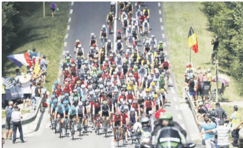
La carrera más prestigiosa del ciclismo se pospuso debido a la pandemia de coronavirus. Ahora comenzará a fines de agosto.

La pandemia ha obligado a suspender y readecuar las fechas de los grandes eventos deportivos y la mítica prueba pedaletera no se pudo librar. También se fijaron para el segundo semestre el Giro y la Vuelta.