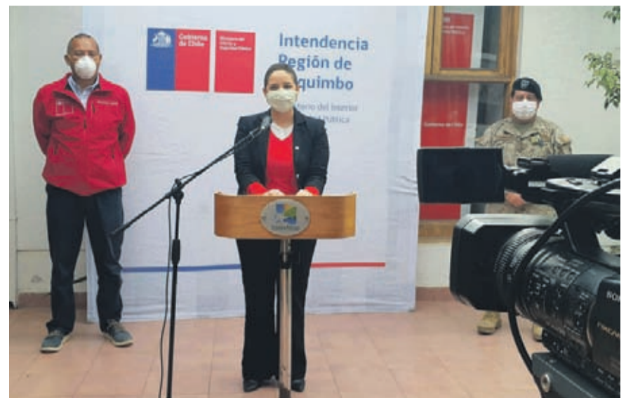
La intendenta Lucía Pinto sostuvo que las razones de estas cifras “se debe al control, identificación y seguimiento de los casos”.

En tanto la intendenta regional de Coquimbo, Lucía Pinto, explicó que el recinto ya cuenta con gran parte del equipamiento y estará en condiciones de recibir a sus primeros pacientes a partir de este miércoles, cuando finalizan las orientaciones y entrenamientos del personal clínico a cargo de recibir a los pacientes. “Hemos denominado al hospital antiguo como un recinto de contingencia y lo hemos habilitado para recibir a pacientes con Covid-19. Se trata de un establecimiento con todas las condiciones necesarias para prestar asistencia médica, entre ellas los ocho ventiladores disponibles para pacientes de la Provincia de Limarí,