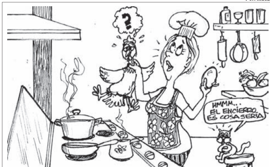
FILOSOFANDO EN CASA ¿Cuál es primero...? ¿Ah?