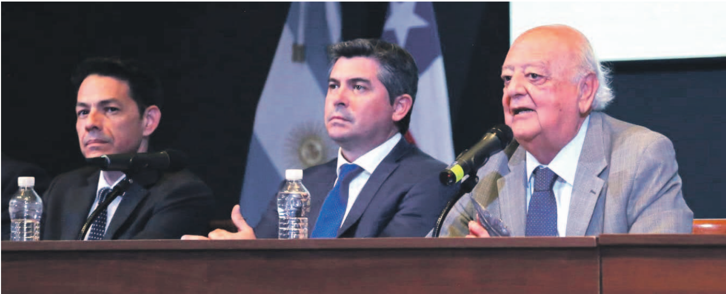
José Antonio Viera-Gallo (derecha de la imagen), embajador de Chile en Argentina, destacó la relevancia de volver a reencontrarse con este propósito compartido entre ambos pueblos.