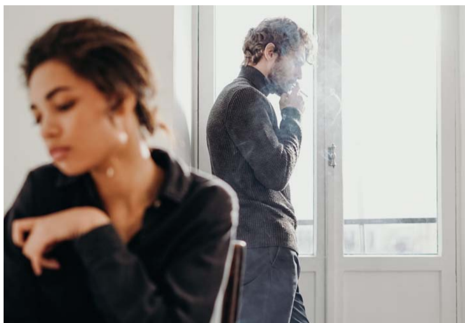
Juntos pero sin alcanzar la felicidad.

Algunas relaciones amorosas transcurren sin grandes sobresaltos, alegrías, ni tristezas, pero sin tampoco acariciar la felicidad. Son parejas en “stand by”, a las que “les cuesta estar bien”, explica una psicóloga, que describe algunas causas de esa situación de estancamiento y aporta claves para conseguir el bienestar.