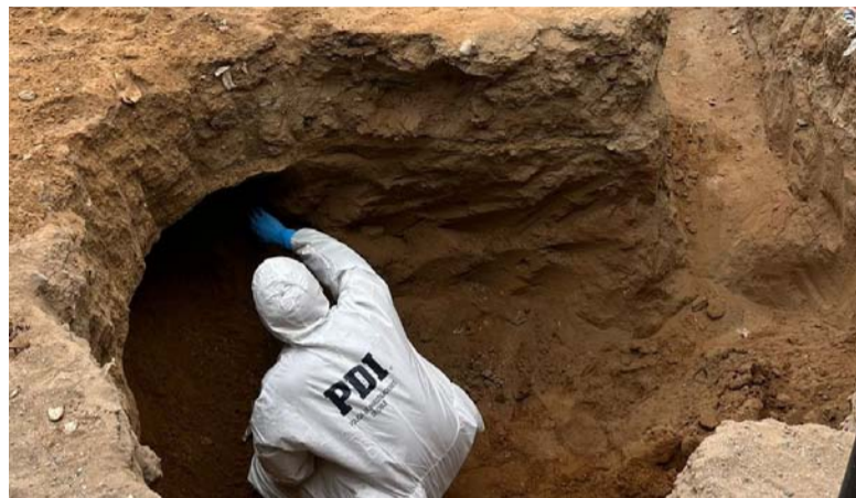
Las osamentas fueron halladas durante las obras de excavación de un alcantarillado

En este sentido, el subprefecto José Cáceres, jefe de la Brigada de Homicidios de La Serena, indicó que según al empadronamiento y entrevista con los residentes, las osamentas fueron halladas durante las obras de excavación de un alcantarillado, al