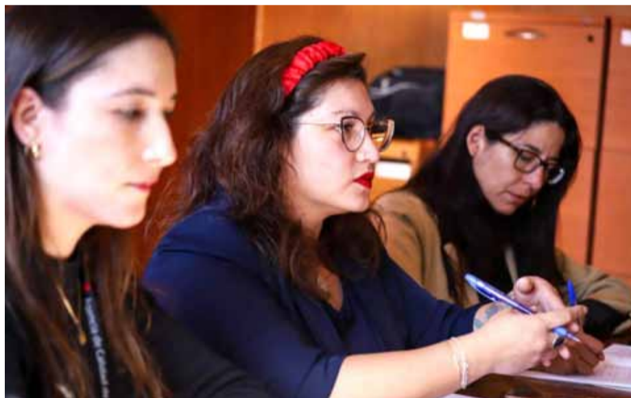
Las autoridades regionales de Educación se mostraron preocupadas por el aumento de las brechas en Matemáticas entre hombres y mujeres.