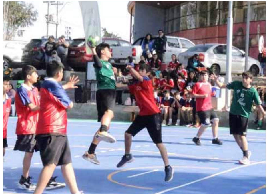
El balonmano ya tiene al mejor de la provincia de Elqui. En varones en tanto, triunfó el Golden Hind School y en damas el Amazing Grace.

En la competencia masculina, el colegio Golden Hind School, dejó en el camino a su similar de la Escuela Gabriela Mistral de Monte Grande,