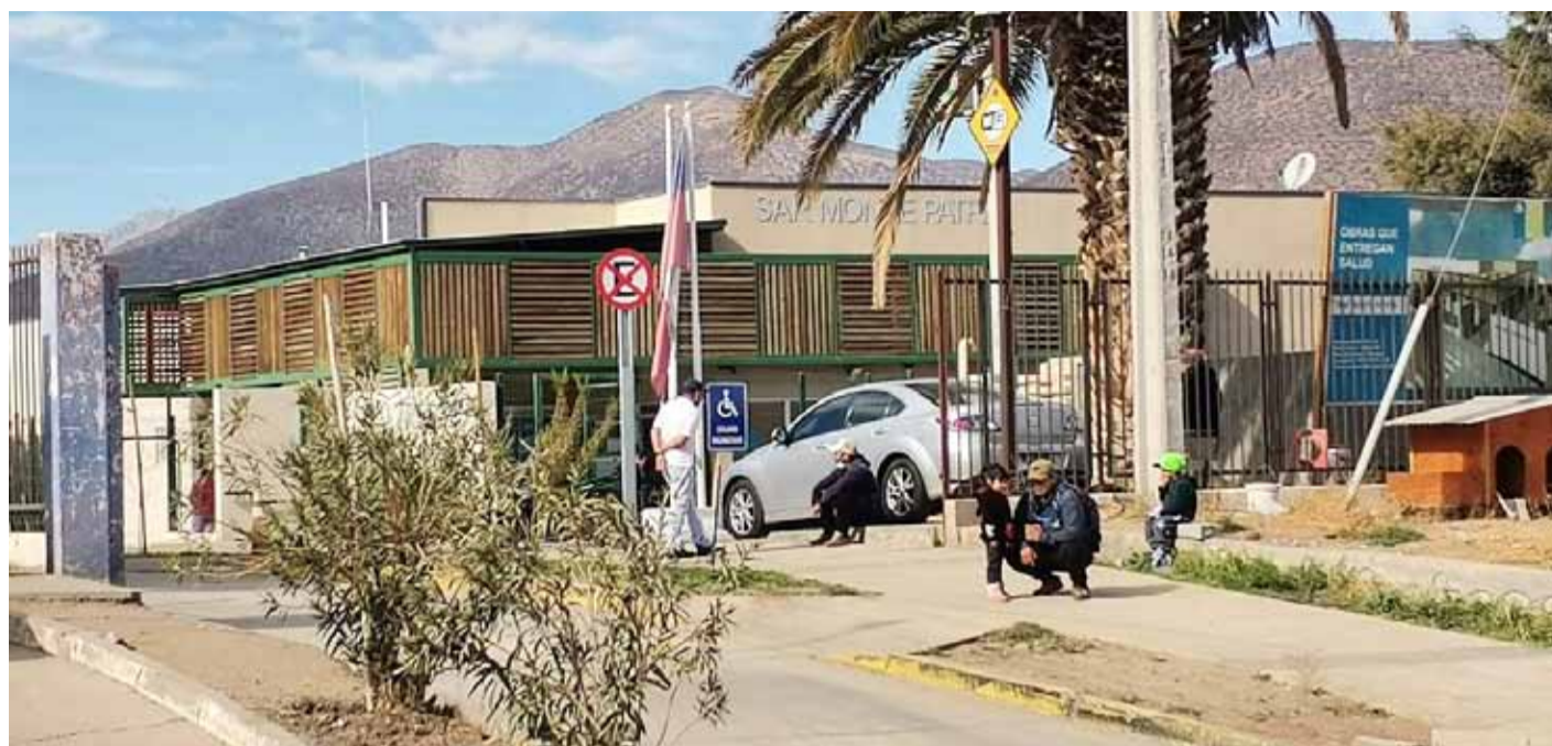
En las comunas más alejadas, los SAR, Cesfam o Cecosf cobran una vital importancia para la atención de la población.