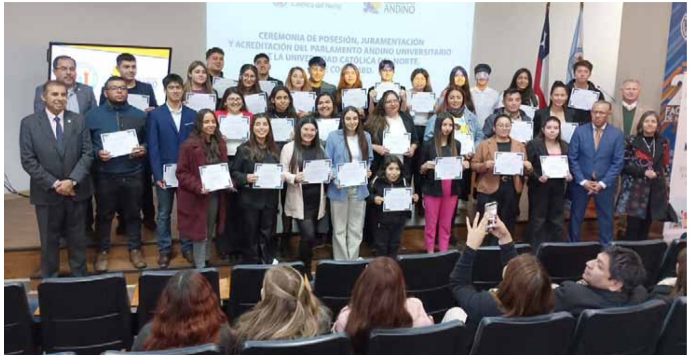
Más de 40 estudiantes de la Universidad Católica del Norte se integraron al Parlamento Andino Universitario.