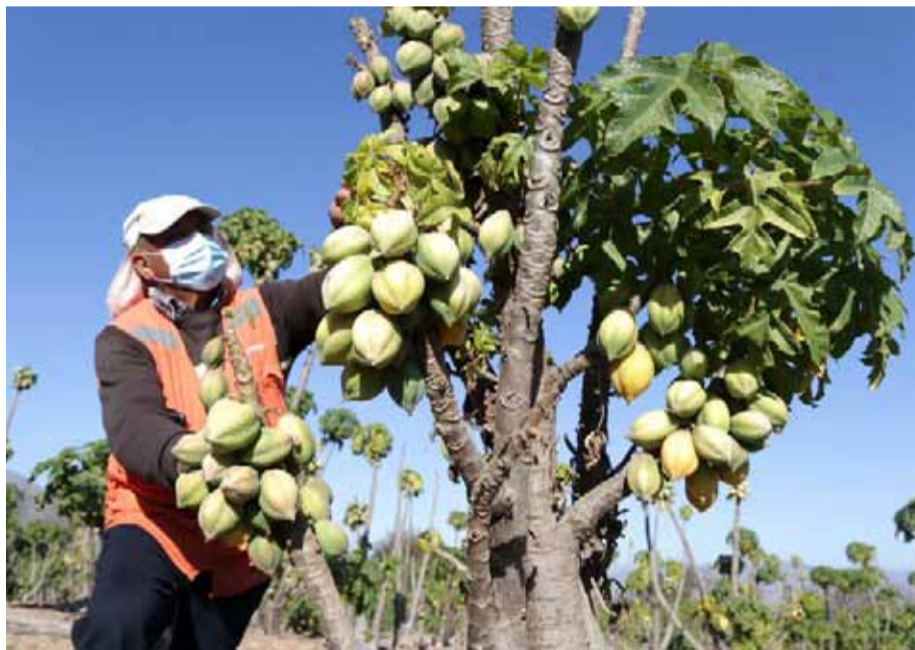
La papaya está considerada como un fruto típico de La Serena.

A través del INIA, se organizó una serie de jornadas, en las que los agricultores intercambiaron miradas y opiniones con el fin de elaborar estrategias para entregar un mayor valor agregado a la papaya cultivada en el territorio.