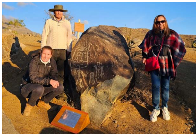
Las dos expertas en turismo conocieron los atractivos de la región.

Las jornadas formativas se realizaron en Monte Patria, Punitaqui, Combarbalá y Canela, como parte del Programa de Capacitación Internacional para Zonas Rezagadas que desarrolla ProChile para entregar asesoría respecto a la oferta de productos y servicios locales hacia el extranjero.