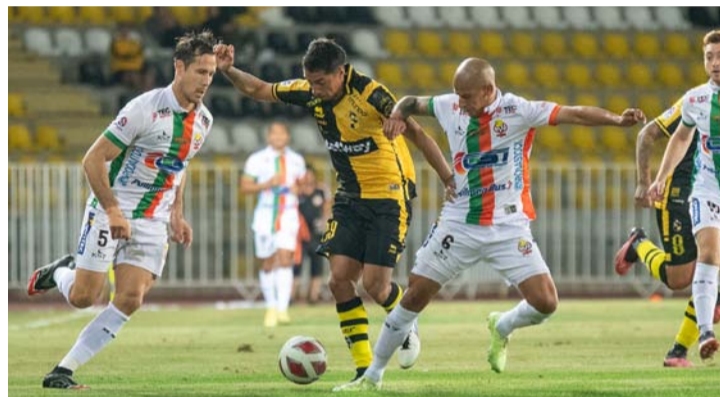
Aurinegros y albinaranjas se vuelven a encontrar después del polémico duelo que animaron el lunes 13 de marzo en el Estadio Francisco Sánchez Rumoroso.