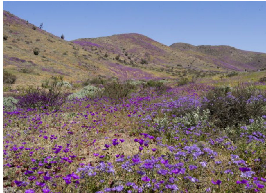
El Desierto Florido es un fenómeno de la naturaleza que se produce en el Desierto de Atacama y en la zona norte de la Región de Coquimbo cuando se presentan precipitaciones.

La escasez de lluvias y las condiciones de temperatura no se han conjugado para que se produzca el maravilloso evento que entrega la naturaleza cada cierta cantidad de años, que involucra la germinación de cientos de plantas, flores, pero también pequeña fauna con abundante cantidad de insectos y lagartijas, entre otros.