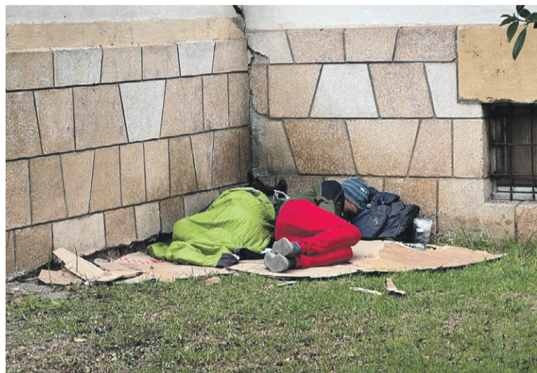
Los vecinos del sector céntrico afirman que estas personas en situación de calle cometen varias incivildades.