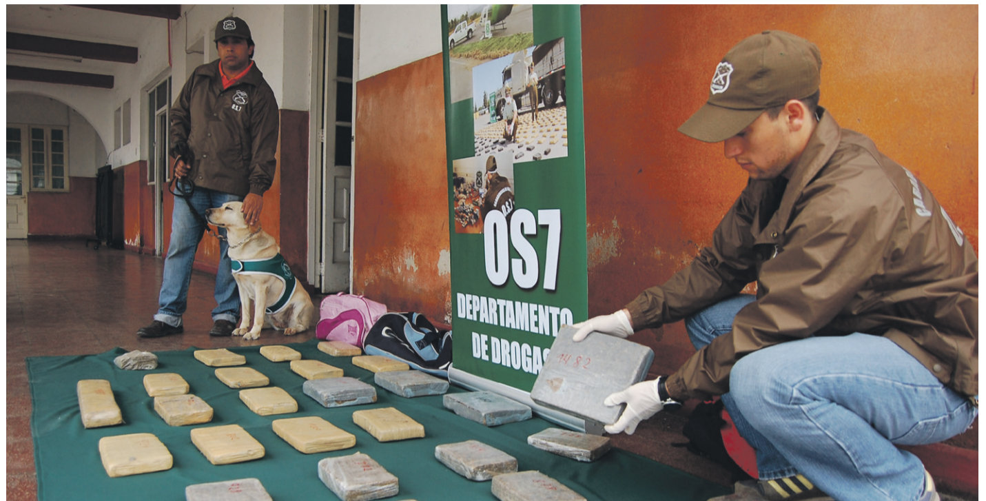
Desde la instalación del OS7 en Limarí y Choapa, se han decomisado solo este año más de 2 toneladas de cannabis.

Si bien el rol de las municipalidades en estas materias es preventivo, desde el diario El Ovalino se consultó con las autoridades locales del Limarí, respecto a las medidas que se están tomando para evitar el aumento de