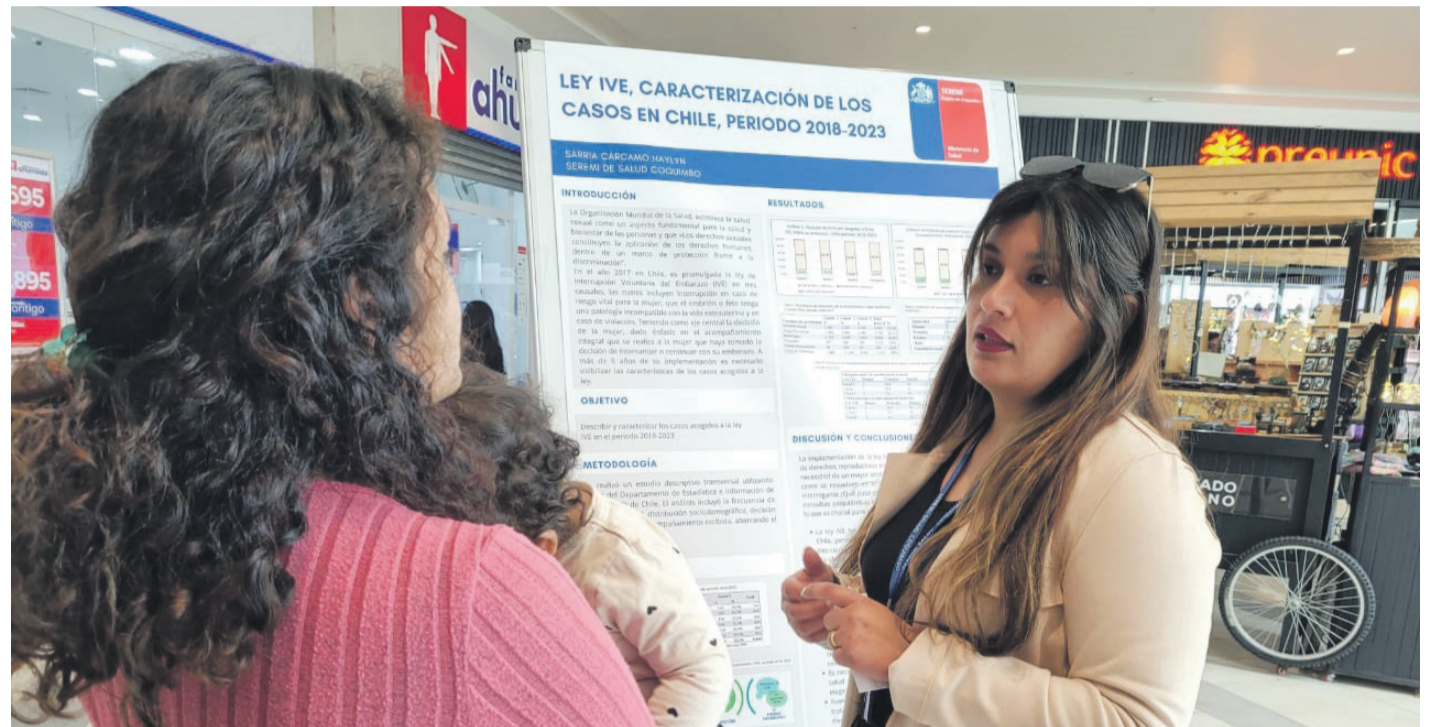
Seremis de la Mujer y Salud, enfatizaron en la importancia de seguir mejorando y acompañando su implementación en los centros de salud.

“Desde el Ministerio de la Mujer y Equidad de Género, destacamos la posibilidad que las mujeres tengamos el derecho a decidir sobre nuestra planificación familiar y la Ley IVE nos acerca a este derecho, porque nos permite interrumpir el embarazo en tres causales. Es importante destacar que desde 1931 hasta 1989, el aborto terapéutico en Chile estaba permitido y la dictadura cívico-militar nos arrebató este derecho, el que recuperamos en el gobierno de la presidenta Michelle Bachelet, avanzando en materias de derechos sexuales y reproductivos de las mujeres y en la posibilidad