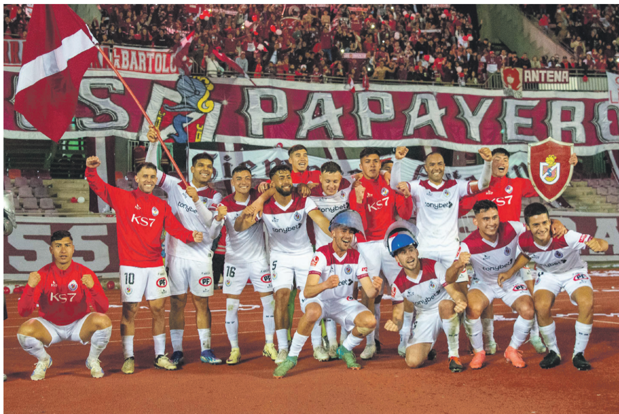
Los jugadores de La Serena tendrán unos días de descanso para volver a La Portada el 28 y recibir a Recoleta.