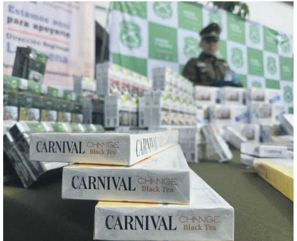
Hace unos días se detectó una gran cantidad de cajetillas de cigarrillos ilegales que estaban destinadas para ser comercializadas en la fiesta de La Pampilla.