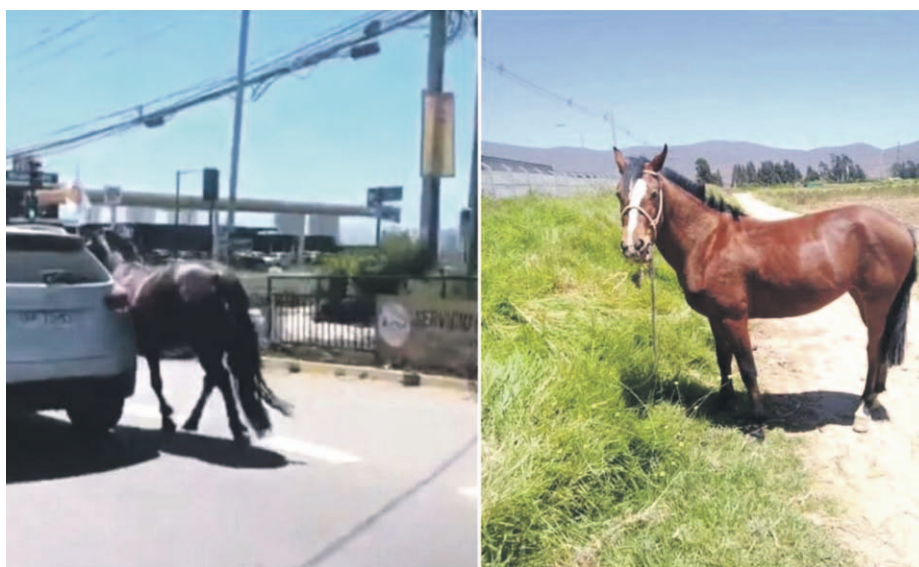
Las imágenes de la yegua siendo tirada por un vehículo por la avenida La Cantera se hizo viral en redes sociales.

El presunto autor del delito estaría identificado, pero aún no ha sido detenido. Desde la Fundación Milagro al Rescate, en tanto, así como expertos, temen que la carne del animal sea vendida en ferias de la comuna, pues la comercialización de productos provenientes de faenas ilegales constituye un grave riesgo para la salud pública.