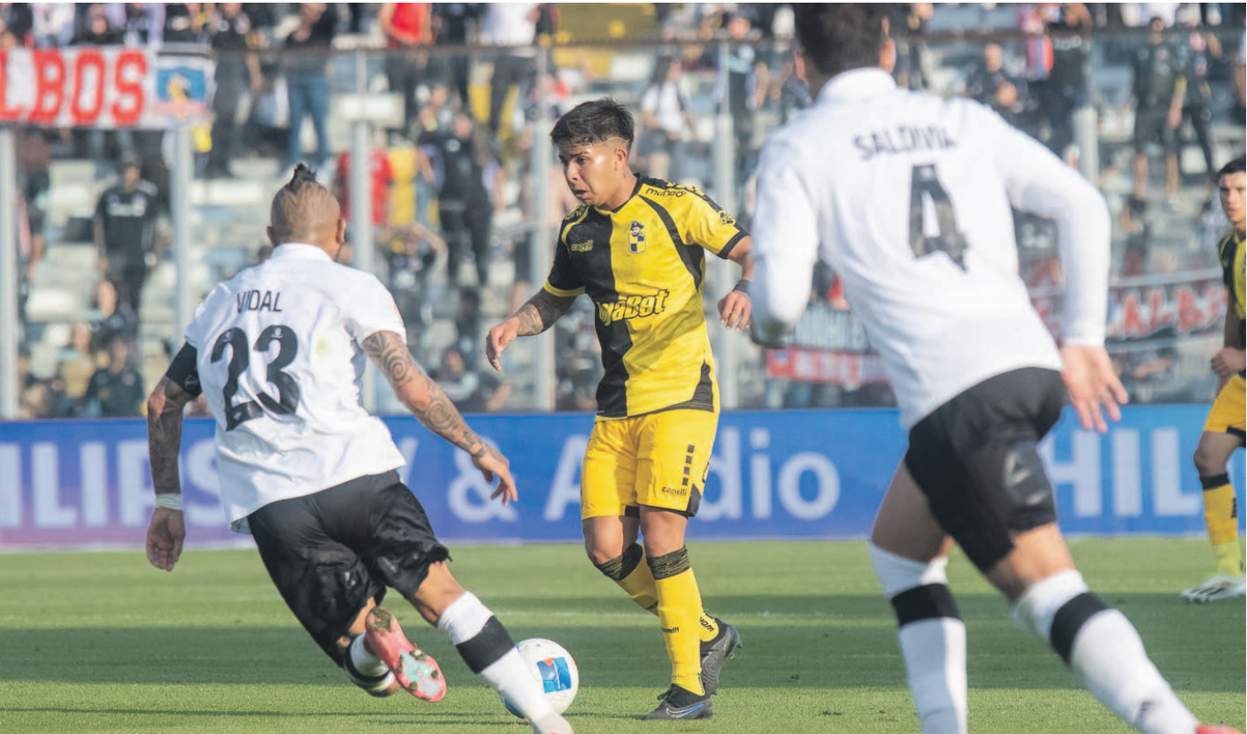
Aurinegros y albos se volverán a enfrentar en el estadio Francisco Sánchez Rumoroso, en un partido de alto vuelo válido por la fecha 24 de la Liga de Primera.