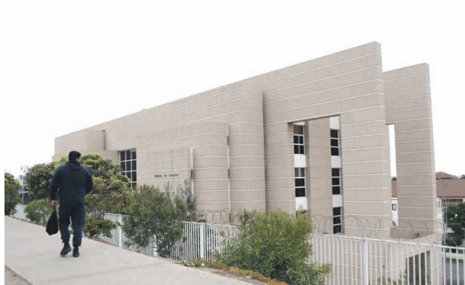
La causa quedó a la espera del veredicto final del juez.