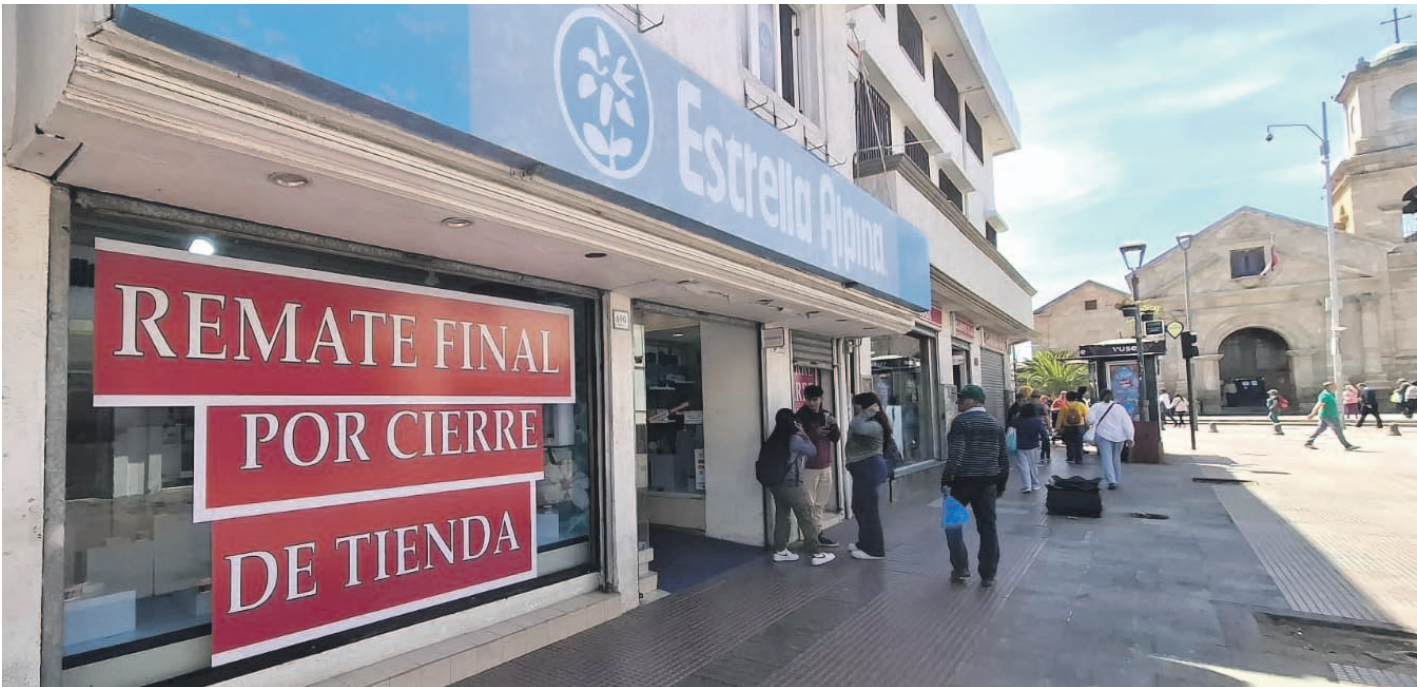
Locales como la Estrella Alpina, el Café Colonial, La Librería Rojas y Corona han cerrado sus puertas a raíz de una serie de factores económicos, sociales y de seguridad.