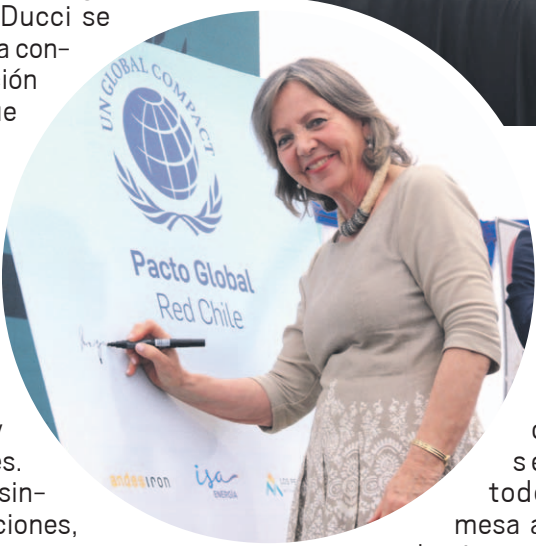
En la actividad participaron distintos representantes del sector público, privado y la academia, entre otros actores de la Región de Coquimbo.

este consejo regional es precisamente sentarnos todos en una mesa a conversar de cómo queremos que la región se desarrolle en un entorno sustentable, donde tenemos distintos rubros productivos que tienen que convivir. En ese sentido ninguno tiene que estar por sobre el otro”, agregó. Asimismo, destacó que “lo que busca esto es principalmente alinearlos todos y construir una región sostenible, más humana, donde se respeten los derechos humanos, donde todos podamos coexistir en un entorno productivo y desarrollado”. En cuanto a los objetivos del consejo, explicó que “lo primero es tener un diagnóstico muy claro y muy consensuado entre todos. Hemos visto que aquí en la región tenemos que trabajar por superar la pobreza, así como en todo nuestro país, generando más empleo, produciendo más inversión,