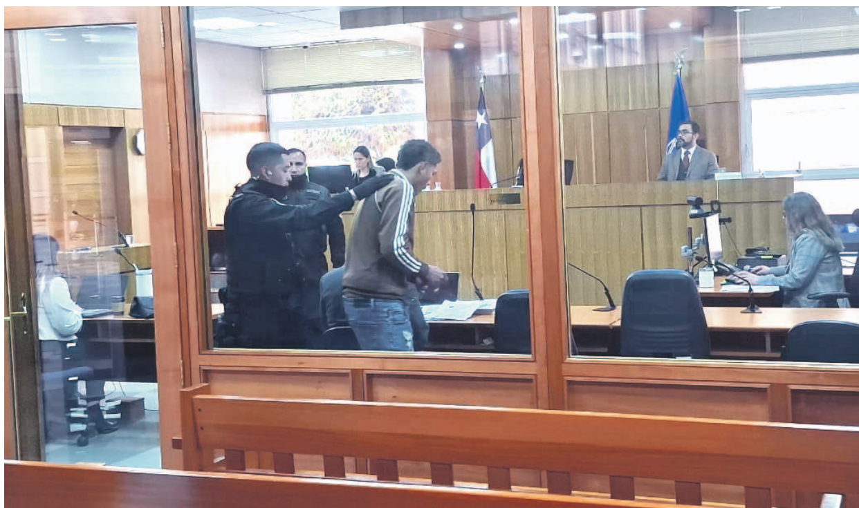
El juicio por el homicidio del médico Nicolás Pinochet culmina este jueves en el Tribunal Oral Penal de La Serena.

La defensa, en tanto, presentó un peritaje que descarta trastornos mentales en el acusado, mientras la fiscalía cuestionó su validez.