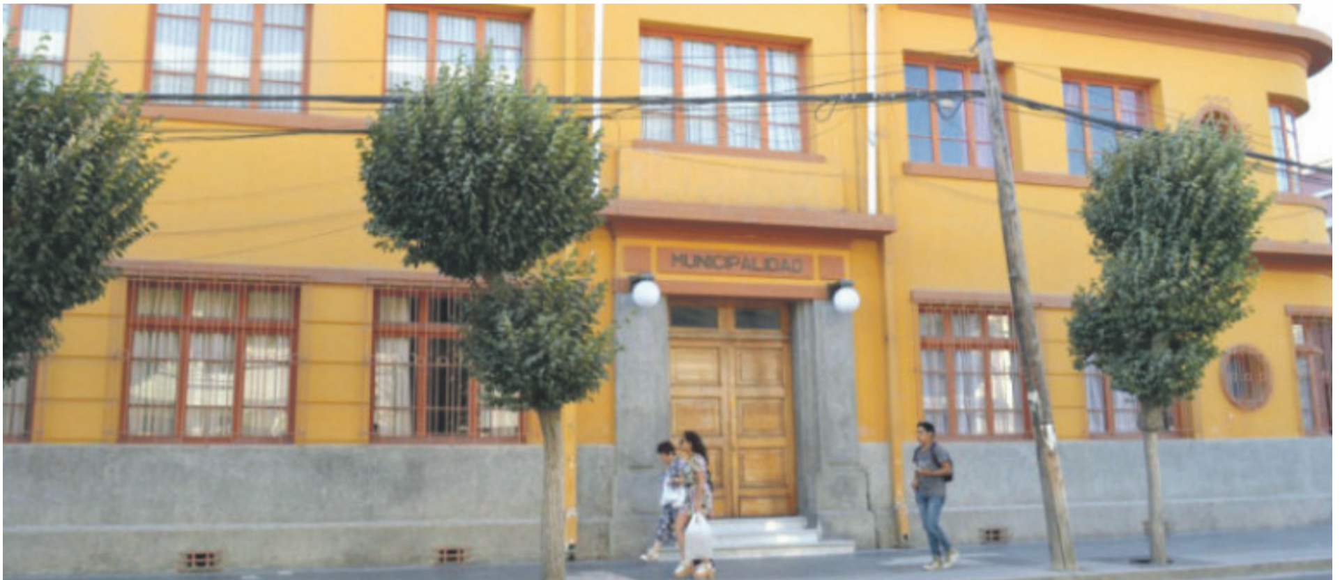
La Municipalidad de Ovalle cometió tres irregularidades entre marzo y septiembre del 2020.