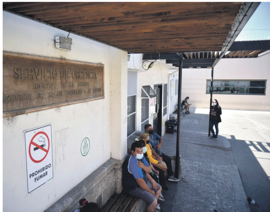
Preocupa aumento de atención con patologías críticas en urgencias de los hospitales de La Serena y Coquimbo.

Los pacientes de patologías distintas al Covid-19 están retornando a los servicios de urgencia de los hospitales de La Serena y Coquimbo. Si bien el número es menor al registrado antes de la pandemia, se trata de casos más complejos, que aumentan la presión para los equipos médicos.