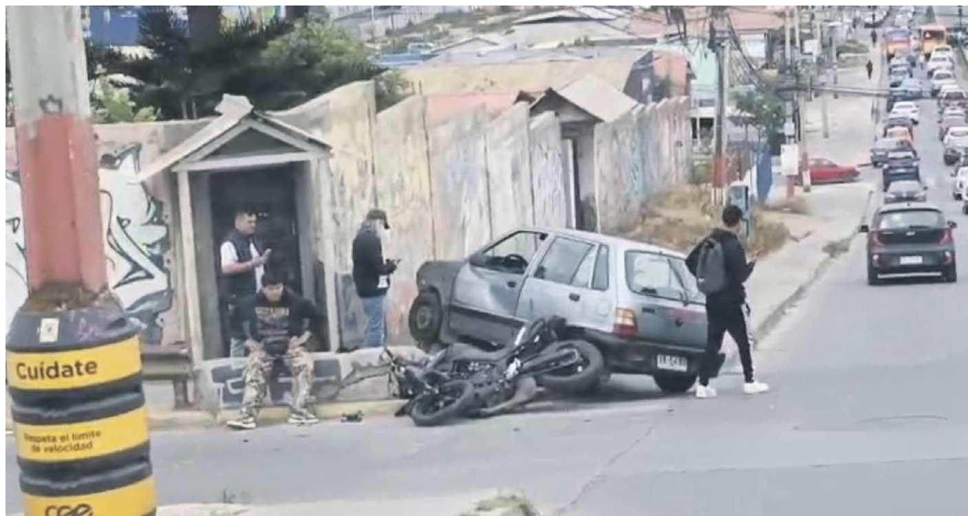
Uno de los siniestros más graves ocurrió en la intersección de calle Nicaragua con Alejandro Flores en Las Compañías.