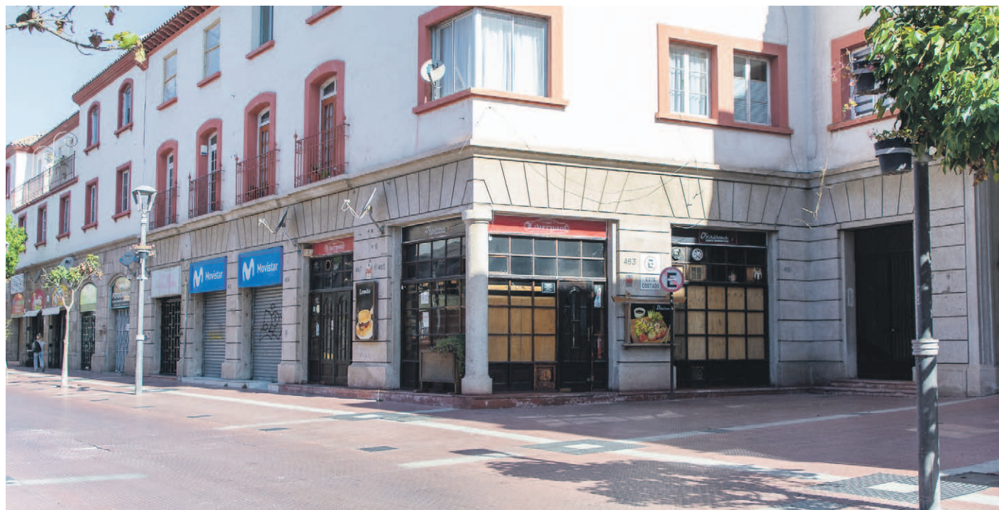
Así luce hoy el centro de la capital regional todos los días después de las 18:00 horas.