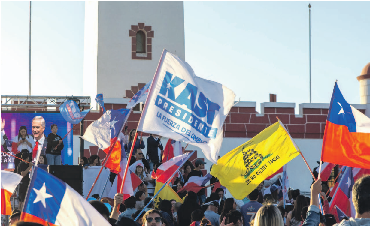
Tras conocerse el triunfo de Kast, distintos adherentes se juntaron en el Faro Monumental de La Serena para realizar los tradicionales festejos.

La Región de Coquimbo replicó la tendencia nacional en la preferencia presidencial. Según los resultados del Servicio Electoral con el 100% de las mesas escrutadas, José Antonio Kast se impuso en 12 de las 15 comunas, quedando en desventaja solo en Canela, Andacollo e Illapel. Como dato, Río Hurtado fue la comuna donde Kast obtuvo su mayor distancia, alcanzando un 68,10%, mientras que Jeannette Jara llegó al 31,90%. A nivel regional, el líder republicano logró 288.086 votos (54,17%), frente a los 243.770 votos (45,83%) de Jara. Pese al llamado de Franco Parisi —quien en la primera vuelta obtuvo 147.901 votos, equivalentes al 26%— se registraron 42.607 votos nulos, cifra que corresponde apenas al 7,30%. NO SE CUMPLIERON LAS EXPECTATIVAS Uno de los resultados más llamativos se produjo en Coquimbo, comuna que desde el oficialismo se proyectaba como un bastión seguro para Jeannette Jara. La expectativa era alta: la candidata eligió este territorio para su cierre de campaña y contaba con el respaldo de los hermanos Manouchehri, ambos con un amplio caudal histórico de votos en sus propias elecciones como alcalde y diputado. Sin embargo, el resultado final no acompañó ese optimismo. Jara obtuvo 46,96%, mientras Kast se impuso con 53,04%, desdibujando el escenario que el oficialismo consideraba favorable y evidenciando que la transferencia de apoyo no se