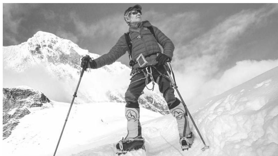
Imagen de Carlos Soria en el Manaslu.

Antes del amanecer, entre las cinco y media y seis de la mañana, el alpinista Carlos Soria ya está levantado para comenzar su rutina de ejercicios: pedalear, subir y bajar las escaleras de su casa, pesas, caminar por los bosques cercanos o entrenar en el rocódromo.