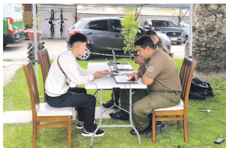
Carabineros desplegó servicios extraordinarios para el resguardo del proceso electoral y la recepción de excusas.

electoral, la institución informó un total de 47 detenidos en la región: 45 por mantener órdenes de detención vigentes, uno por negarse a cumplir funciones como vocal de mesa y otro por conducción en estado de ebriedad. Carabineros destacó que no se registraron incidentes mayores