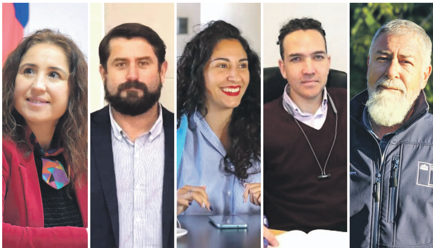
En la imagen los secretarios (a) ministeriales que cumplirían su periodo de 4 años en el Gobierno de Gabriel Boric.