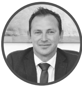
Ali Manouchehri ALCALDE DE COQUIMBO

“Soy una alcaldesa independiente que no recibió nada de este Gobierno este año para levantar la economía en la agricultura y en la ganadería”