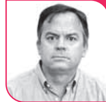
MATÍAS WALKER Diputado DC, Región de Coquimbo.