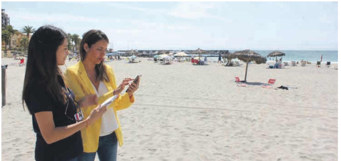
Durante la fiscalización a playa Las Tacas la Seremi de Bienes Nacionales probó en terreno la nueva aplicación Playapp que permite ver los accesos de 900 playas a lo largo del país.

El año pasado la región lideró en denuncias sobre acceso a playas, ríos y lagos con 346 reclamos. Durante esta primera quincena de enero se han registrado 21 denuncias a la fecha. Bienes Nacionales recordó que mientras exista acceso peatonal se cumple con la legislación vigente, sin embargo el trabajo de la cartera está enfocado en la relación con particulares para facilitar el ingreso a las costas chilenas que pertenecen a todos.