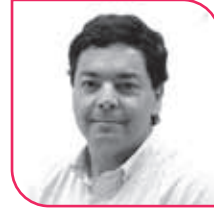
JUAN MANUEL FUENZALIDA Diputado UDI, Región de Coquimbo.