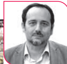
DANIEL NÚÑEZ Diputado PC, Región de Coquimbo.