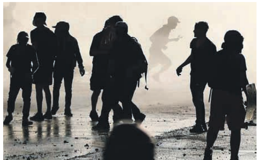
La iniciativa busca tipificar y penalizar actos como los saqueos, la instalación de barricadas y prácticas como "el que baila pasa" que impiden el libre tránsito.

El actual proyecto, que en el Senado se redactó con modificaciones muy distintas a las que provenían de la Cámara, tipifica las penas para el delito de saqueo y las barricadas en las calles, además de prácticas como "el que baila pasa".