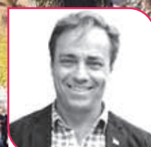
FRANCISCO EGUIGUREN Diputado RN, Región de Coquimbo.