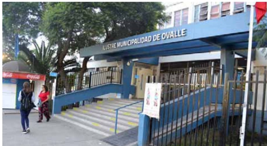
Revuelo ha causado el caso de funcionarios municipales que fueron sorprendidos con drogas en un vehículo fiscal.

Por su parte, el concejal Patricio Reyes coincide en que este proceso debe ser lo más expedito posible, considerado al gravedad de los hechos, haciendo de paso un llamado a transparentar la información, "la situación es extremadamente grave para la imagen del municipio. Se deben tomar medidas y dar señales claras y precisas, también se necesita la cuantía del volumen de droga que había en el vehículo fiscal, la comunidad también quiere señales claras con respecto a eso. Como concejal lo primero que pedí fue el sumario y que se analice la situación del contrato de la camioneta, hay que dar señales claras contra las drogas. Ojalá que de aquí al lunes los funcionarios puedan estar desvinculados, obviamente tras