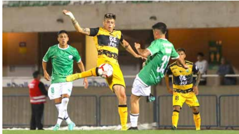
El cuadro de Provincial Ovalle viajó el jueves hasta el sur del país para preparar el duelo de esta noche ante los vialinos.