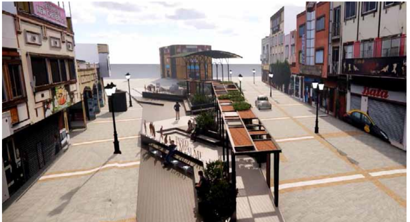
La intervención en calle Aldunate contará con acceso de vehículos de emergencia y se conecta con otras iniciativas .

En este plan estratégico, uno de los espacios que tendrá una fuerte intervención es calle Aldunate, en el corazón del centro coquimbano. En este lugar ya se iniciaron los trabajos del futuro “Paseo Empalme”, que remodelará este icónico sector, punto de encuentro de los coquimbanos. Son más de $380 millones de pesos para cambio de piso, instalación de sombreadero, módulos para emprendimientos, espacio para el arte