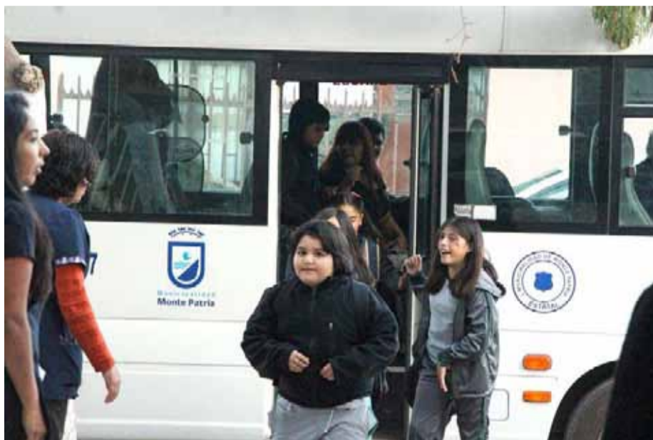
Las escuelas en Monte Patria también se han visto afectadas por la sequía extrema. CEBIDA

sos hídricos es crítica, por no decir devastadora, la que no solo apunta al sector agrícola. En vista de la reducción de oportunidades laborales en la zona, debido a la sequía, la autoridad comunal teme que la situación empeore, sobre todo, para familias del rubro agrícola y comercial, lo que también afectaría la calidad de vida, eventualmente, de los estudiantes.