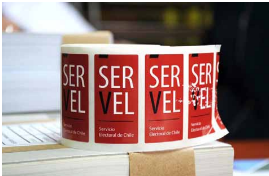
Las mesas necesitarían 850 minutos, es decir, más de 14 horas en atender a los 350 electores.

Según explicó el presidente del Servicio Electoral, considerando la cantidad y amplitud de los votos, la jornada de elecciones podría demorar hasta 14 horas si no se divide en dos días.