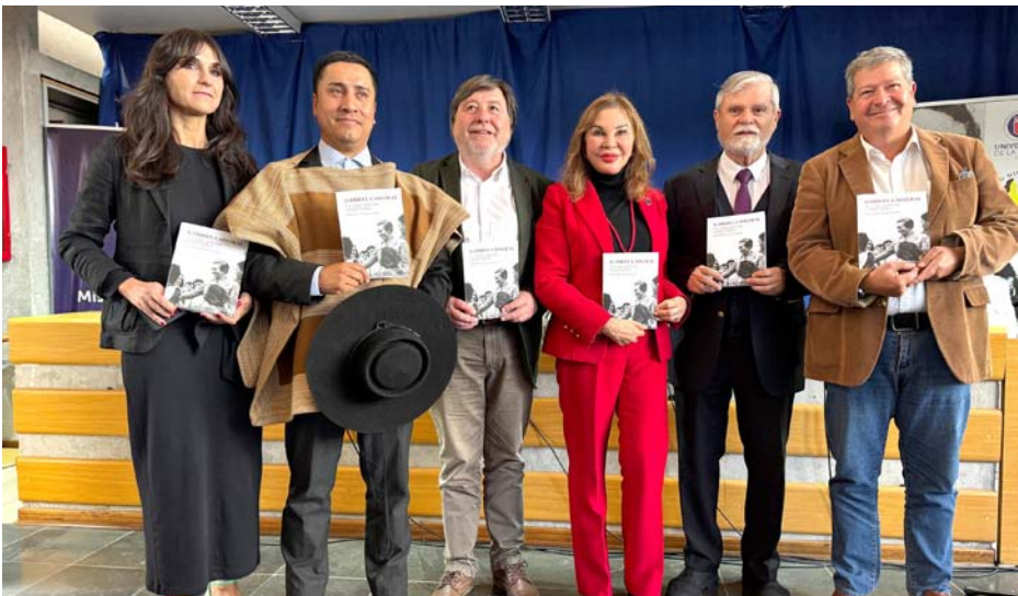
La actividad fue organizada por la Universidad de La Serena en conjunto con la Biblioteca del Congreso Nacional y reunió a autoridades, académicos, estudiantes y vecinos de la región.

“Gabriela Mistral nació en Vicuña, pero vivió sus primeros años en Montegrande, donde era oriunda su familia, especialmente por parte de su madre. Su infancia no fue fácil. A los 9 o 10 años fue apedreada por sus compañeras de curso, instigadas