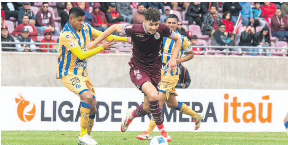
Deportes La Serena viajará este miércoles a Santiago para enfrentar uno de los duelos más complicados de esta primera parte del año frente a la Universidad de Chile.

El conjunto serenense se trasladará este miércoles a la capital para enfrentar a los azules este jueves en el inicio de la octava fecha de la Liga de Primera. El elenco regional viene de vencer a Everton, mientras que el local, cumple una sólida participación en Copa Libertadores.