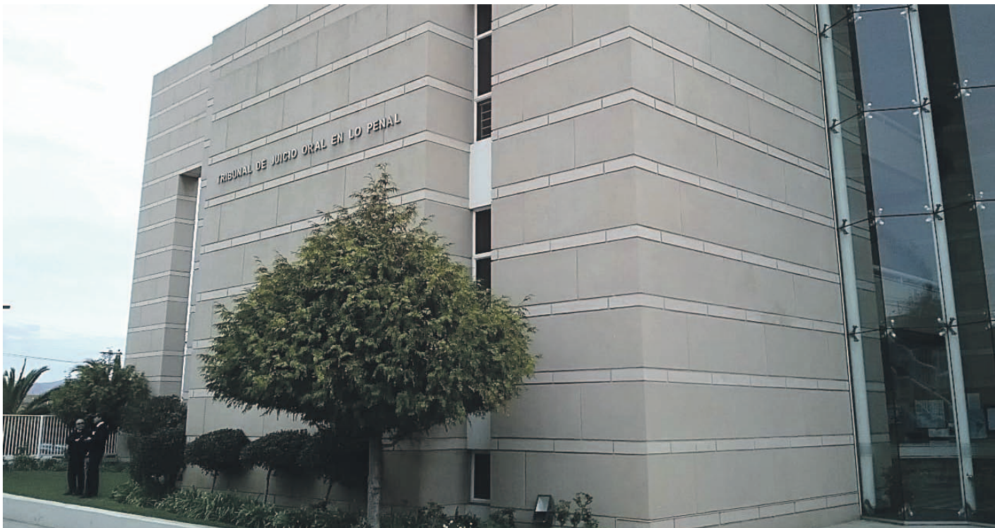
La fiscalía investigó una serie de robos ocurridos entre los meses de enero y mayo de 2023 en los que participaron dos sujetos de nacionalidad venezolana.

A las penas de presidio perpetuo simple fueron condenados dos sujetos de nacionalidad venezolana, luego que la Fiscalía de Análisis Criminal y Focos Investigativos de la Fiscalía Regional de Coquimbo acreditara una serie de robos violentos ocurridos en la conurbación de La Serena y Coquimbo y en la Región Metropolitana, hechos ocurridos entre enero y mayo de 2023. “Eran robos cometidos por una banda de entre dos a cuatro personas, movilizadas en vehículos. Tenían armas aparentemente de fuego para atacar a comerciantes a quienes golpeaban y maniataban. Se apoderaron de especies como celulares, dinero en efectivo y lo que encontraran o sirvieran, para