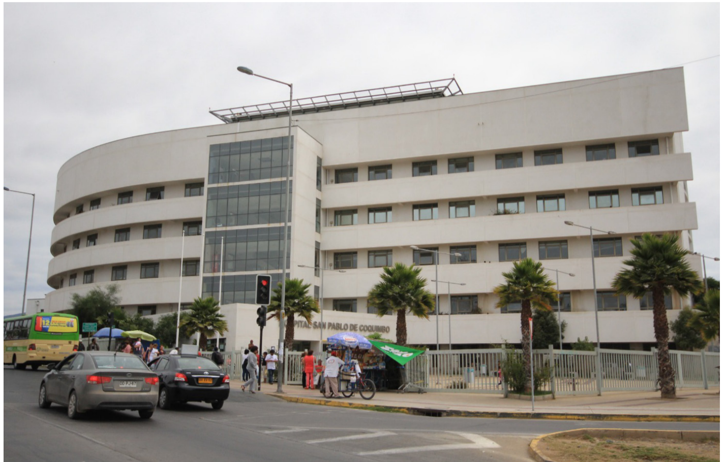
Una de las dos estudiantes accidentadas aún se mantiene internada en el Hospital de Coquimbo.