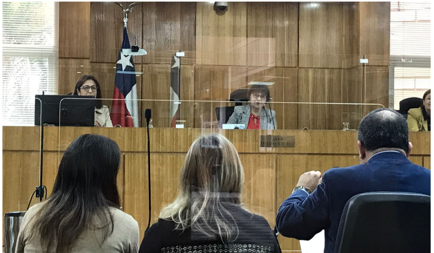
La Fiscalía expone sus alegatos de clausura en el Tribunal de Juicio Oral de La Serena.

Sobre todos los hechos, los acusados alegan inocencia.