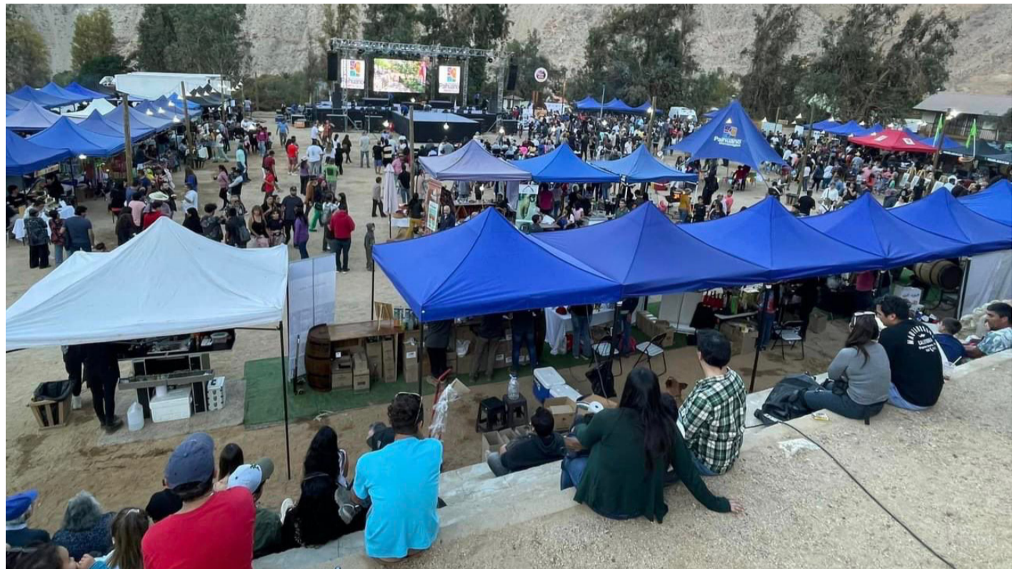
Luego de participar en las actividades por el Día del Pisco, un funcionario municipal atropelló a una vecina.