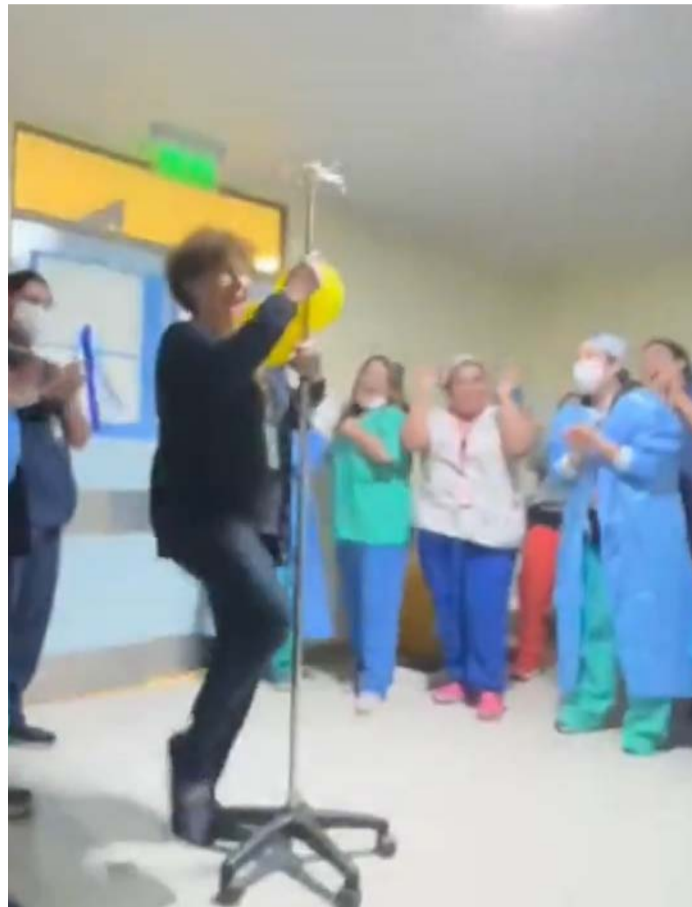
Captura de pantalla del video en donde se aprecia la celebración del personal médico en el Hospital de Coquimbo.

El registro audiovisual subido por el usuario Crytolover fue publicado este lunes en la red social con el siguiente posteo: "Mientras se incrementa la lista de espera, EU jefa de pabellones en Hospital Coquimbo suspende tabla a las 15 horas para hacer una disco en pabellón y celebrar el día de la en-