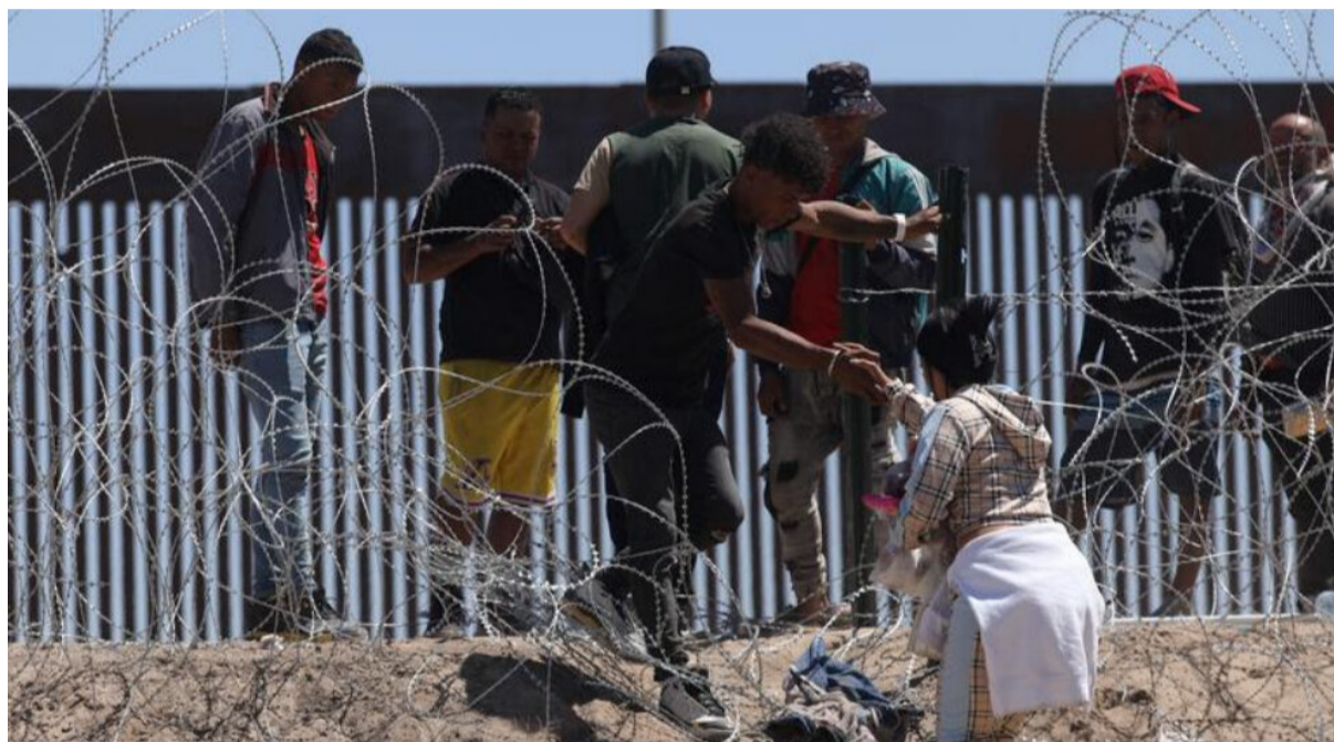
Los cruces irregulares en la frontera entre México y Estados Unidos han disminuido en un 50% durante estos últimos días.