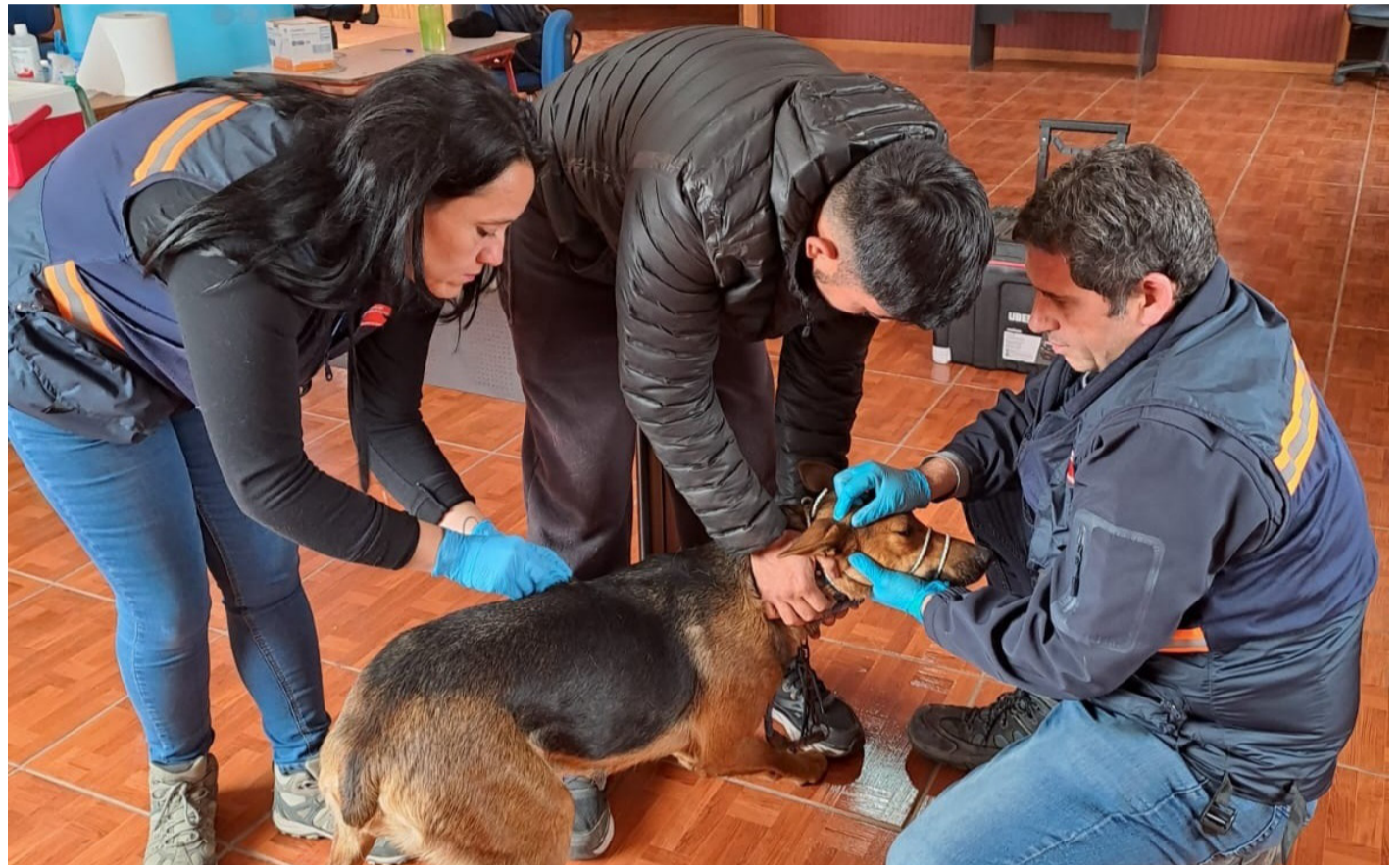
Perros y gatos fueron el foco del operativo de vacunación.