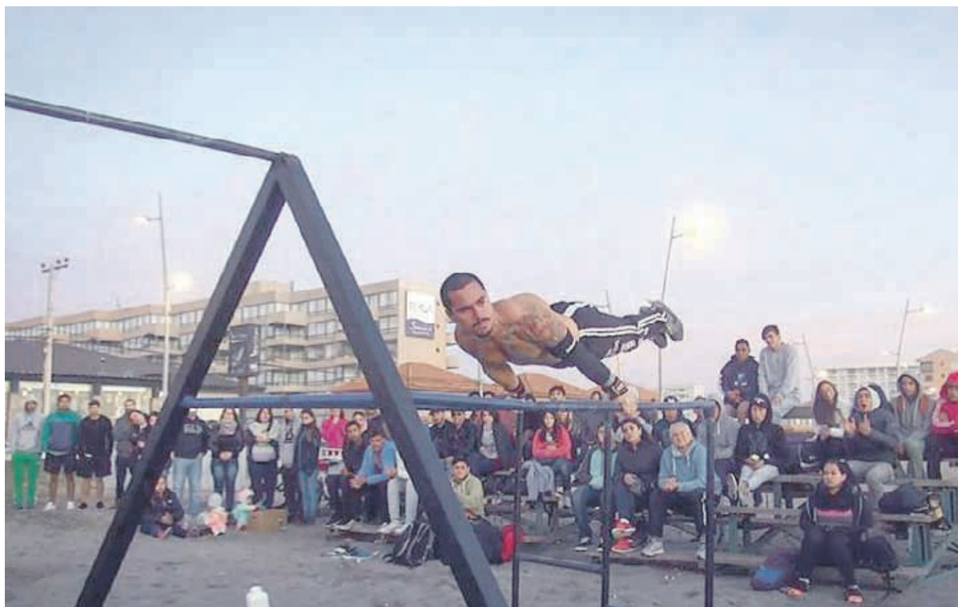
En competencias en la Avenida del Mar ya mostraba su calidad y su intensa preparación física.

Es más, las competencias a nivel internacional surgen gracias a que los ganadores de cada uno de los países van uniéndose por medio de las redes sociales, facilitando así la realización de más y más torneos..