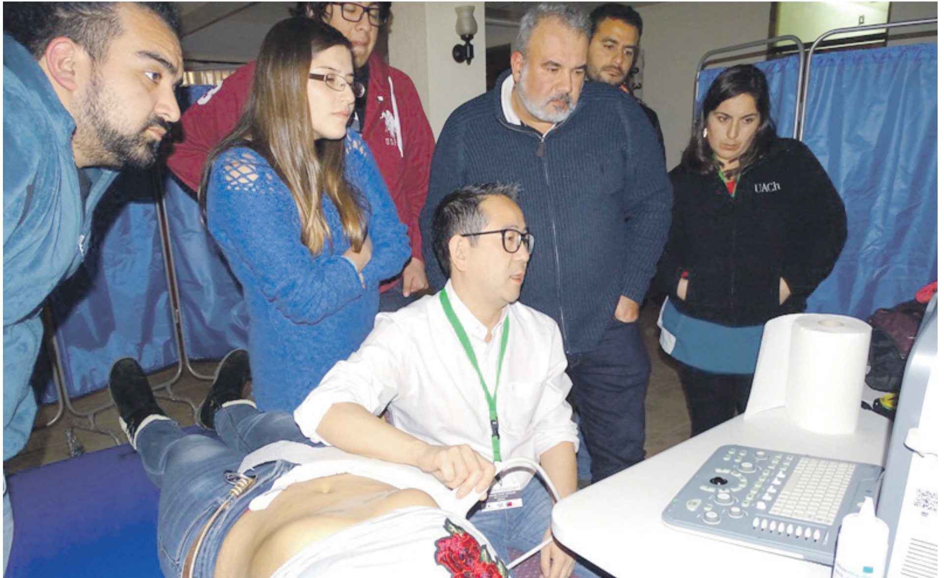
El primer operativo de este tipo en Chile recorrió diversas comunidades donde la enfermedad está presente debido al flujo de caprinos y ovinos.