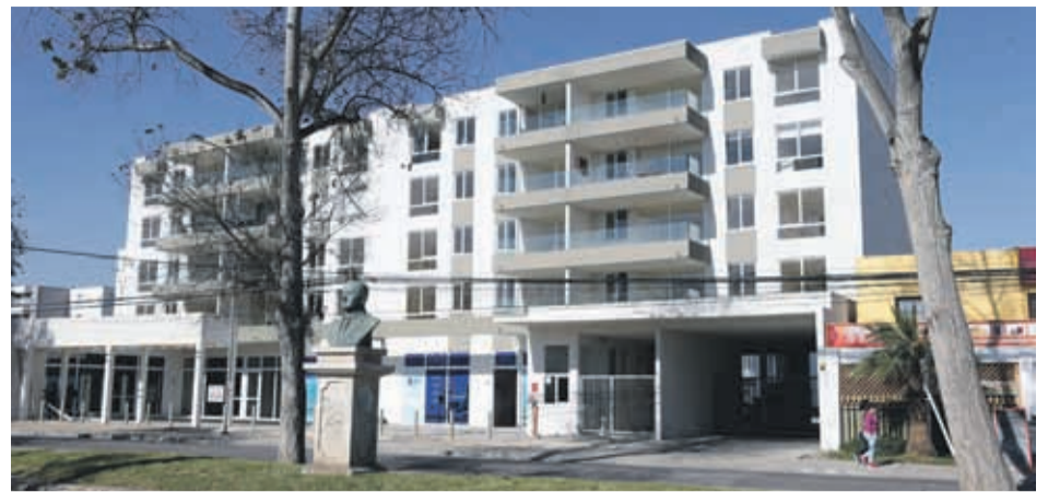
Los proyectos inmobiliarios son algunos de los que más se ven afectados por el amplio plazo que las empresas eléctricas toman para recepcionar las obras.

hoy las empresas eléctricas estarían tomando entre ocho meses hasta dos años en recepcionar un proyecto, plazo que puede aumentar si existen observaciones.