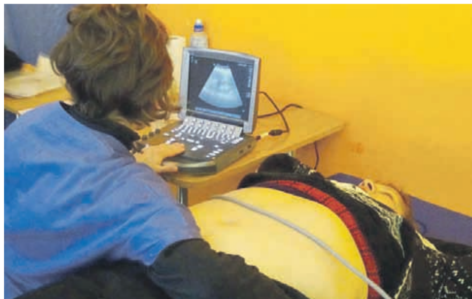
El trabajo comenzó el pasado 24 de junio, cuando médicos extranjeros expertos capacitaron a médicos de la región para detectar y tratar la enfermedad en sus etapas tempranas

Más de 2.500 ecografías gratuitas se realizaron en cinco localidades de la comuna en un lapso de tres semanas. Los análisis y resultados definitivos serán entregados durante el semestre.