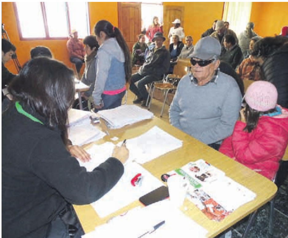
Este proyecto es financiado por un fondo EU-LAC health/FONIS y se lleva a cabo con profesionales de países como Argentina, Perú, España e Italia. En Chile está a cargo de la Facultad de Ciencias Veterinarias de la Universidad Austral

Según los antecedentes, en la localidad se registran entre 5 y 10 casos por cada 100 mil habitantes, mientras que el promedio nacional es de 2 por el mismo número de habitantes. Esto quiere decir que la zona es endémica