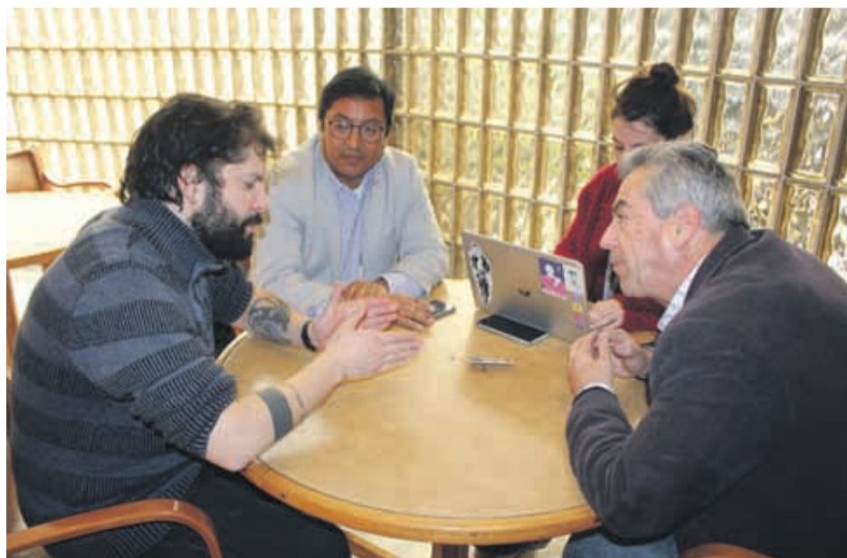
Los diputados Boric y Winter se comprometieron a generar un proyecto de ley para atender lo planteado por los dirigentes del comercio.

El encuentro tuvo por objetivo dar a conocer los “graves” inconvenientes que han significado el desarrollo de obras de pavimentación en las principales calles del centro de Coquimbo, como lo son Aldunate y Melgarejo, además de las calles que atraviesan. A la fecha, los trabajos se han retrasado más de lo inicialmente presupuestado, gene-