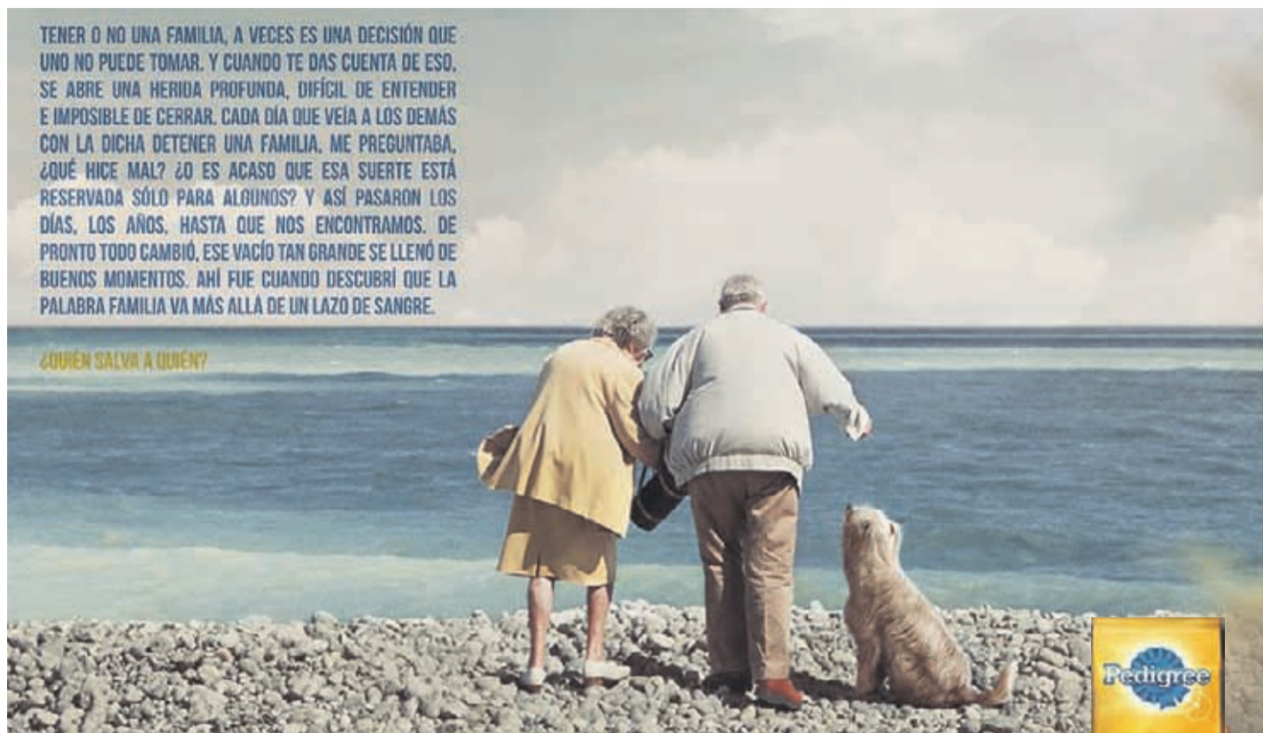
LA CAMPAÑA “QUIÉN SALVA A QUIÉN” que fue realizada por la agencia BBDO México, ganó en la categoría Outdoor, gracias a tres excelentes piezas que tenían por objetivo que más perros que están en el abandono encuentren el hogar que merecen y fuesen alimentados con Pedigree.

Indica que “nosotros hemos estado en campañas de esterilización para perros con y sin dueño, de esa manera tenemos un control natal en la población de perros