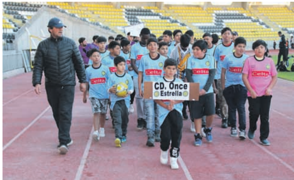
El Club Deportivo Once Estrella espera sacar la cara por el sector de Tierras Blancas.

Una gran fiesta deportiva se vivirá esta semana. Se trata de “Coquimbo Soccer Cup Invierno”, el cual dio el vamos en el estadio Francisco Sánchez Rumoroso. Se trata de la sexta edición del torneo de fútbol infantil - juvenil que contará con