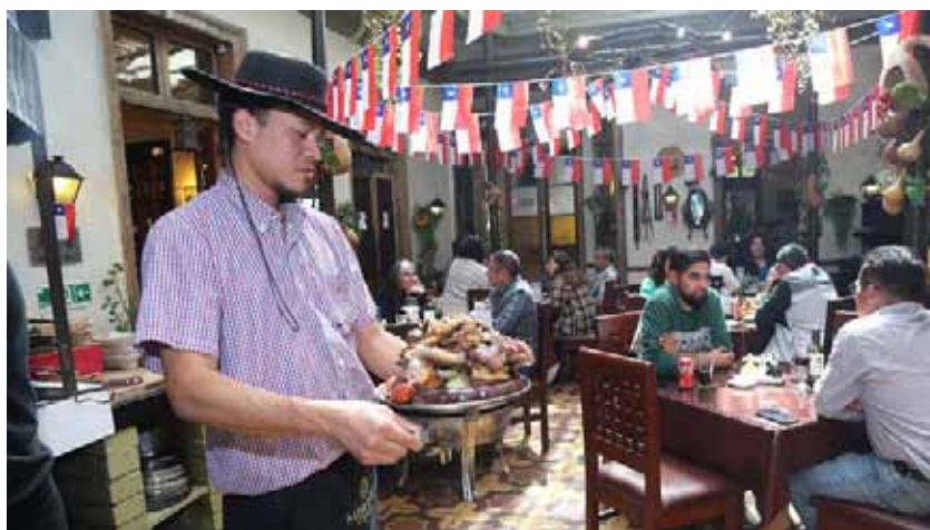
La parrillada para compartir es uno de los platos “estrella” del local. LAUTARO CARMONA

Ubicado en el casco histórico de La Serena, se encuentra este emblemático restaurante, en el cual, se rescatan los mejores platos de la cocina nacional.