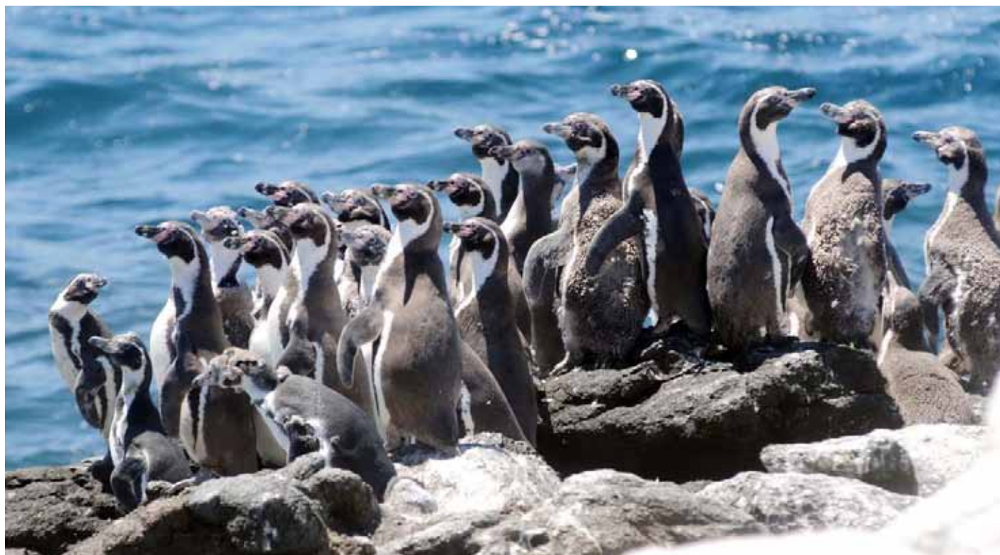
Estas aves no voladoras viven a lo largo de la costa, desde Isla Foca (Piura, al norte del Perú) hasta la Isla Guafo (al sur de Chile).

Al respecto, la ministra de Medio Ambiente, Maisa Rojas sostuvo que "esta estrategia permitirá proteger un ave vital para el equilibrio ecosistémico del país, que hoy, lamen-