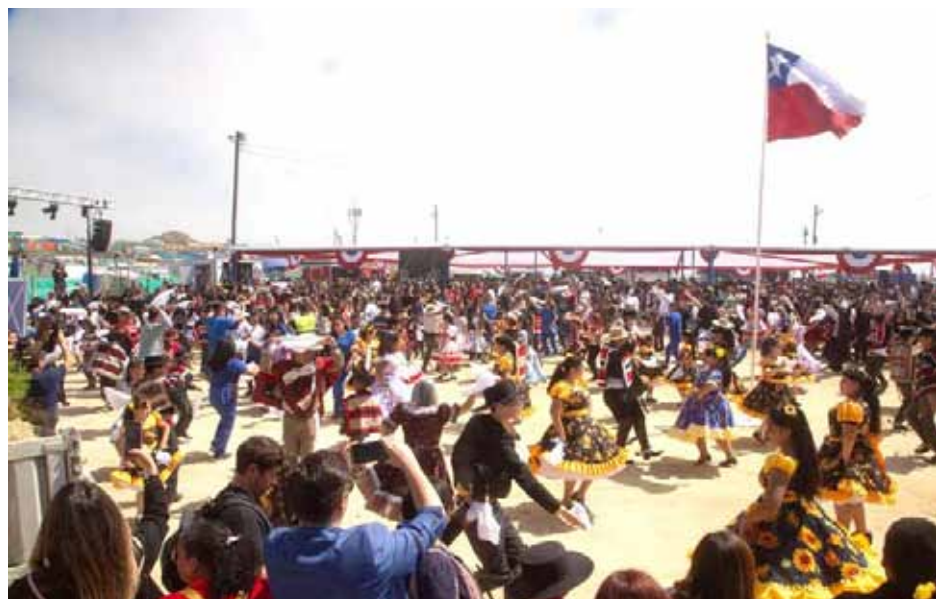
Los infaltables pies de cueca se hicieron presentes en la inauguración de La Pampilla.

se vuelven a encontrar en un espacio tan tradicional y cultural de música, de baile, pero también de sabores aquí en la comuna de Coquimbo. De verdad me siento muy contenta”, aseguró.