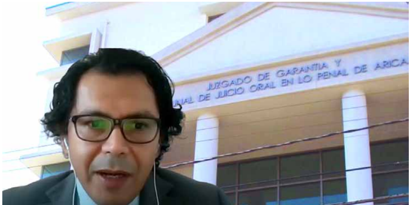
El juez Héctor Barraza es, desde el año 2018, magistrado en la ciudad de Arica.

La Corte de Apelaciones de Arica instruyó una investigación administrativa en contra del juez Héctor Barraza tras revelar la lista de testigos protegidos en la causa abierta contra integrantes del denominado clan "Los Gallegos", brazo operativo del Tren de Aragua.