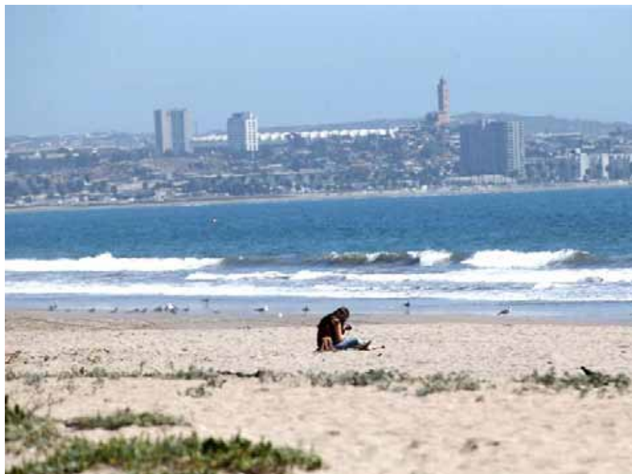
Los salvavidas se ubicarán en las playas más concurridas por los visitantes. LAUTARO CARMONA

“Por disposición de la autoridad marítima, las playas se habilitan desde el 15 de diciembre y hasta el 15 de marzo. El resto del año se implementan garantías para que, en el caso de que las personas quieran ingresar al océano, tengan protección. Eso sí, las playas no están aptas ni habilitadas porque esto necesita de diferentes