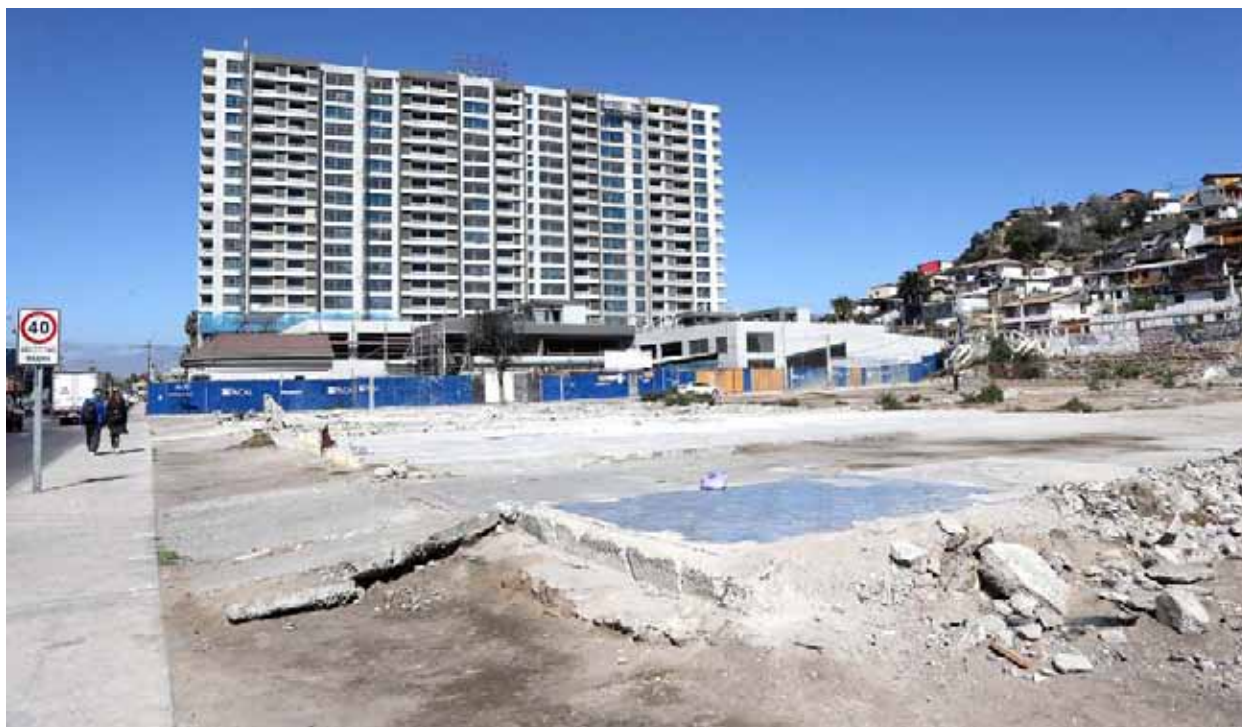
El edificio “Los Fundadores” de Baquedano, proyecto habitacional pionero de integración social y territorial, contempla espacios inundables.

Monterrey afirmó que los vecinos están preocupados “porque nos consideran