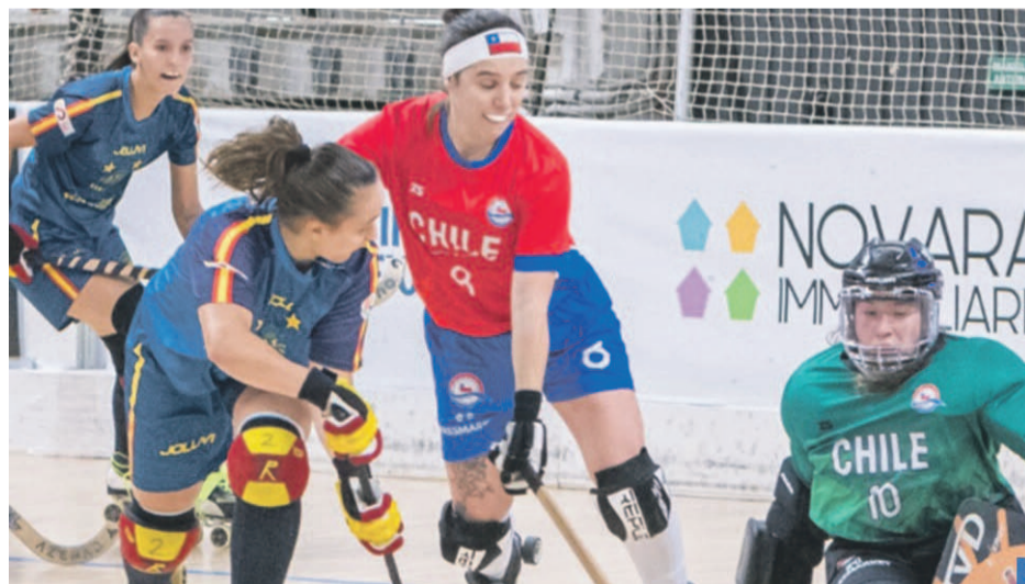
La selección femenina de hockey logró un empate a 1 frente a su similares de España.