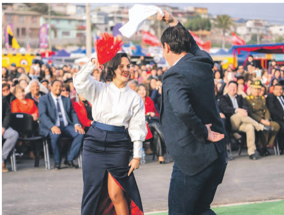
La apertura del espectáculo fue protagonizada por el pie de cueca bailado por el alcalde Ali Manouchehri y la ministra de las Culturas, las Artes y el Patrimonio, Carolina Arredondo.

Así también la ministra de las Culturas, las Artes y el Patrimonio, Carolina