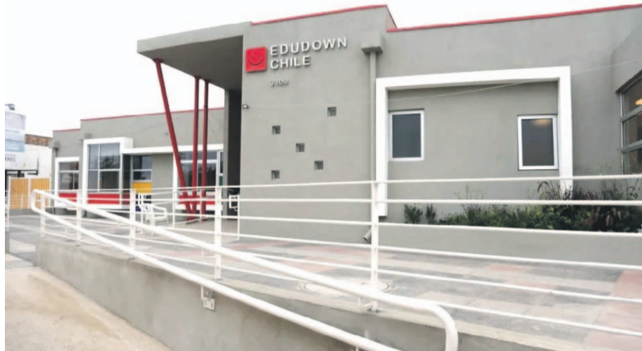
1.075 metros cuadrados tiene la superficie del centro Edudown.

“Estamos en un firme trabajo para abrir las puertas también a la comunidad TEA, para apoyar a personas con Trastorno del Espectro Autista, dado que los terapeutas que se requieren para acompañar a las personas con síndrome de Down son los mismos que necesita una persona TEA. Por otro lado queremos abrir los talleres laborales para personas adultas con ambas condiciones, para insertarlos al mundo laboral y que muchas empresas puedan cumplir con la ley”, afirmó Veas.