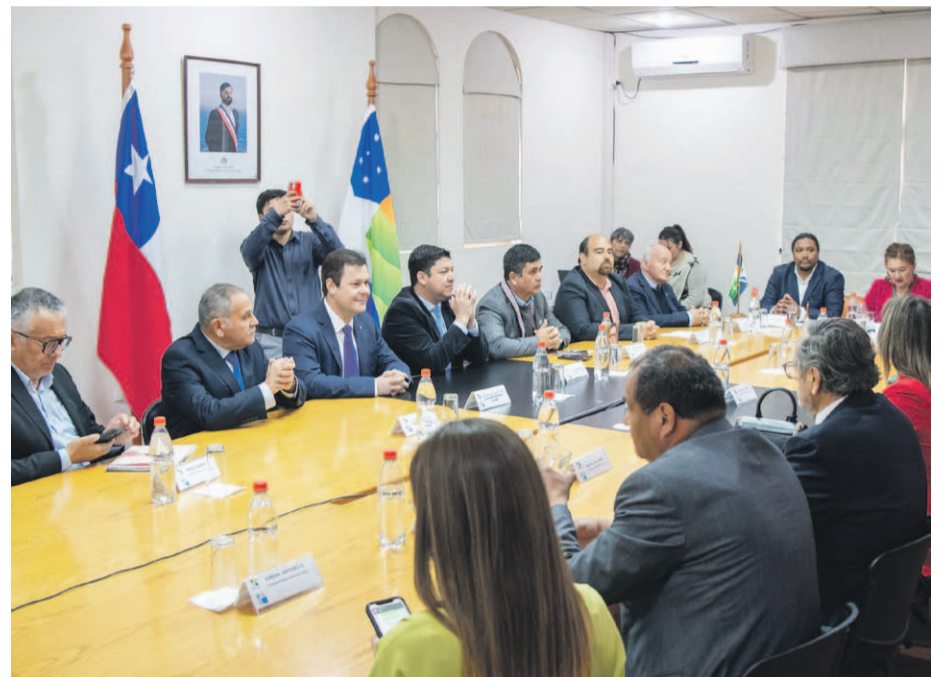
En la región son 16 los miembros que componen el Consejo Regional.