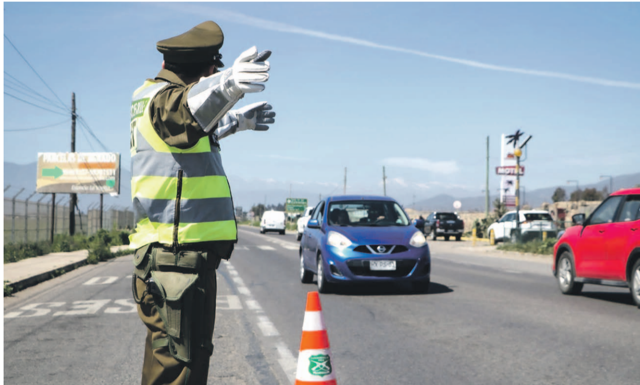
Carabineros ha resguardado y fiscalizado el ingreso de turistas a la Región de Coquimbo.

Asimismo, la autoridad gubernamental entregó algunas recomendaciones a la ciudadanía, para colaborar en el ingreso ordenado a la región. “En cuanto a los horarios, nosotros esperamos que a partir del mediodía empiece a ingresar una mayor cantidad de personas, pero eso también es variable. Nosotros aconsejamos planificar bien los viajes y tomar las precauciones del caso, como preferir los horarios de mañana. De todas formas, estamos preparados, por lo tanto no deberemos experimentar grandes aglomeraciones”, sostuvo.