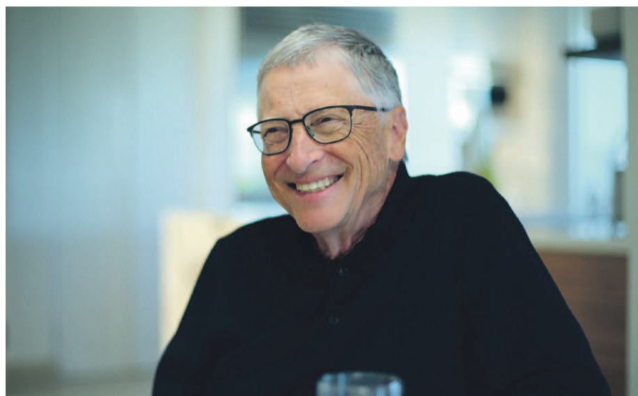
En una escena del documental, Bill Gates sonríe mientras discute sus esperanzas sobre el impacto positivo de la ciencia y la tecnología en la resolución de problemas globales y explora cómo éstas pueden desempeñar un papel crucial en la superación de los desafíos futuros.

En la serie documental “What’s Next? The Future with Bill Gates”, una producción de Netflix, el multimillonario estadounidense contacta con algunos de los pensadores y científicos más influyentes del mundo para abordar los grandes retos globales y reflexionar sobre el futuro de la inteligencia artificial, la crisis climática, la desigualdad económica y el papel de la ciencia en la erradicación de enfermedades.