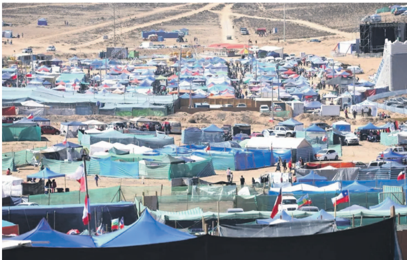
La pampilla de la Quebrada del Jardín congregaba a miles de personas hasta que fue interrumpida por la pandemia en 2020.

Según se sabe, fueron los padres de los actuales dueños los que se