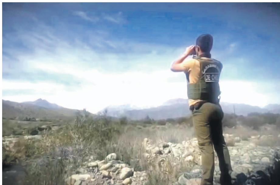
Carabineros ha desplegado una intensa búsqueda en la comuna de Monte Patria.

Familiares y carabineros continúan buscando a esta pareja de amigos, quienes fueron vistos por última vez el pasado lunes 26 de agosto. Las diligencias han contado con labores de diversas unidades policiales especializadas y se trabaja en base al menos dos hipótesis: intervención de terceras personas o desaparición voluntaria.