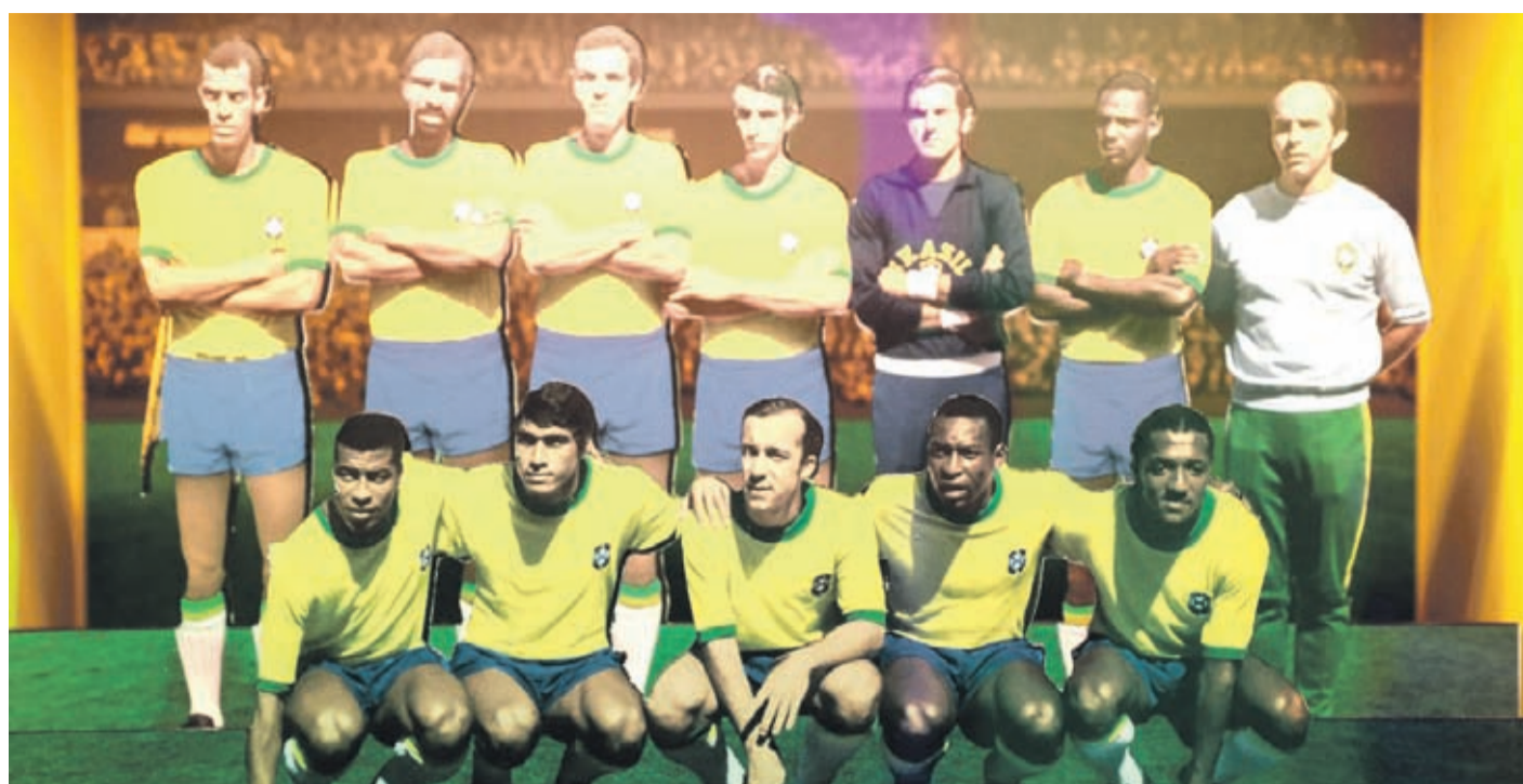
Fotografía de una de las obras de la exposición “Pelé 80 - El rey del fútbol”.

Una vida repleta de éxitos deportivos que consiguió romper con el racismo estructural de su país y sobrepasó las canchas de fútbol para transformarse