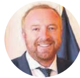
PABLO HERMAN INTENDENTE

“El hecho de atender en terrazas y espacios abiertos a la gente, nos viene a complementar lo que es la venta al paso y el delivery, que ya están ejecutando la mayoría de los restaurantes”.