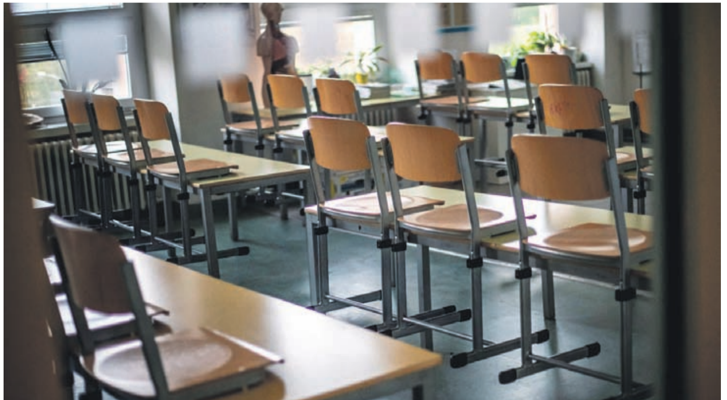
Tres centros de educación superior ya retomaron las actividades presenciales. El lunes se suma el IP-CFT Santo Tomás en Ovalle .