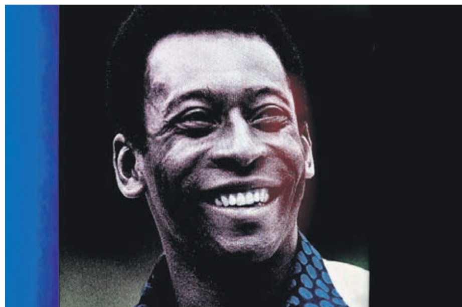
Pelé acaparó las portadas de las más prestigiosas revistas especializadas y recibió ofertas de los grandes clubes europeos.

El mundo comenzó entonces a hablar de este joven de 17 años, negro,