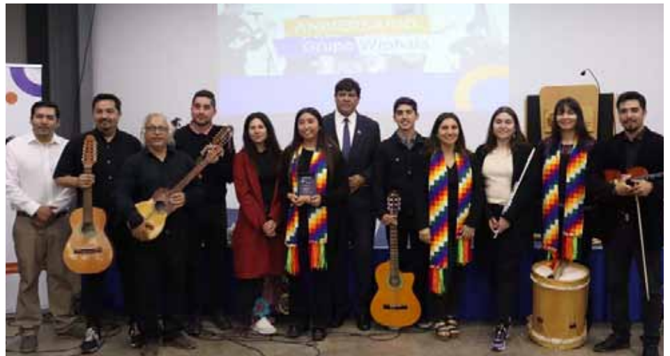
Reconocimiento por 6º Aniversario grupo Wiphala de UCentral Región Coquimbo.