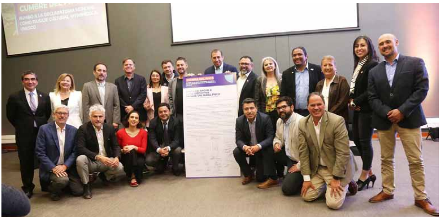
CUMBRE DEL PISCO: BUSCAN DECLARATORIA MUNDIAL DE LA UNESCO 14 y 15

DUDAS SOBRE DESPLIEGUE PARA FIESTA GRANDE 11