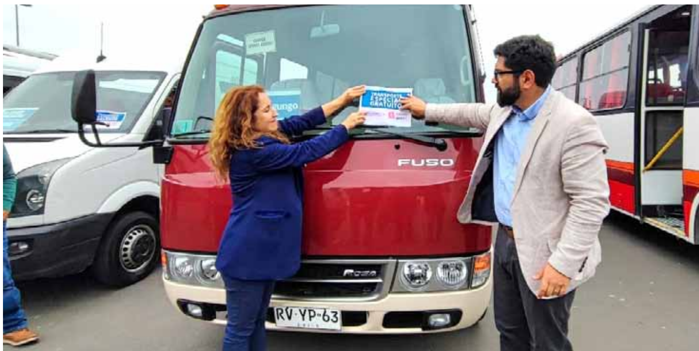
Serán más de 200 los recorridos públicos y gratuitos que estarán disponibles en toda la región para este domingo.