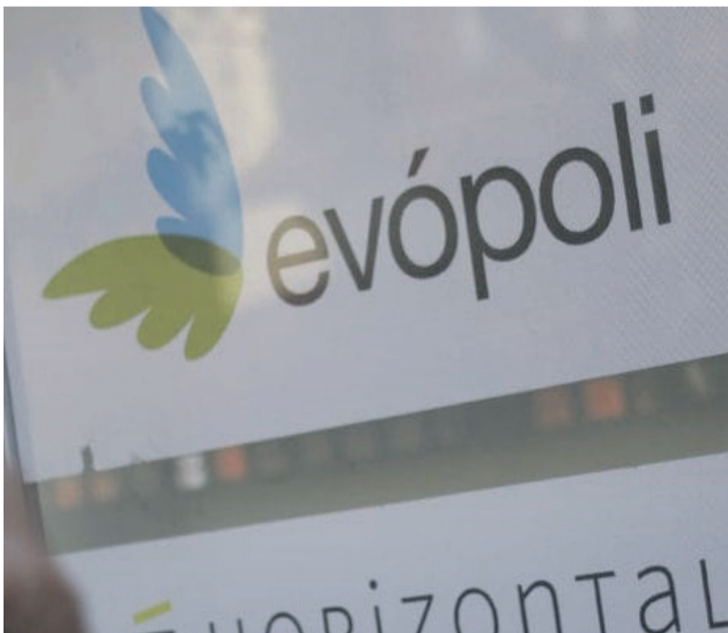
Una de las listas en competencia apuntó a la empresa contratada para llevar a cabo el proceso online de haber impedido a una gran cantidad de militantes ejercer su voto.

La decisión de suspensión indefinida se tomó finalmente durante la jornada de ayer. Según acusó en un comunicado