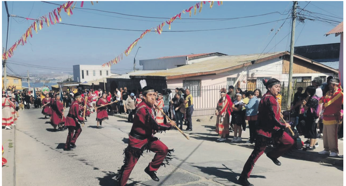
Los bailes chinos son quizás una de las mayores expresiones de fe y religiosidad que se pueden observar durante los días de la Fiesta de la Virgen de Andacollo, la festividad religiosa con mayor convocatoria de fieles de la Región de Coquimbo.

“La responsabilidad es bastante grande. Es lo máximo a lo que uno puede aspirar en este ambiente de los bailes religiosos, a pesar de que yo nunca lo aspiré. La responsabilidad es también por dirigir los más de 100 bailes religiosos que vienen a Andacollo, que es una satisfacción muy bonita. Es algo que a uno lo llena de fe, de alegría, como también de muchas tristezas cuando las cosas no salen bien”, afirma.