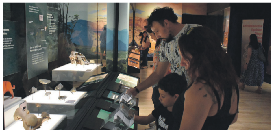
Para conocer los horarios de cada una de las actividades en los establecimientos inscritos, se debe acceder al sitio web museosenverano.cl .

al sitio web museosenverano.cl , en donde, además, se podrá conocer