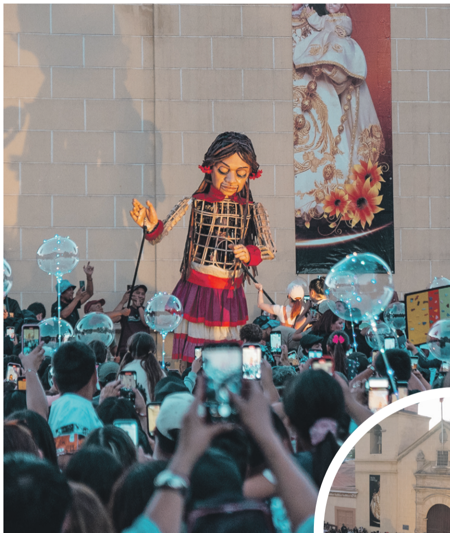
Cientos de personas se echaron a las calles de la comuna para dar la bienvenida a Amal.