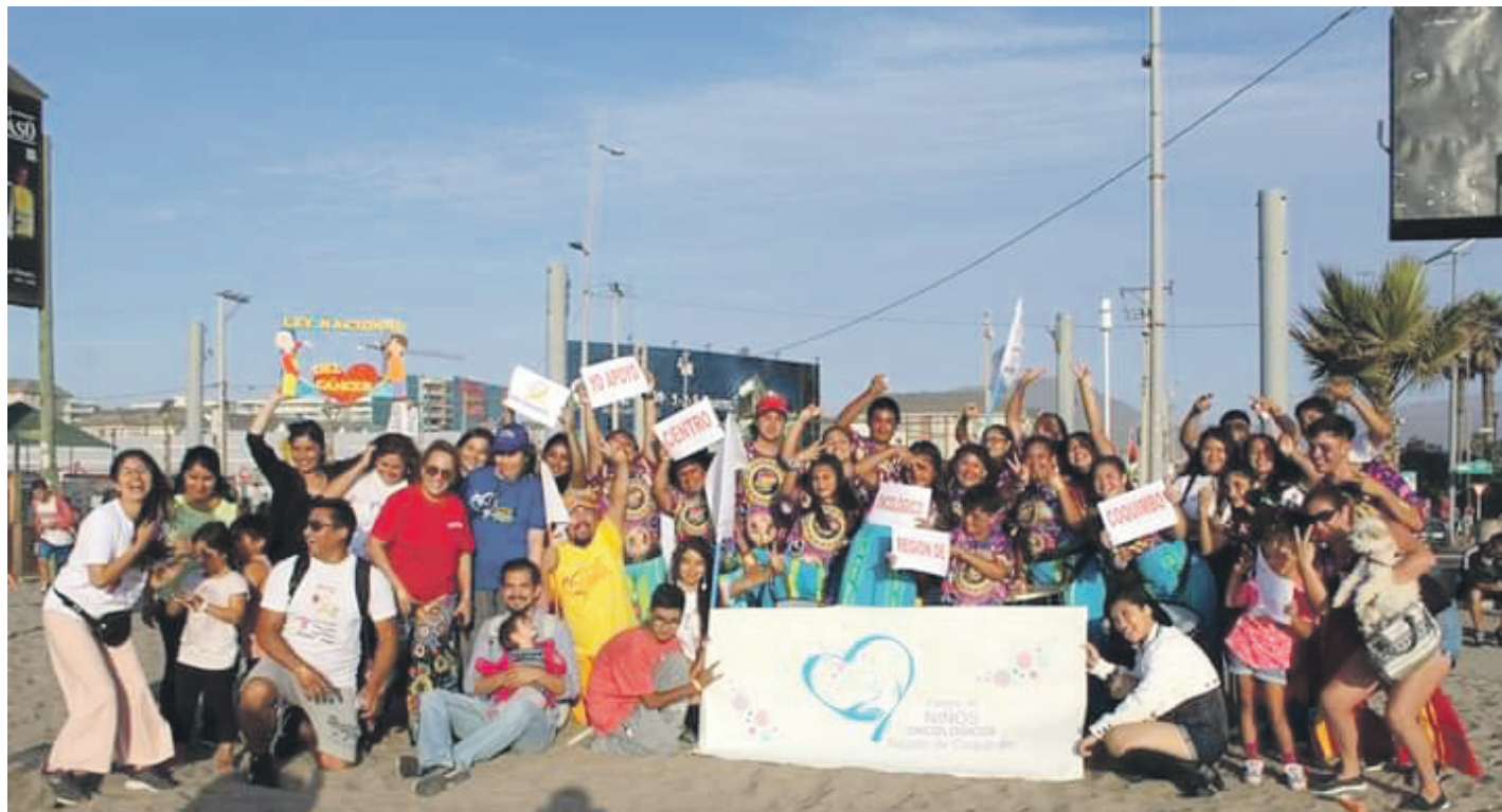
La fotografía muestra la actividad realizada en la avenida del Mar, a cargo de organizaciones vinculadas al cáncer infantil.

“La idea original era que ella apenas regresara a la región pudiese comenzar a atender, pero habrá un tiempo de espera,