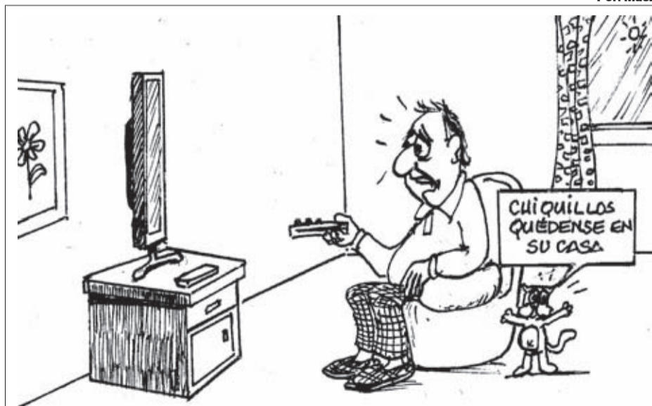
VIRUS EN LA TELE

¡¡Estos 'expertos' de los Matinales me tienen recontra confundido!!