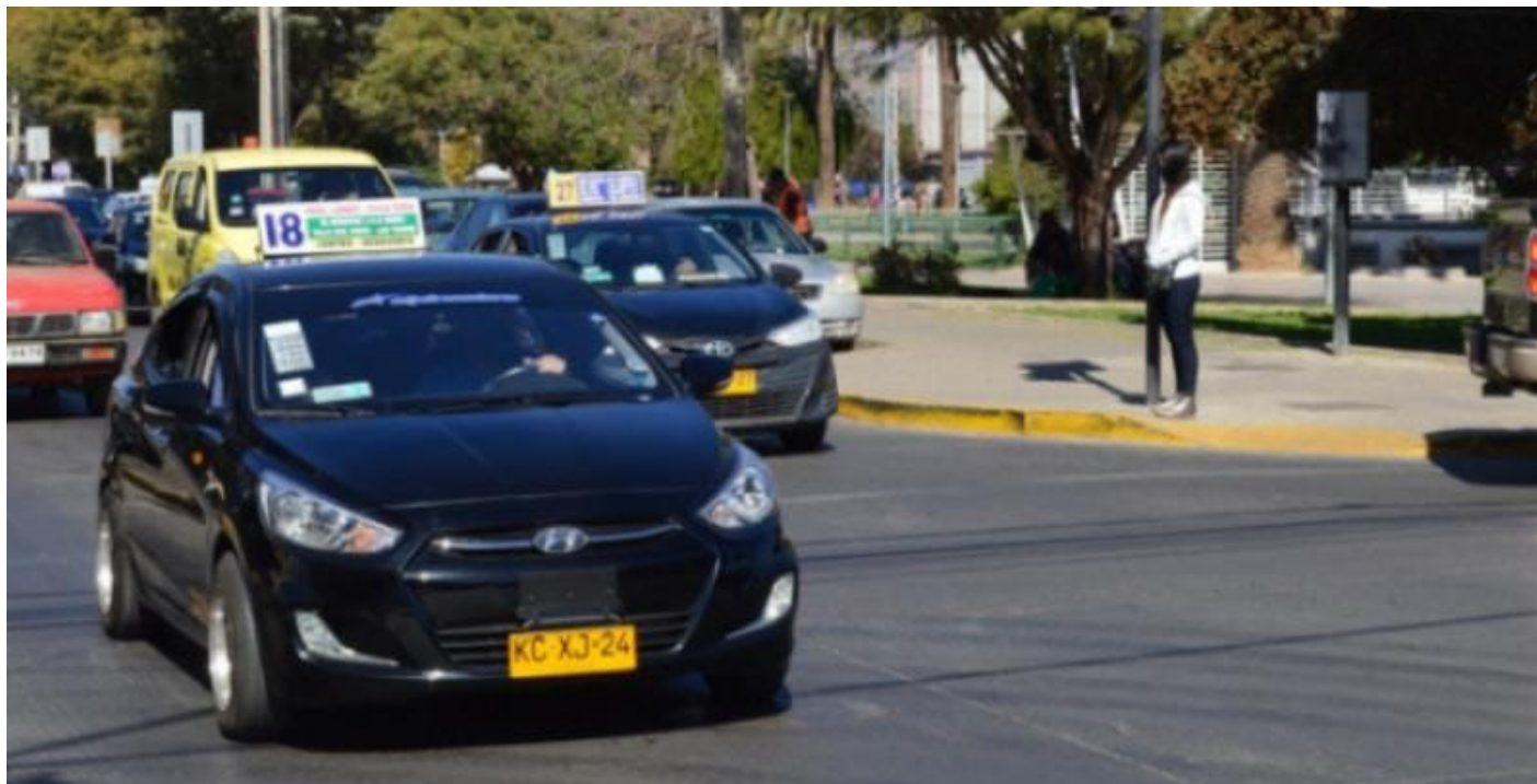
Cerca de 500 conductores de la locomoción colectiva tiene problemas por el colapso en la renovación de licencias de conducir. EL OVALINO

De esta manera, Pinto espera que desde la municipalidad se puedan