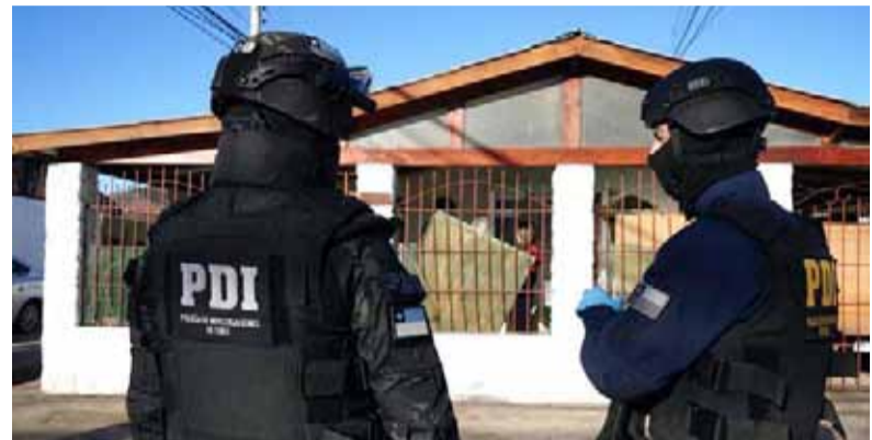
La denuncia anónima se puede desarrollar en forma confidencial, marcando el fono *4242