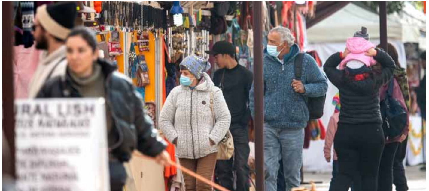
El cuadro respiratorio puede llegar a durar dos semanas e incluso más días si es que hay coinfección.

En la misma línea, el profesional agrega que “se suele manifestar como una enfermedad respiratoria de la vía alta, es decir faringe, laringe en algunos casos y en casos muy raros podría generar una neumonía con alguna complicación respiratoria”. La persona afectada presenta tos y congestión nasal, llegando incluso a fiebre y dificultades respiratorias en