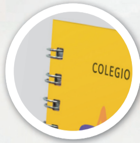
Anillado doble cero metálico