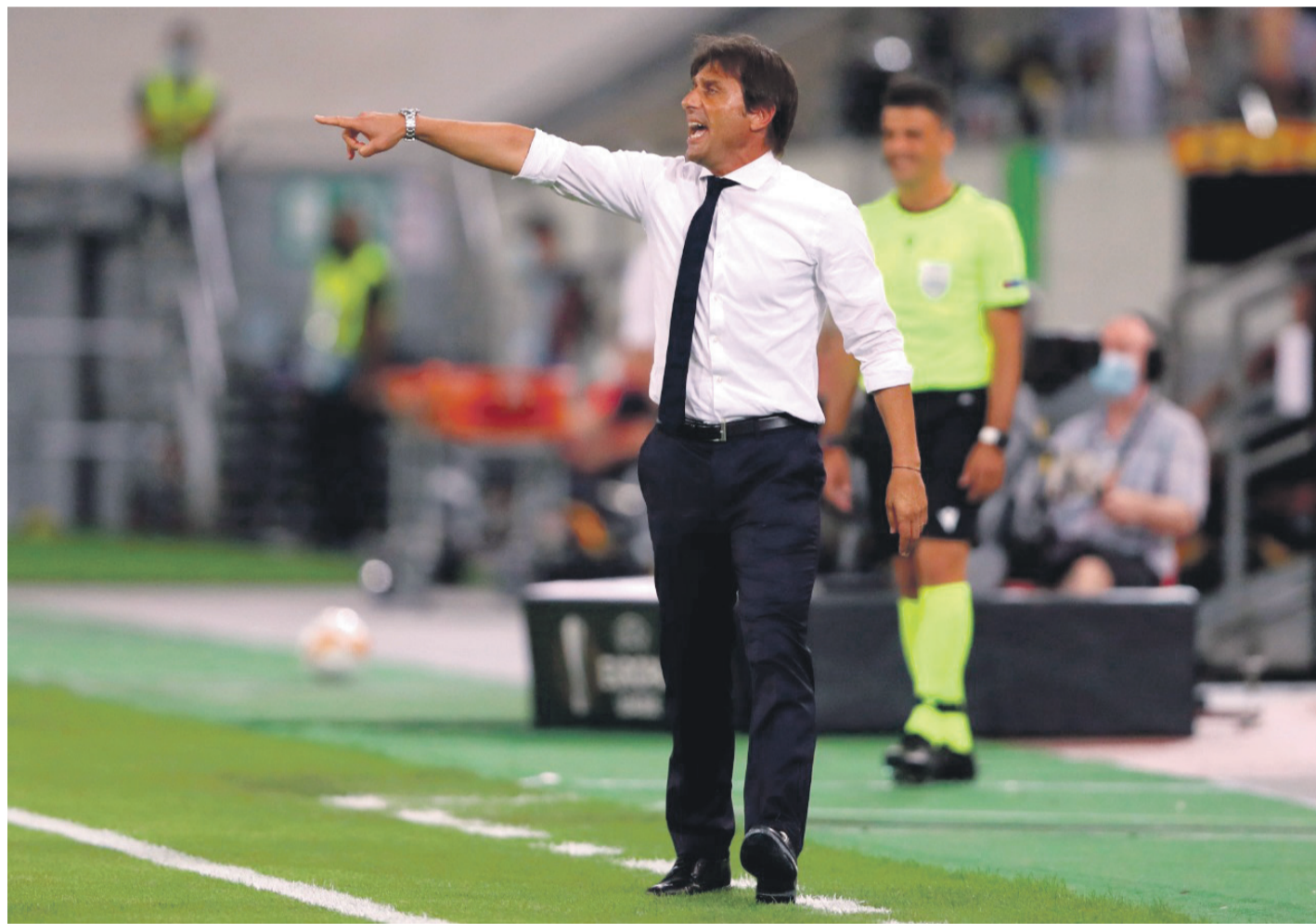
Conte manifestó su profundo respeto por el trabajo del Shakhtar y le consideró como el equipo más fuerte que le ha tocado hasta ahora en la Europa League.

Alexis se lesionó en el bíceps femoral del muslo derecho en los cuartos de final contra el Bayer Leverkusen y, además de no estar en el duelo de este lunes contra el Shakhtar, tiene muy complicado llegar a la eventual final del 21 de agosto en Colonia.