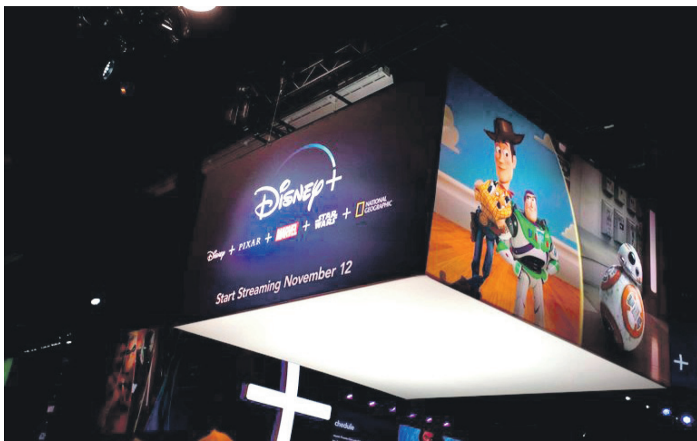
En Estados Unidos, Disney+ tiene un precio de 6,99 dólares al mes o de 69,99 dólares por todo el año. EFE

desde entonces ha ido llegando progresivamente a más mercados en todo el mundo.