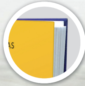
Tapa dura (emplacada)