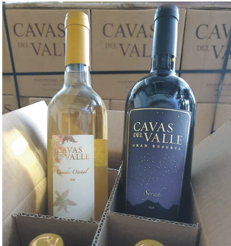
Los descuentos y la fiel clientela son los ejes para el sustento de algunas viñas.

En cuanto a la proyección y visión de la reapertura en el turismo de la zona, los protocolos de seguridad ya se comienzan a trabajar a modo local. “Vamos a acatar lo que se decida en grupo. En el fondo estamos funcionando muy en comunidad en la comuna de Paihuano y en ese