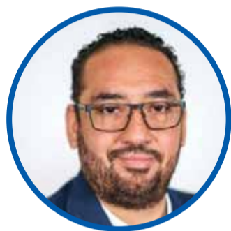
Nicolás Cataldo MINISTRO DE EDUCACIÓN

Militante del Partido Comunista y el primer ministro de Educación de esta colectividad. Es profesor de Historia de profesión y antes fue Subdere, logrando un gran respaldo en su gestión, incluso desde la oposición.