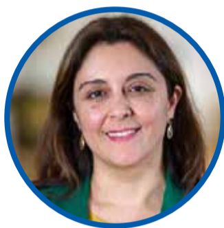
Marcela Sandoval MINISTRA DE BIENES NACIONALES

Militante del Partido Radical e ingeniera comercial. Fue ministra de Minería durante el segundo gobierno de Michelle Bachelet. Hasta antes de asumir, presidió el directorio de Enami y fue seremi del MOP en Antofagasta.