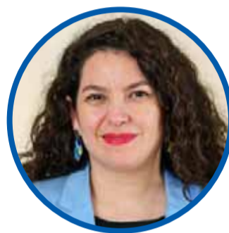
Javiera Toro MINISTRA DE DESARROLLO SOCIAL