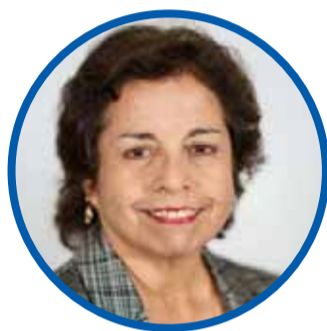
Aurora Williams MINISTRA DE MINERÍA

Militante del Partido Comunista y el primer ministro de Educación de esta colectividad. Es profesor de Historia de profesión y antes fue Subdere, logrando un gran respaldo en su gestión, incluso desde la oposición.