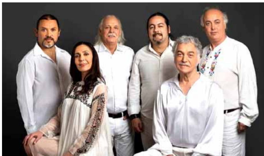
"Mira Niñita", "Sube a nacer conmigo hermano" o "Hijos de la Tierra" resonarán en La Pampilla el próximo 20 de septiembre, como gran broche de oro de esta tradicional fiesta.

Mientras tanto, la organización mantiene conversaciones con otro par de artistas, por lo que no se descartan nuevas sorpresas en los próximos días. Con el cantante urbano, Pailita, en tanto, sigue el tira y afloja por el tema económico.