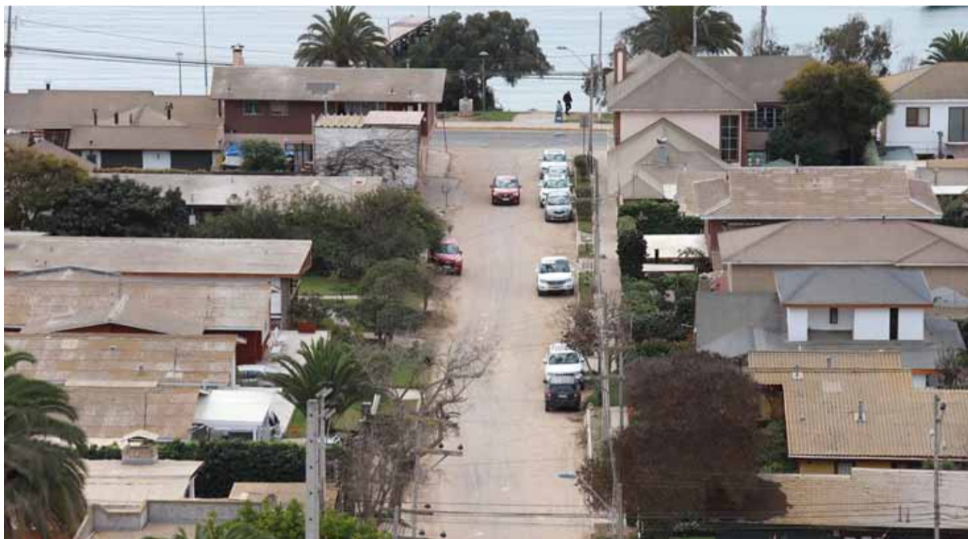
La Herradura y El Panul serán los primeros sectores de la comuna de Coquimbo en ser beneficiados con estas mejoras.

Dicho instrumento considera el arriendo de maquinarias para mejorar una serie de caminos privados que existen en diversos sectores de la comuna de Coquimbo, las cuales llevan años sin intervenir.