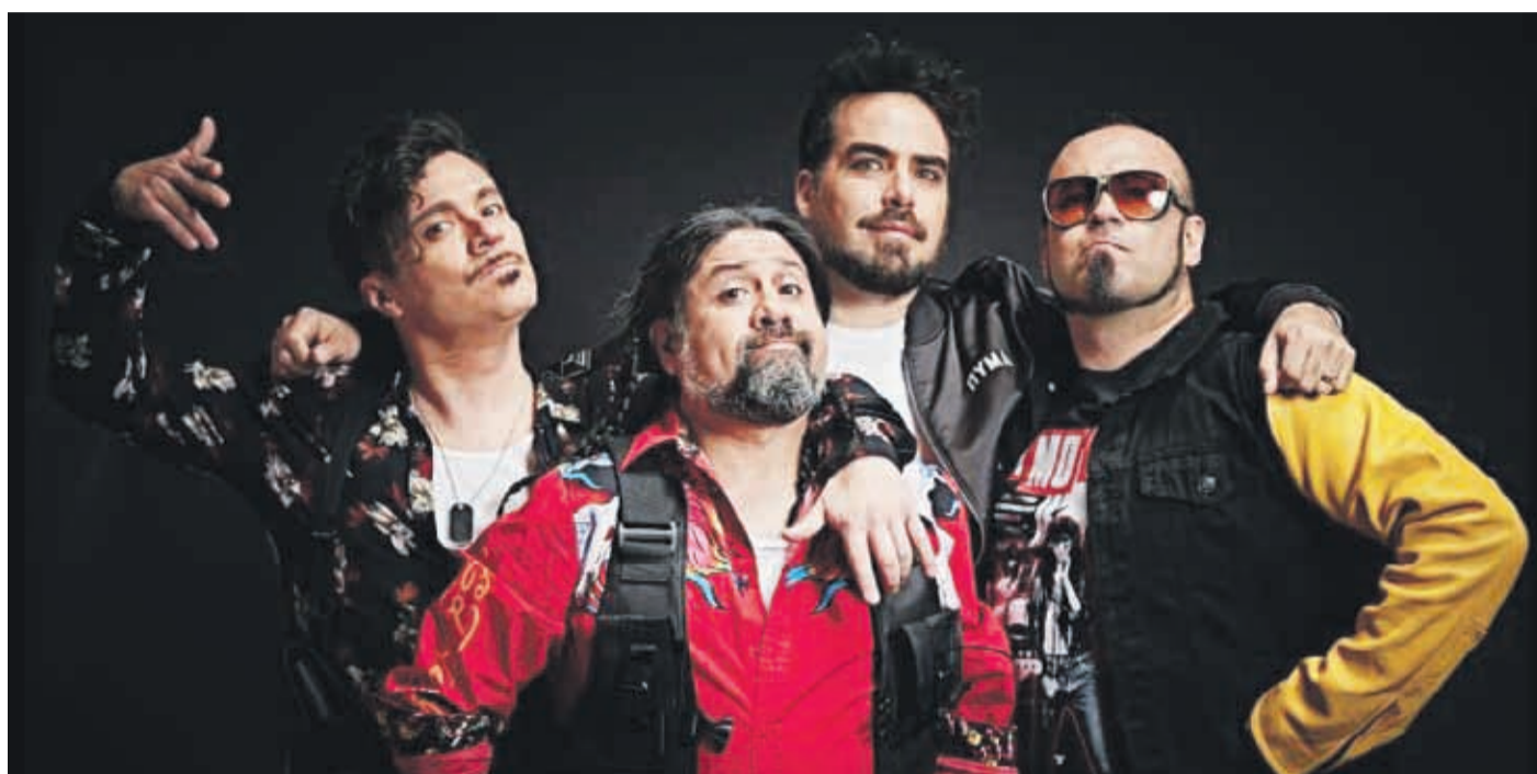
La banda nacional asegura que vuelve al escenario porteño con muchas ganas de tocar sus éxitos.