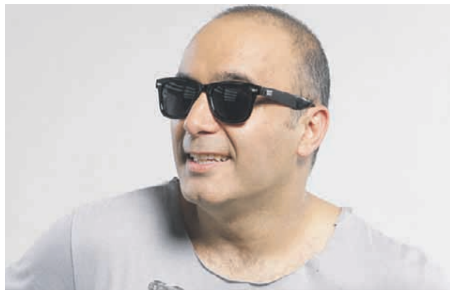
El comediante es también conductor de “Sacando la Vuelta” en Radio Carolina. CAROLINA.CL