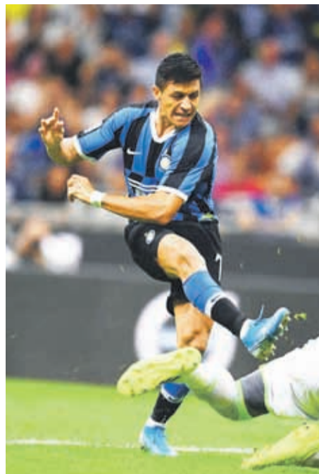
Alexis Sánchez no fue incluido por Antonio Conte, pese a que el partido requería de un jugador con las características del chileno.