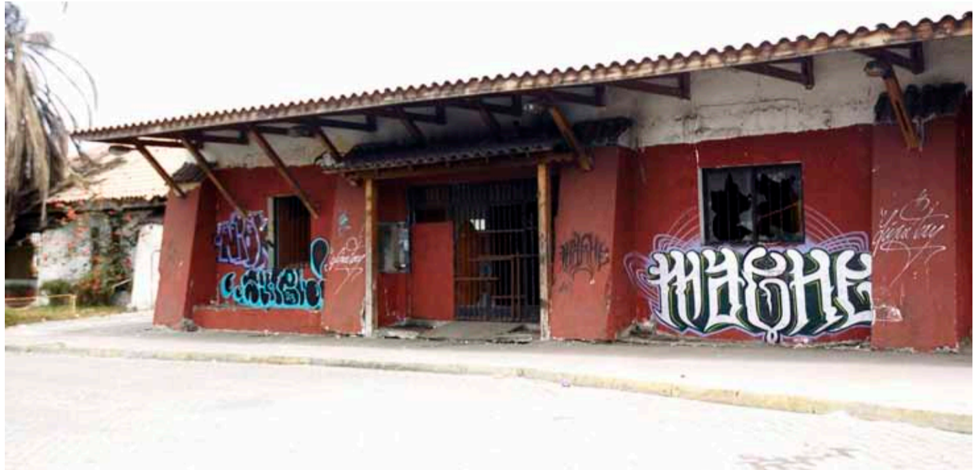
El ex terminal de buses ubicado a un costado de la ruta 5, aun conserva los daños producidos por las manifestaciones.

Mientras que desde la Municipalidad de Coquimbo afirmaron que se rehabilitaron la mayoría de los semáforos y cámaras de televigilancia, en La Serena destacaron la recuperación del equipamiento instalado en la vía pública. Sin embargo, en esta última comuna, aún queda por restaurar el antiguo terminal de buses ubicado en la ruta 5, además de las estatuas de la avenida Francisco de Aguirre.