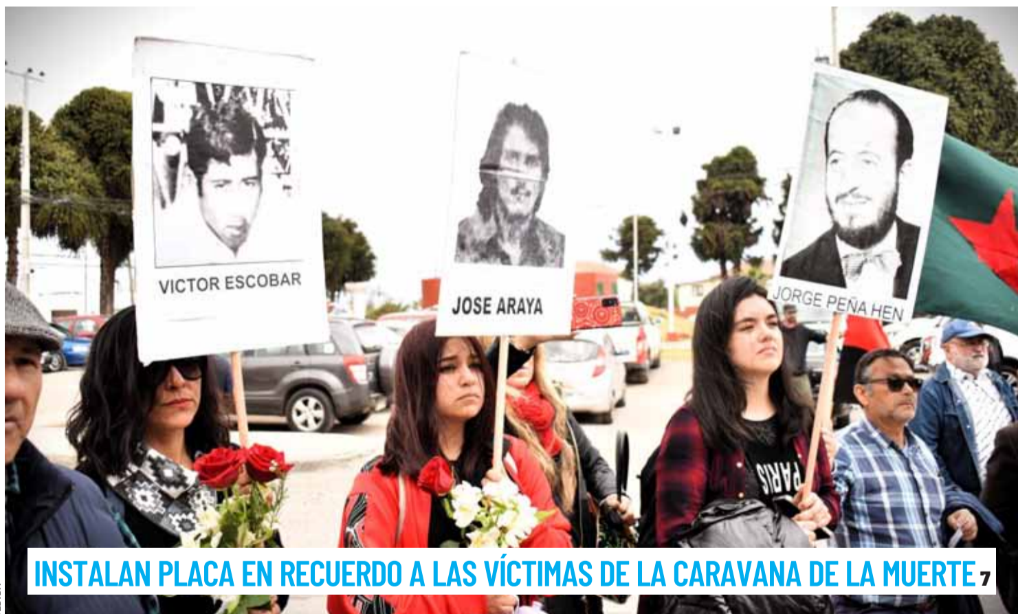
INSTALAN PLACA EN RECUERDO A LAS VÍCTIMAS DE LA CARAVANA DE LA MUERTE 7