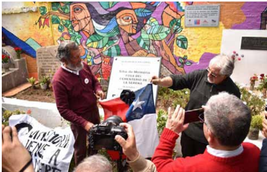
En el Cementerio Municipal de La Serena se congregaron familiares y amigos de los 15 fusilados por la Caravana de la Muerte para instalar una placa en su recuerdo.

Ayer, los familiares de las personas fusiladas por la comitiva militar enviada por Augusto Pinochet y que dejó un saldo de muertes durante su paso por distintas ciudades, entre ellas La Serena, pusieron una placa en el lugar donde fueron encontrados sus restos 25 años después de su asesinato.