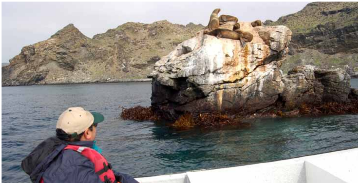
Los pescadores esperan que finalmente, el área marina protegida impulsada por el gobierno, no se materialice.