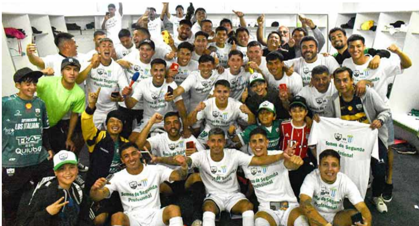
Con una campaña sobresaliente, Provincial Ovalle logró su objetivo de ascender al profesionalismo.

El Ciclón del Limarí superó por 2 goles a 1 a Unión Compañías este sábado recién pasado, timbrando así, el ascenso a Segunda División del fútbol chileno. En la jornada dominical, tras el traspie sufrido por el sublíder, Concón National, que empató de local ante Provincial Ranco, el cuadro ovalino se coronó automáticamente campeón, a dos fechas del cierre del torneo.