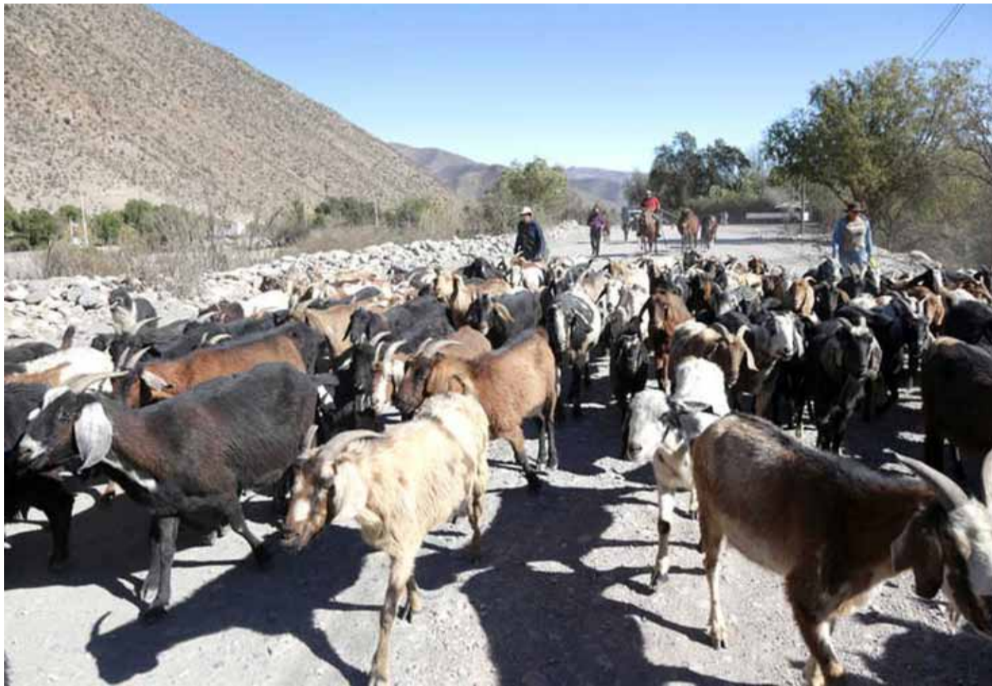
Las veranadas no han sido autorizadas desde hace varias temporadas.