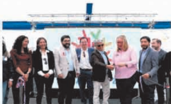
Inauguración Expo ASOINCO 2023, en la que participaron autoridades a nivel municipal y de gobierno.