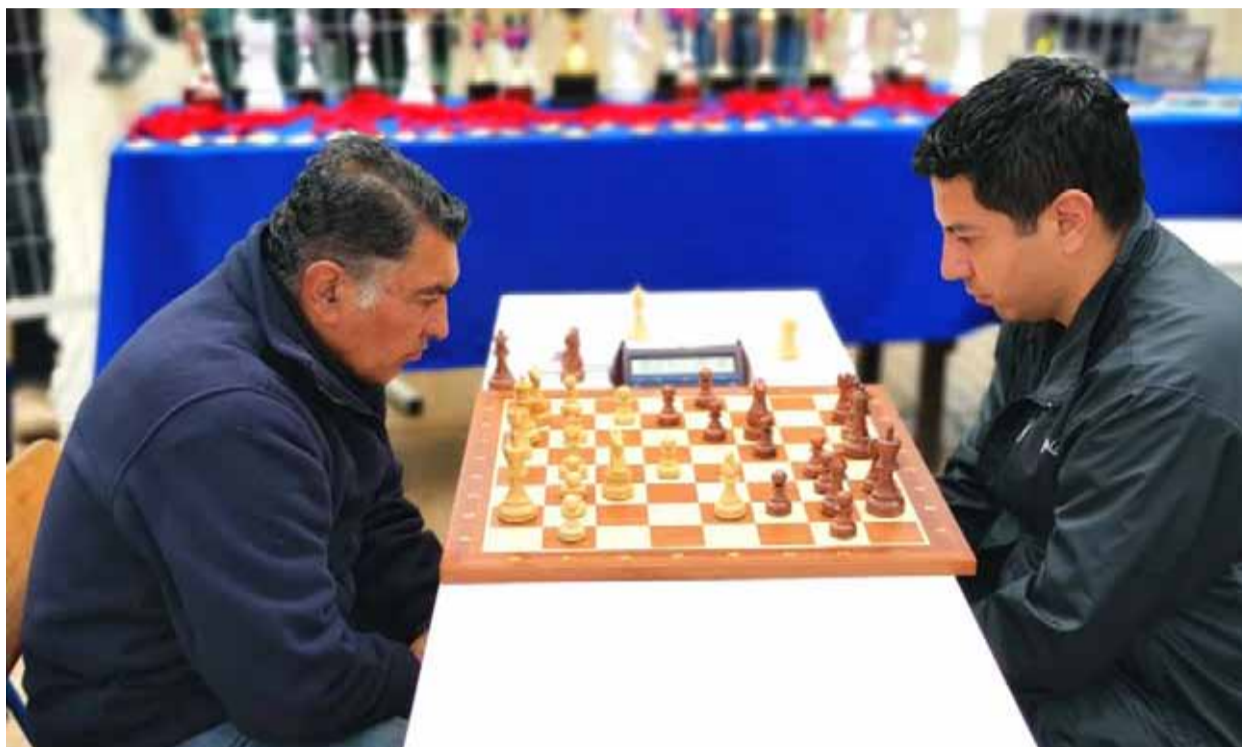
En las dependencias de la municipalidad porteña se desarrollará el torneo que festeja a los ajedrecistas.

Mañana se disputará en la municipalidad de Coquimbo el tradicional torneo que contará con jugadores de Ovalle, La Serena y la ciudad-puerto. Las partidas se iniciarán a las 10:30 horas.