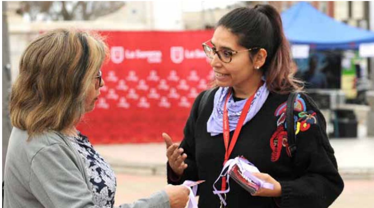
La educación de la población será uno de los focos que contemplará la nueva ordenanza aprobada por el Concejo Municipal.

La iniciativa busca resguardar la dignidad e integridad de las personas que viven o transiten por la comuna. Se hará efectiva mediante un enfoque educativo, preventivo y sancionatorio, con multas que van de 2 a 5 UTM.