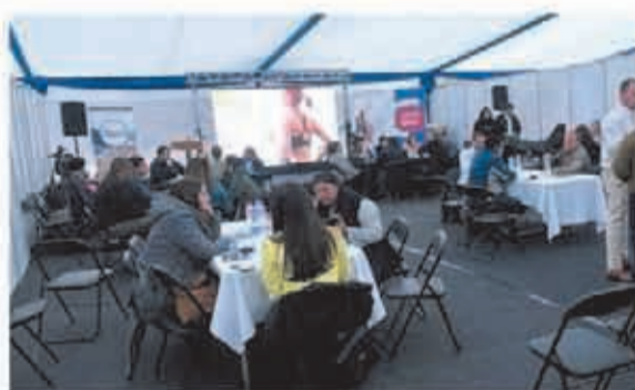
Rueda de Negocios para proveedores Mineros organizada en colaboración con SERCOTEC.