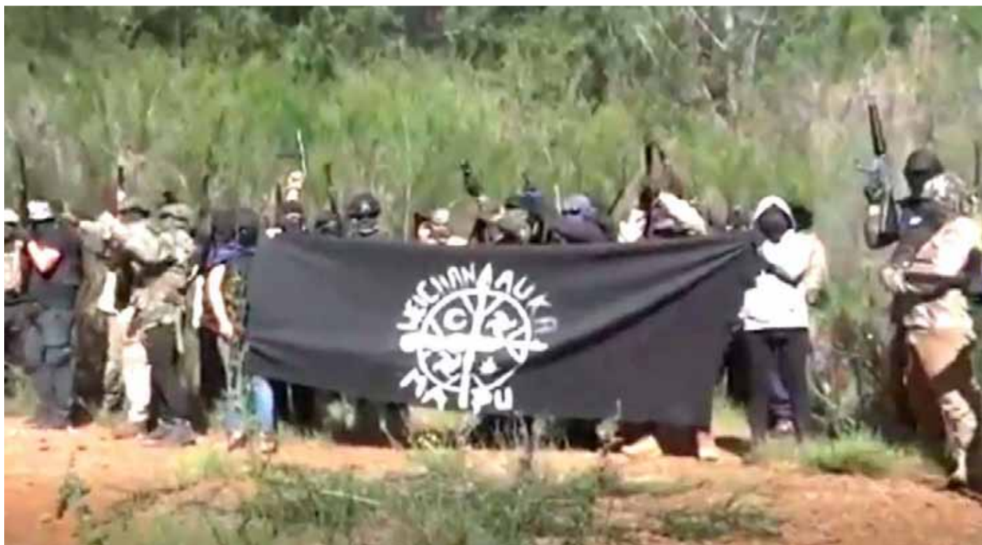
Parapetados de armamento de grueso calibre, la agrupación radical mapuche es una las más violentas de las que se existen en La Araucanía y la Provincia de Arauco.