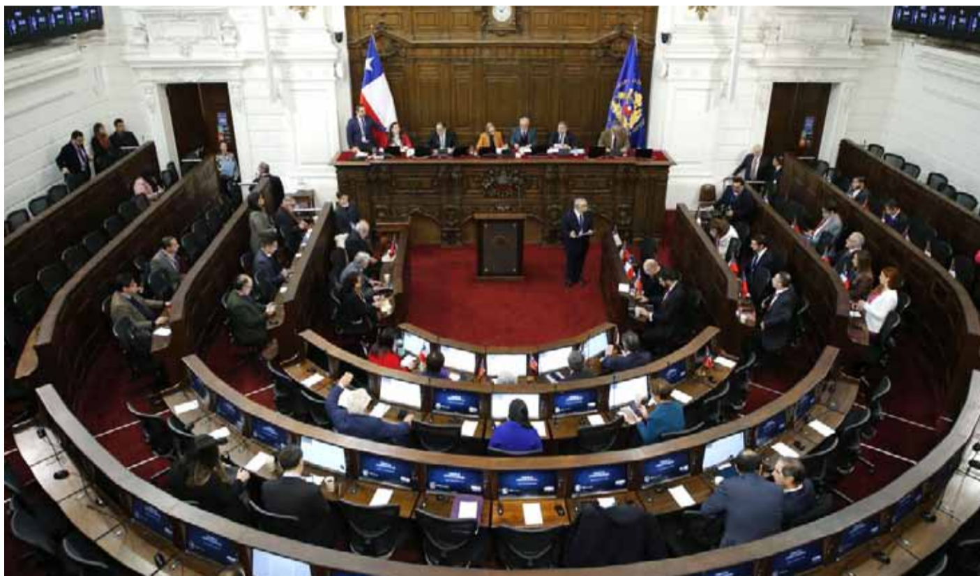
Después del rechazo a la primera propuesta de Constitución, se debió conformar un nuevo consejo para redactar otro borrador de texto.