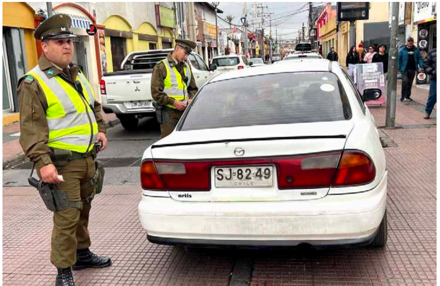
Ya no sólo existe una alta sensación de inseguridad, sino también, los delitos están sucediendo con mayor frecuencia.

Desde convocar al Consejo de Seguridad Nacional, crear una agencia contra el crimen organizado, hasta dotar de más recursos a Carabineros y la PDI, son algunas de las propuestas que piden los representantes regionales en el Congreso Nacional. Incluso, se le solicitó al ejecutivo la implementación de un “estado de excepción de carácter nacional”.